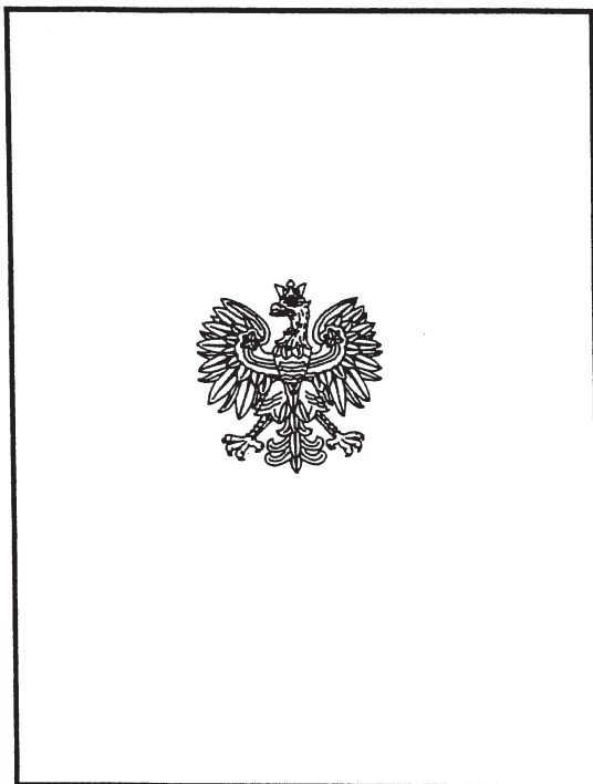
Zewnętrzna strona legitymacji