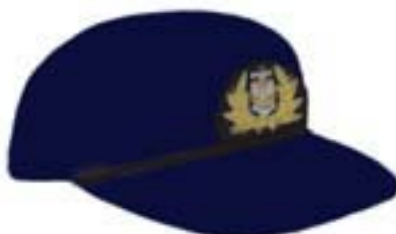
Wzór nr 1b — Czapka typu sportowego