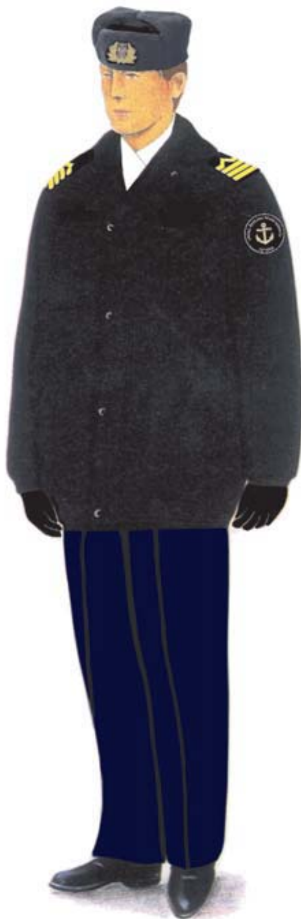
f) umundurowanie zimowe