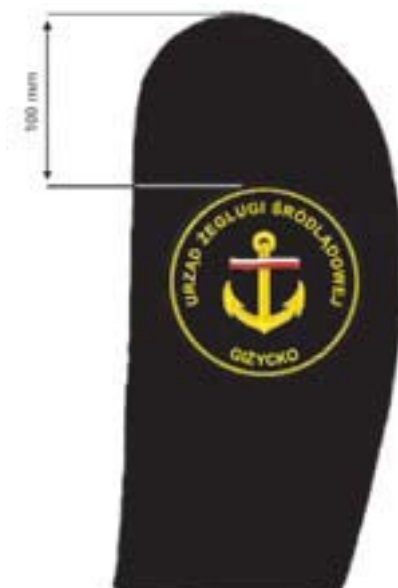
Wzór nr 10a — Sposób umieszczania emblematu na rękawie