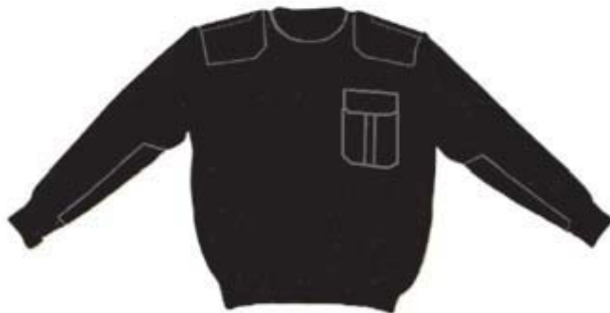
Wzór nr 4 — Sweter