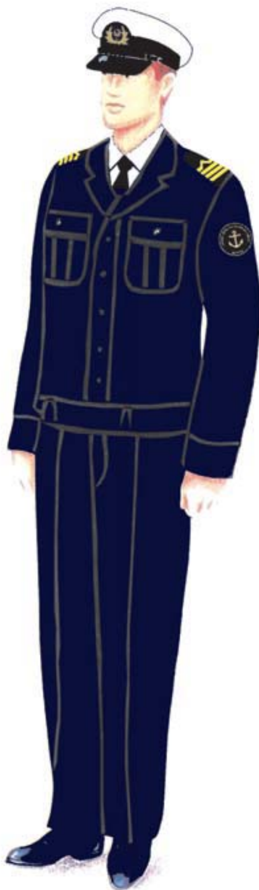
d) umundurowanie letnie z bluzą olimpijką