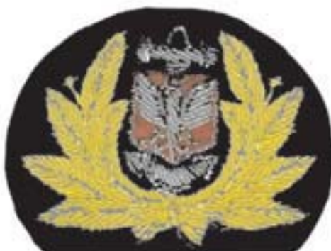
Wzór nr 9 — Emblemat na czapkę