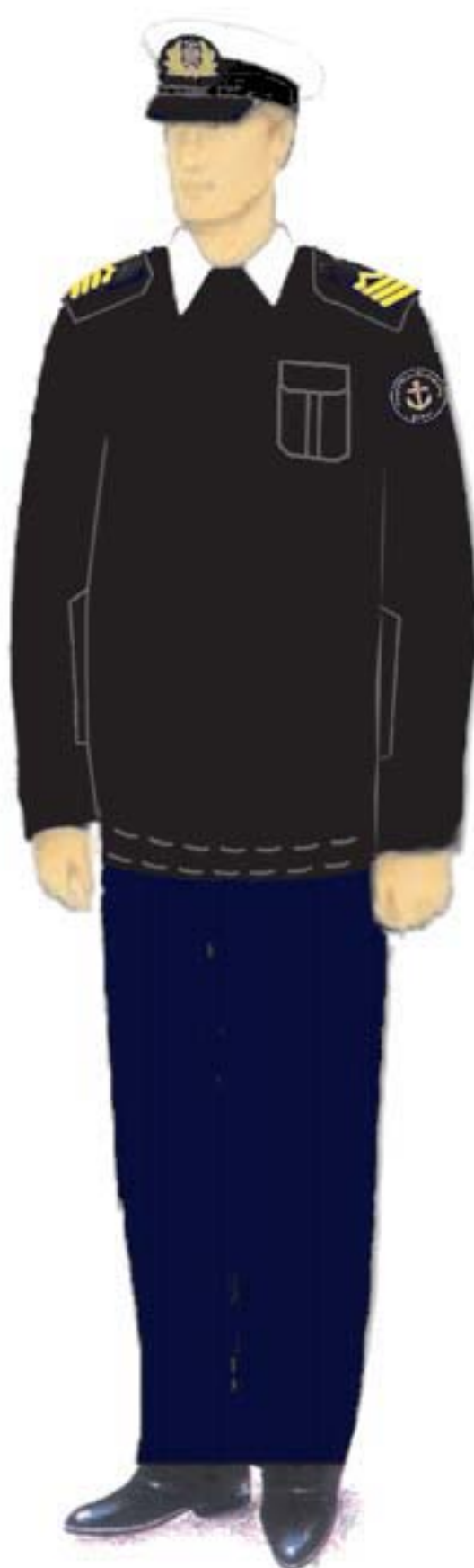
c) umundurowanie letnie ze swetrem