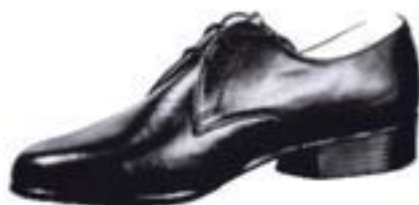
Wzór nr 8 — Półbuty