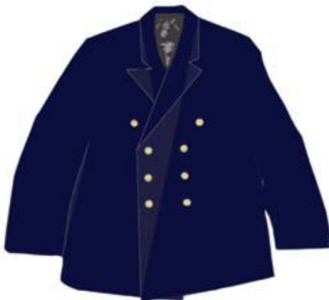
Wzór nr 2 — Marynarka mundurowa