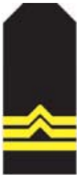
b) starszy inspektor