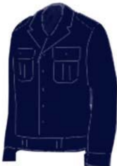
Wzór nr 6 — Bluza olimpijka