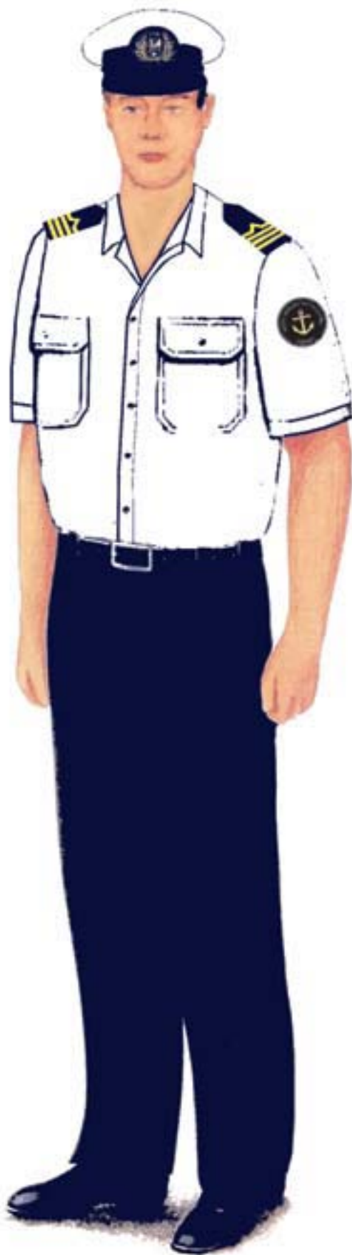
b) umundurowanie letnie z koszulą z krótkim rękawem