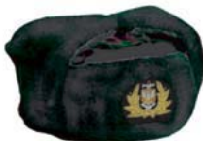
Wzór nr 1c — Czapka futrzana