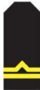
d) młodszy inspektor