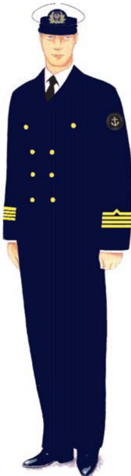
a) umundurowanie wyjściowe