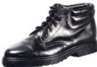
Wzór nr 7 — Botki ocieplane