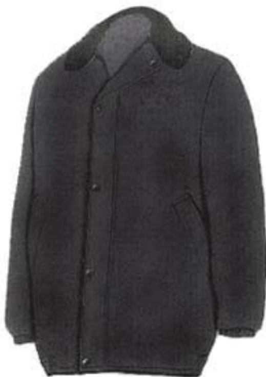
Wzór nr 5 — Kurtka