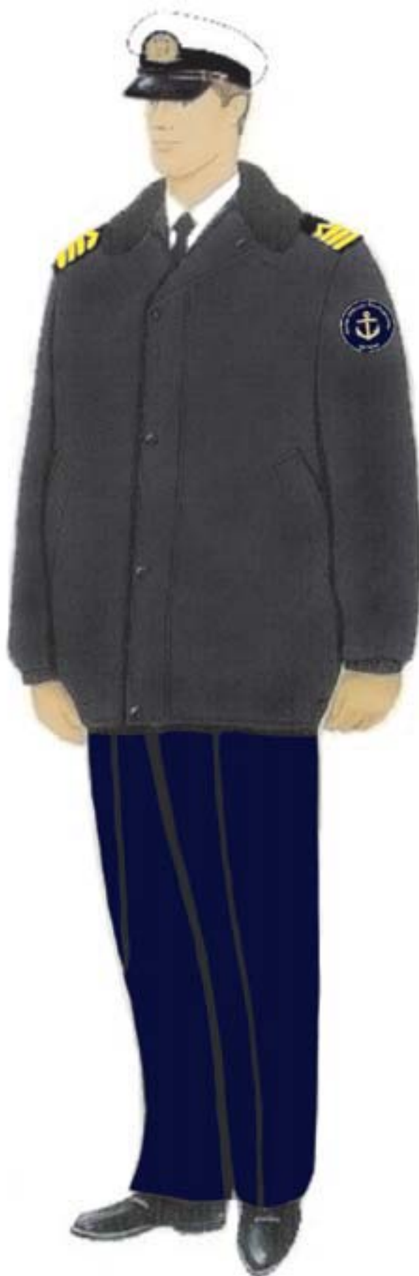
e) umundurowanie z kurtką