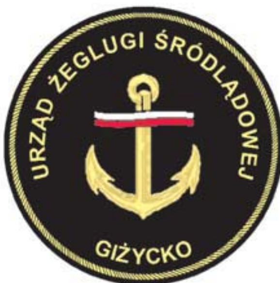
Wzór nr 10 — Emblemat na rękaw