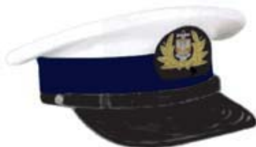
Wzór nr 1a — Czapka typu marynarskiego