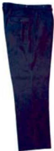
Wzór nr 3 — Spodnie