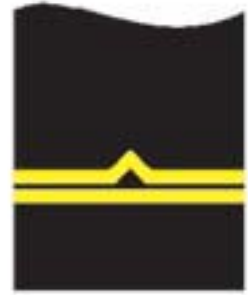
d) młodszy inspektor