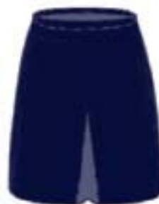
Wzór nr 3a — Spódnica