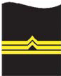
b) starszy inspektor