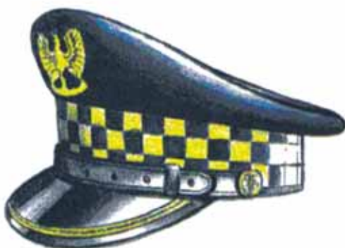
Rys. 2. Czapka służbowa okrągła z jednym galonem dla naczelnika, zastępcy naczelnika, kierownika i zastępcy kierownika