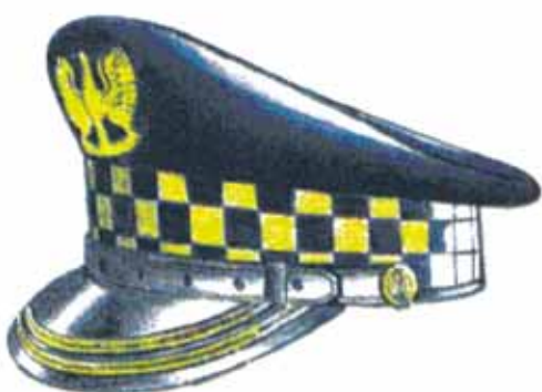
Rys. 3. Czapka służbowa z dwoma galonami dla komendanta i zastępcy komendanta