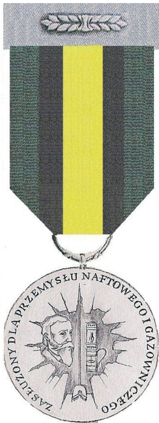
STRONA LICOWA Skala 1:1