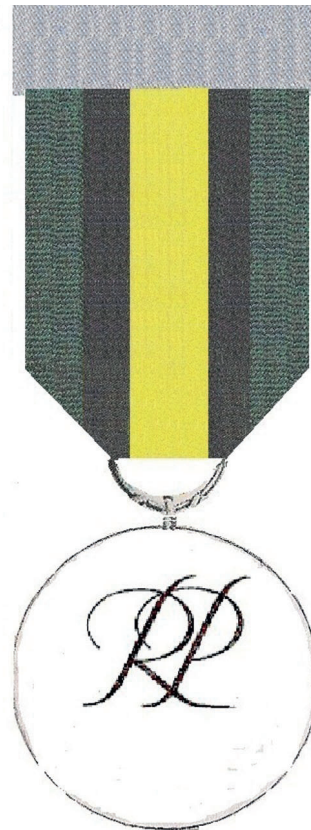
STRONA ODWROTNA Skala 1:1