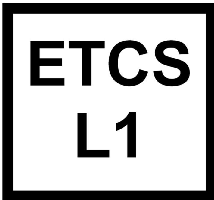
Rys. 204e Wskaźnik W ETCS 5