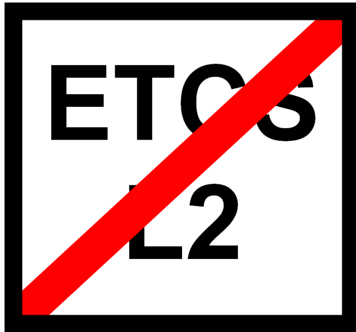
Rys. 204i Wskaźnik W ETCS 9