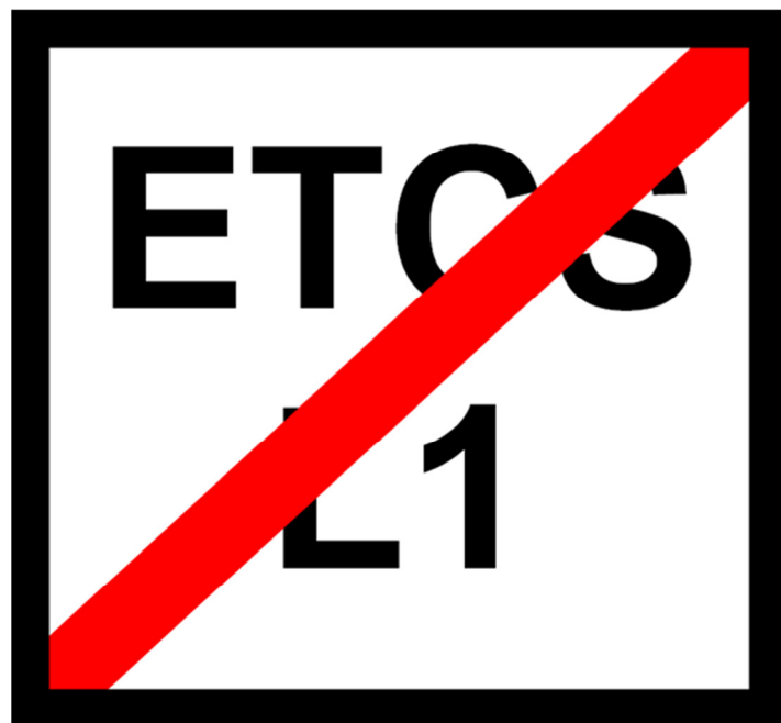
Rys. 204f Wskaźnik W ETCS 6