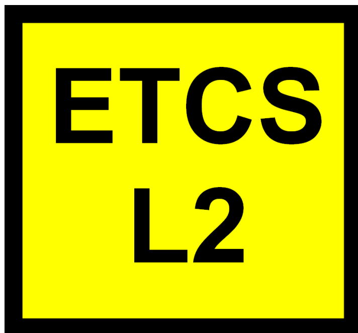
Rys. 204g Wskaźnik W ETCS 7