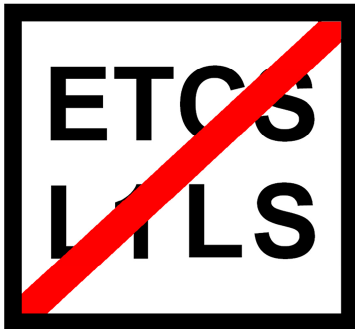
Rys. 204c Wskaźnik W ETCS 3