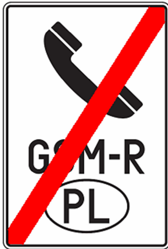
Rys. 198b Wskaźnik W 34

Załącznik do rozporządzenia Ministra Infrastruktury i Rozwoju z dnia 11 kwietnia 2014 r. (poz. 517)