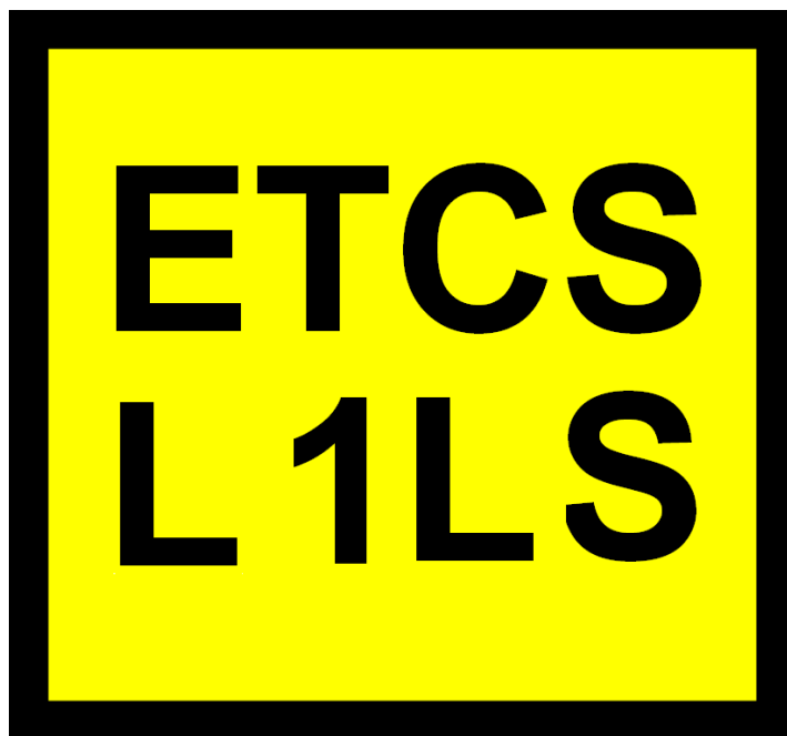
Rys. 204a Wskaźnik W ETCS 1