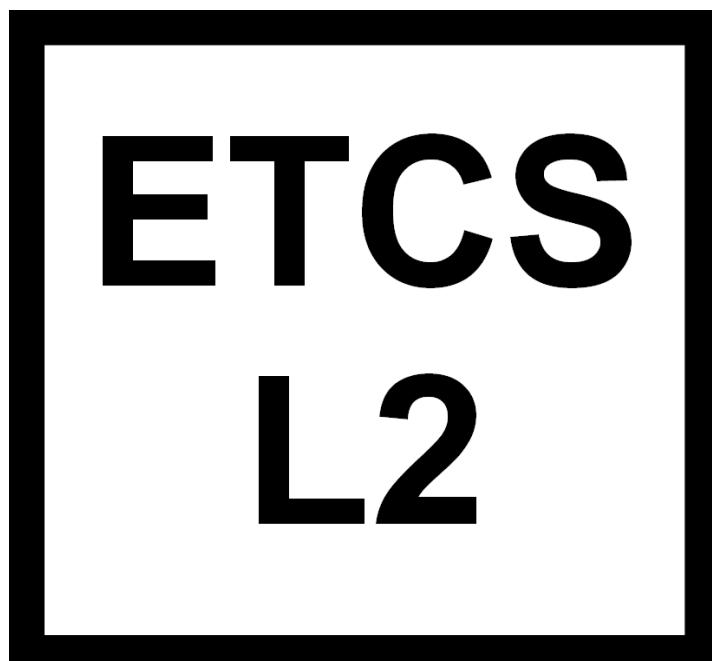
Rys. 204h Wskaźnik W ETCS 8