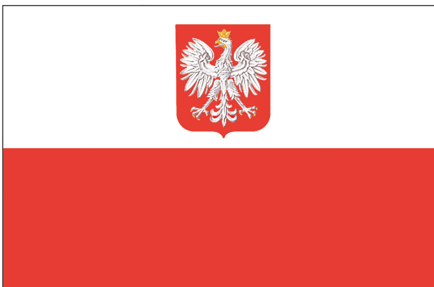
FLAGA PAŃSTWOWA RZECZYPOSPOLITEJ POLSKIEJ

Stosunek wysokości godła do szerokości flagi – wynosi 2:5