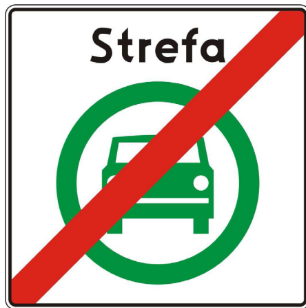
Rys. 5.2.60.1 Znak D-55

Znak D-55 „Koniec strefy czystego transportu” stosuje się w celu wskazania wyjazdu ze strefy czystego transportu. Znak ten umieszcza się na wszystkich wyjazdach ze strefy czystego transportu.”