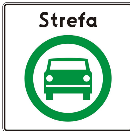
Rys. 5.2.59.1. Znak D-54

Znak D-54 „Strefa czystego transportu” stosuje się w celu wskazania granicy strefy czystego transportu. Znak ten umieszcza się na wszystkich wjazdach do strefy czystego transportu.