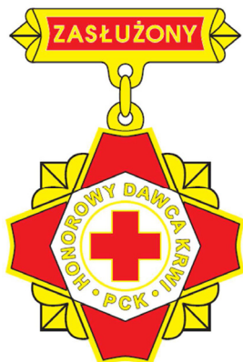
Brązowa odznaka honorowa „Zasłużony Honorowy Dawca Krwi III stopnia”