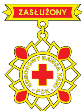
Srebrna odznaka honorowa „Zasłużony Honorowy Dawca Krwi II stopnia”