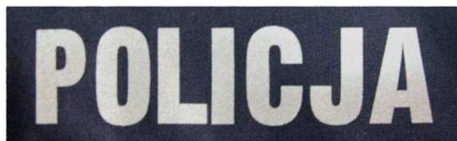
Znak do elementów ubioru służbowego i munduru ćwiczebnego