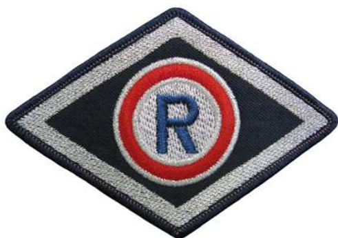
Służba prewencyjna (komórki organizacyjne ruchu drogowego)