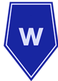
Służba spraw wewnętrznych