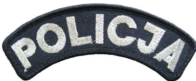
Znak do kurtki galowej i płaszcza wyjściowego całorocznego