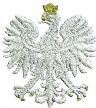
Znak generalnego inspektora i nadinspektora Policji