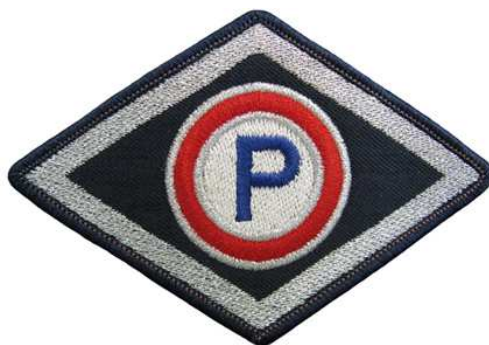
Służba prewencyjna (z wyłączeniem komórek organizacyjnych ruchu drogowego)