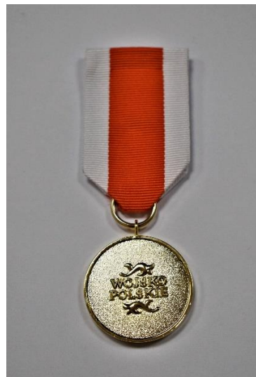
STRONA ODWROTNA MEDALU