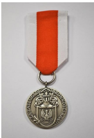
STRONA LICOWA MEDALU