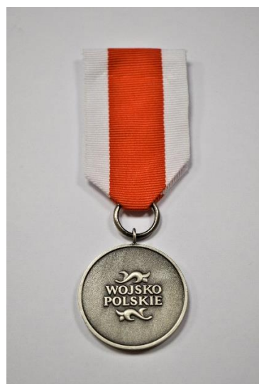
STRONA ODWROTNA MEDALU