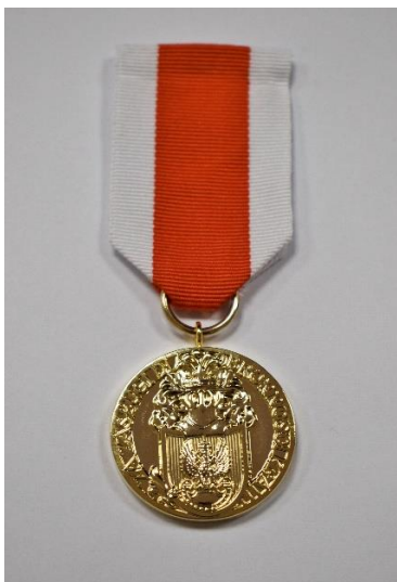
STRONA LICOWA MEDALU