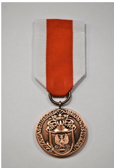
STRONA LICOWA MEDALU