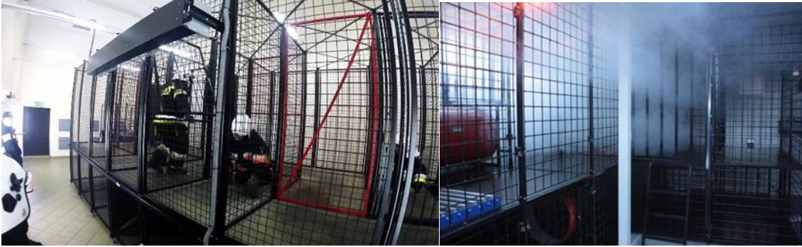
Zdjęcie nr 2. Komora rozgorzeniowo-dymowa.

Realizacja przedsięwzięcia uwzględnia poszerzenie Kanału Młyńskiego oraz budowę nabrzeży typu lekkiego od strony południowej i zachodniej oraz nabrzeży typu ciężkiego od strony wschodniej (wzdłuż Odry), przebudowę nabrzeży w rejonie planowanej platformy do ćwiczeń ratownictwa morskiego przy Kanale Młyńskim wraz z infrastrukturą towarzyszącą (oświetlenie, energia elektryczna, woda).