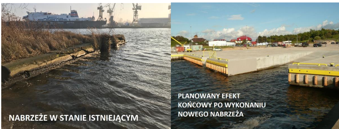
Zdjęcie nr 3. Nabrzeże Źródło Archiwum AMS.

Na działce nr 28/8 jest planowana budowa nabrzeża typu ciężkiego od strony Odry oraz przystosowanie jego konstrukcji w miejscu planowanej drugiej platformy szkoleniowej wraz z infrastrukturą towarzyszącą (oświetlenie, energia elektryczna, woda). Nabrzeże będzie przystosowane do cumowania statku szkolno-badawczego m/s „Nawigator XXI”, którego Akademia jest armatorem, statków SAR (np. Kapitan Poinc). Na nabrzeżu od strony północnej powstanie kompleks platform w konstrukcji stalowej ażurowej do szkolenia z zakresu ratownictwa morskiego.