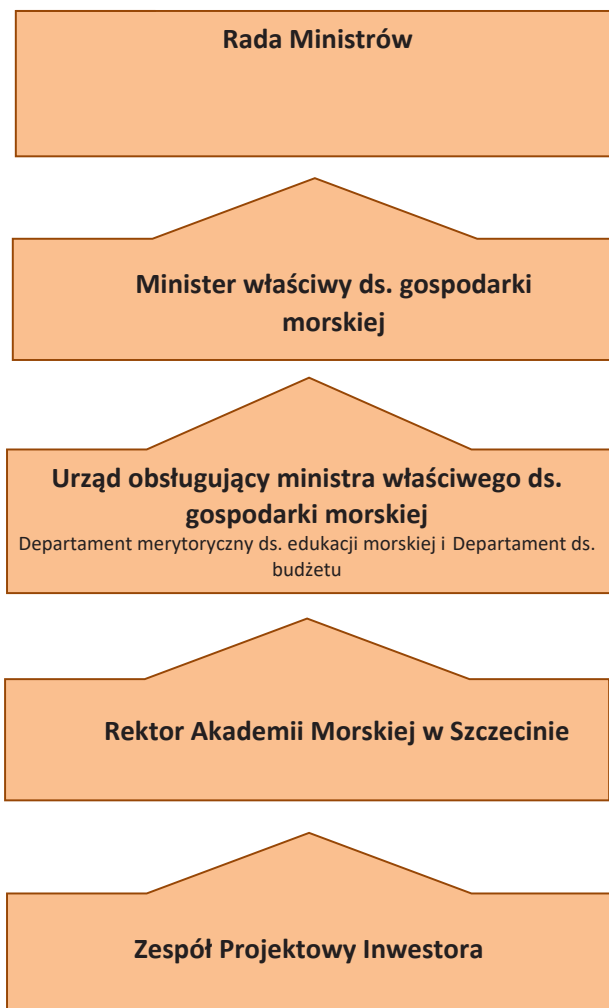
Rys. 3. Schemat przepływu informacji w systemie sprawozdawczości Programu.

Stała obecność na miejscu budowy realizowanych obiektów w ramach Programu przedstawiciela Zespołu Inwestora, sprawującego bezpośredni nadzór, będzie wspomagana wizytacjami na miejscu realizacji Programu przedstawiciela ministra, gdzie przede wszystkim będzie oceniany stan prac, tj. rzeczowa realizacja projektu. Minister będzie nadzorować realizację Programu przez weryfikację sprawozdań z jego realizacji przedstawianych przez AMS. Za przygotowanie, realizację i monitorowanie Programu będzie odpowiadać AMS przy wsparciu osób i podmiotów zewnętrznych, zatrudnianych bezpośrednio w związku z jego realizacją.