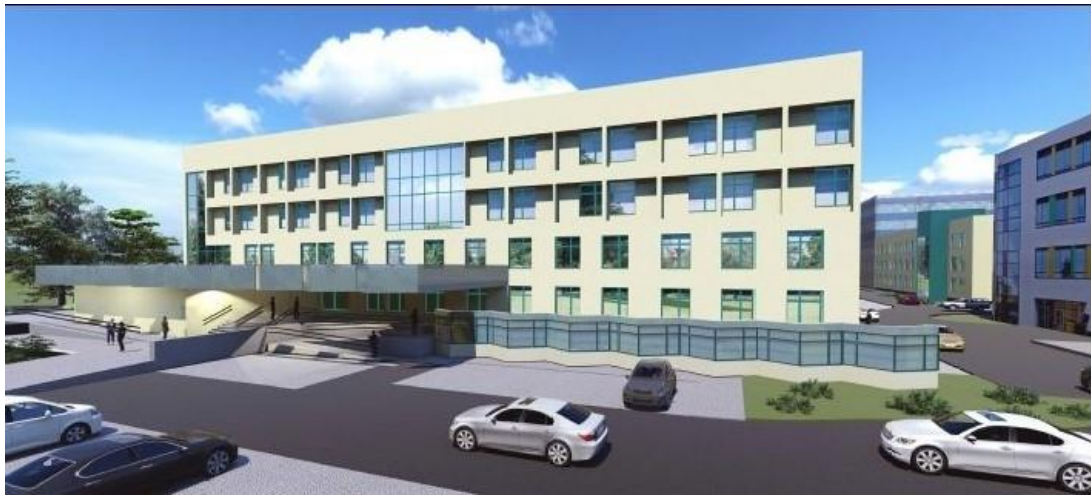
Widok od Parku Skowroniego – wejście główne