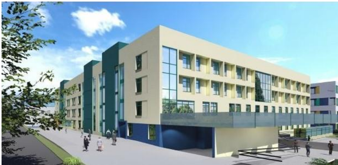
Widok – narożnik północno-zachodni