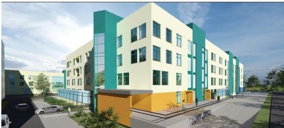
Rysunek 2 – Wizualizacja budynku ZCP.

Widok – narożnik wschodnio-północny obszar zakaźny z podjazdem dla karet