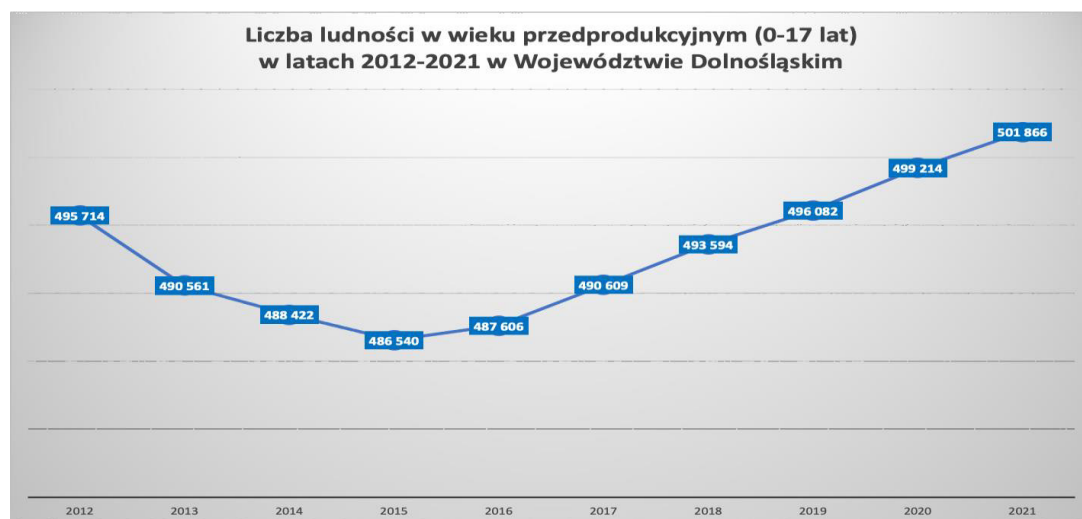
Wykres 1 – Liczba dzieci i młodzieży na Dolnym Śląsku w latach 2012–2021.