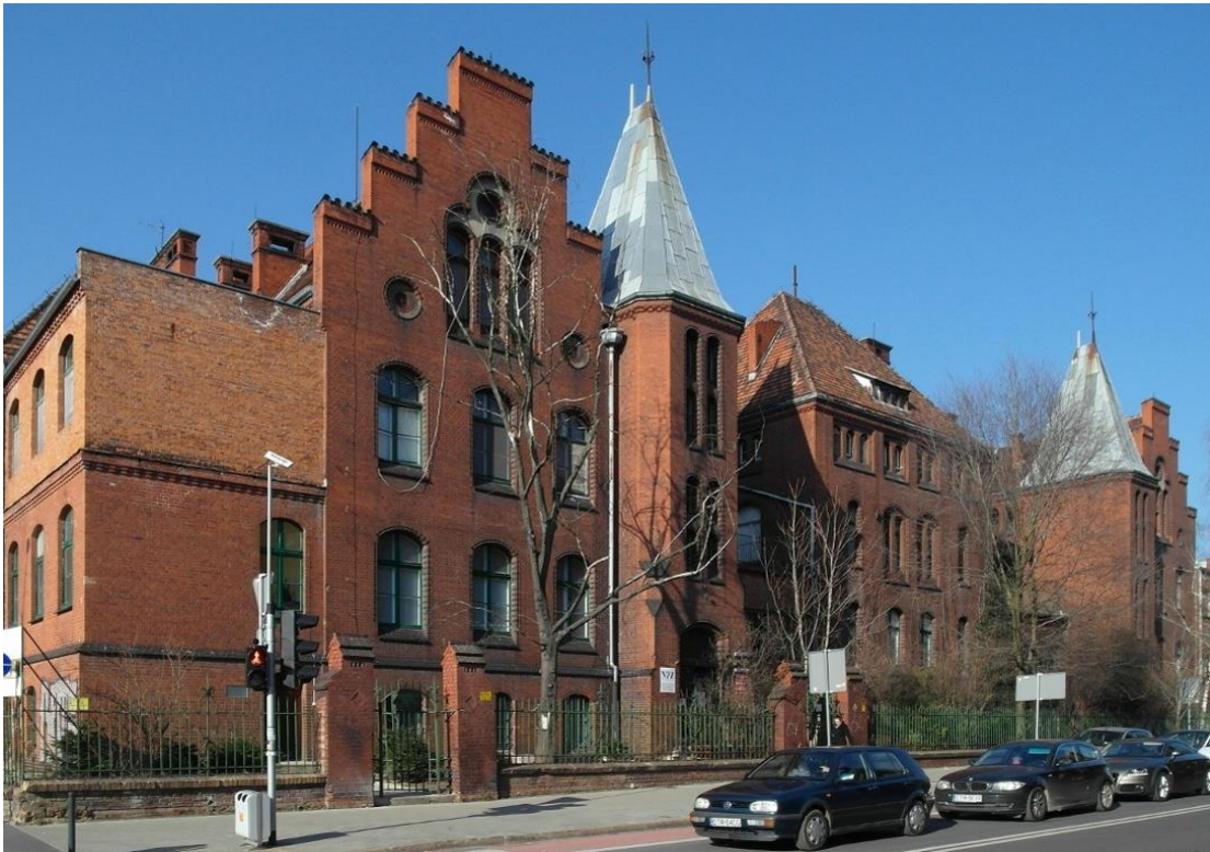
Zdjęcie 1 – Budynek przy ul. T. Chałubińskiego 2-2a.

Budynek przy ul. T. Chałubińskiego 2-2a, w którym obecnie znajduje się Klinika Pediatrii i Chorób Infekcyjnych, Klinika Endokrynologii i Diabetologii Wieku Rozwojowego oraz Klinika Pediatrii, Alergologii i Kardiologii.