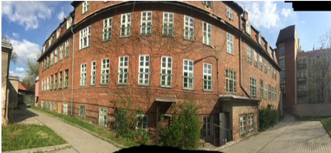
Budynek przy ul. M. Curie-Skłodowskiej 50-52, w którym funkcjonuje Klinika Pediatrii, Gastroenterologii i Żywienia.

Stan techniczny budynku przy ul. M. Curie-Skłodowskiej 50-52, określony między innymi na podstawie prowadzonych kontroli stanu technicznego, przedstawia się następująco: