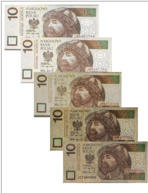
Wartość nominalna 10 zł