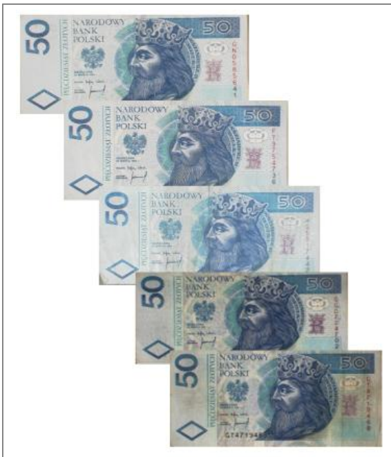
Wartość nominalna 50 zł