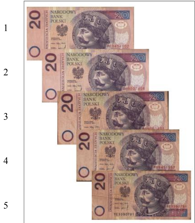
Wartość nominalna 20 zł