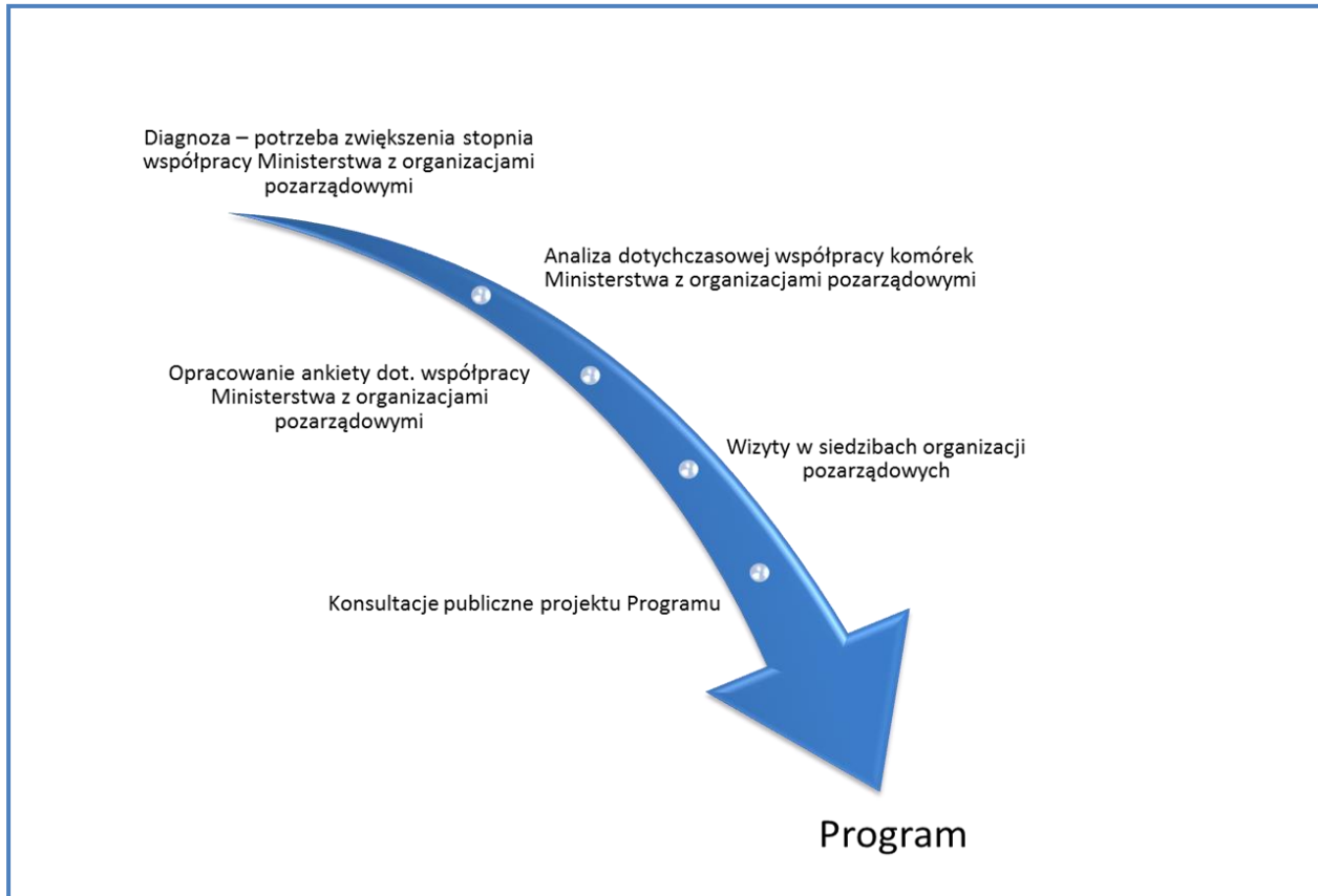
Rys. 3. Etapy tworzenia Programu.