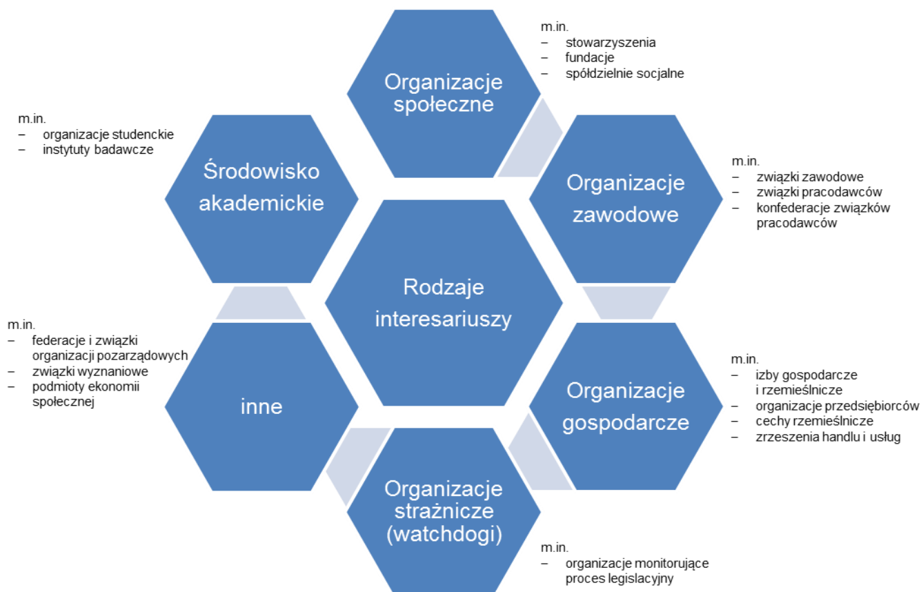
Rys. 1. Mapa Interesariuszy.

Zamieszczona poniżej mapa określa poszczególne grupy interesariuszy, dla których współpraca z Ministerstwem ma duże znaczenie z punktu widzenia realizowanych przez współpracujące strony zadań.