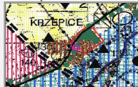
Wyrys ze studium uwarunkowań i kierunków zagospodarowania przestrzennego gminy Strzelina. Uchwała Rady Miejskiej Strzelina: nr XIV/174/2000 z dnia 2 lutego 2000 roku