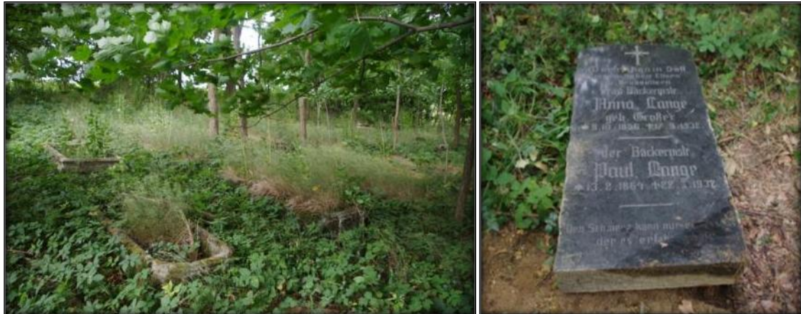
Cmentarz ewangelicki

Wokół kościoła, w obrębie murów, znajdował się cmentarz.