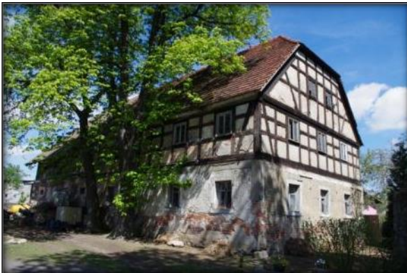
Dom mieszkalny, Siekierzyn, nr 5

Nieodłącznym elementem, decydującym o historycznej, niepowtarzalnej zabudowie wsi, są domy mieszkalne, w których zastosowano tzw. konstrukcję szkieletową. W tej technice elementy konstrukcyjne oddzielone są od wypełnienia wykonanego z mniej wytrzymałego materiału. W polach powstałych w wyniku skrzyżowania, zazwyczaj drewnianej konstrukcji ścian, stosowano różne wypełnienia, np. w postaci trzciny lub słomy zmieszanej z gliną. Wówczas powstawały domy w konstrukcji szachulcowej. Natomiast jeśli wypełnieniem była cegła - tę wersję nazywano murem pruskim. W praktyce, zwłaszcza w wypadku otynkowania ścian, nie można rozróżnić szachulca od pruskiego muru, często więc, zwłaszcza potocznie, używa się tych nazw zamiennie.