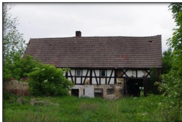
Dom mieszkalny, Rudzica, nr 89a

Kolejnym oryginalnym rozwiązaniem jest zastosowanie tzw. przysłupów – pionowych belek przylegających do ścian lub wolnostojących. Te elementy konstrukcyjne przejmowały ciężar z reguły dwuspadowego dachu pokrytego łupkiem, później dachówką. Powstałe wnęki zwieńczone belkami rozporowymi tzw. mieczami tworzyły rząd arkad, względnie arkadowe podcienia. Na terenie wielu wsi gminy Siekierzyn, m.in. Rudzicy, Siekierzyna, Zaręby - można napotkać domy mieszkalne prezentujące ww. elementy konstrukcyjne. Należą one jednak już do mniejszości. Historyczna zabudowa powoli zanika.