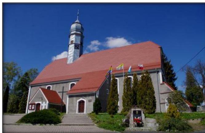
Kościół ewangelicki, ob. katolicki pw. Św. Antoniego z Padwy

Kościół w Siekierzynie należał do grupy świątyń biskupstwa miśnieńskiego istniejących już w 1346 roku. Wówczas, jako kościół parafialny, był podporządkowany dekanatowi lubańskiemu. W 1502 roku mieszczanie lubańscy wyposażyli świątynię w ołtarz. W 1541 roku wzniesiono budynki gospodarstwa kościelnego i przydzielono mu grunt orny. Sygnaturę wzniesiono w 1559 roku. W niej zawieszono pochodzące z XV wieku dzwony, które zostały podczas I wojny światowej przetopione. Nowe ufundowano w 1924 roku. Najprawdopodobniej kościół w 1686 roku był remontowany. Świadczy o tym napis wyryty w belce nad drzwiami wejściowymi; „AMM CSA MNO1686 CE”. W 1798 roku świątynia była rozbudowana.