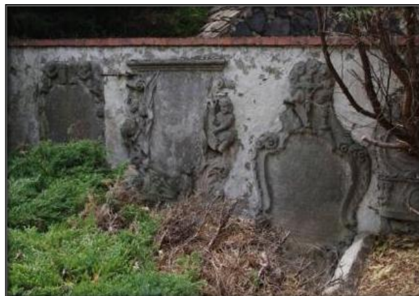
Epitafia w murze – cmentarz ewangelicki