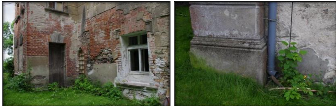
Założenie pałacowo-parkowe z folwarkiem w Zarebie przy ul. Bazaltowej 6