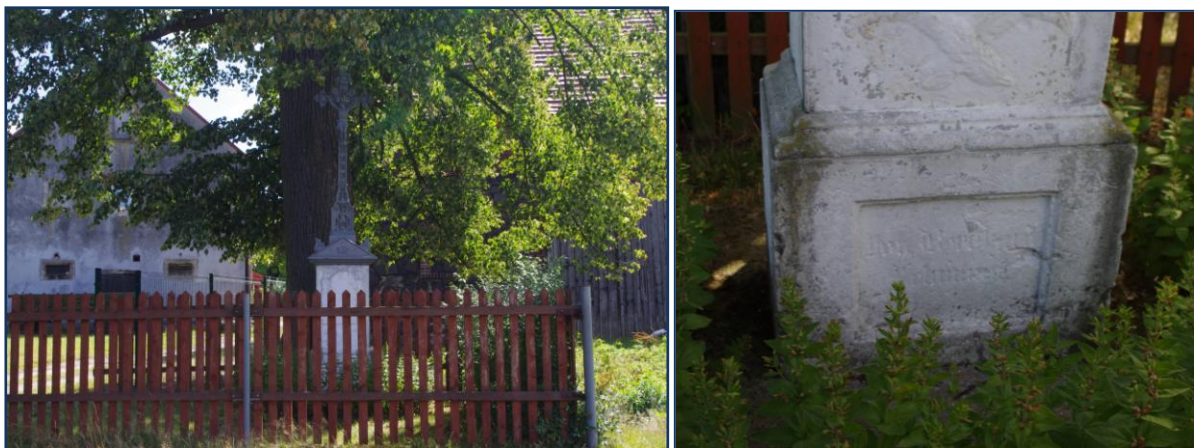
Krzyż przydrożny przy nr 123 w Rudzicy

W Rudzicy znajdował się kościół ewangelicki wzniesiony w 1855 roku, który w latach siedemdziesiątych XX wieku, decyzją władz komunistycznych gminy, został rozebrany i nie pozostał po nim żaden ślad. Swoich wiernych ewangelicy chowali na oddanym do użytku w 1872 roku cmentarzu położonym w odległości około pół kilometra od kościoła katolickiego. Cmentarz popadł w ruinę. Obecnie czytelny jest układ grobów oraz prowadząca aleja do nieistniejącej już kaplicy.