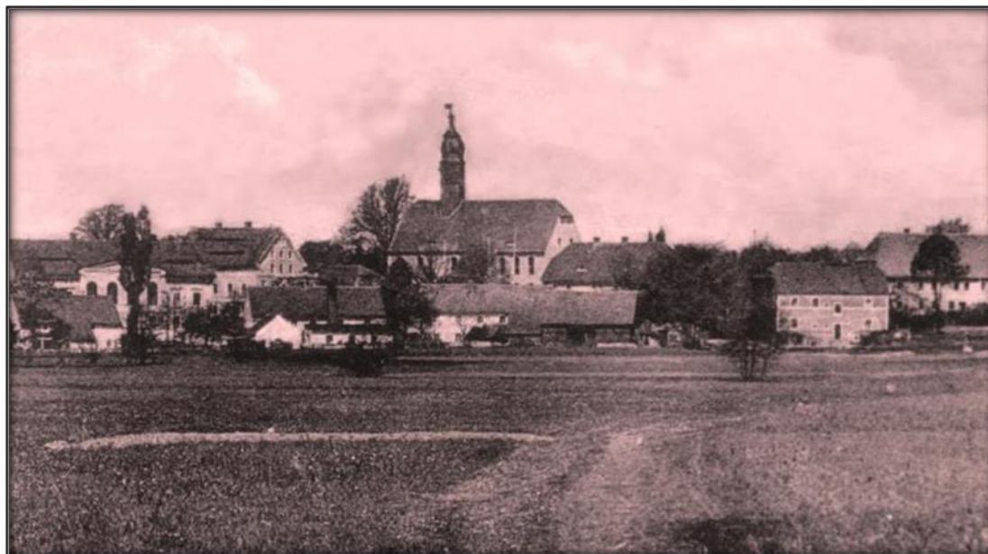
Siekierzyn i okolica na starej fotografii.

Niniejszy Program Opieki nad Zabytkami dla Gminy Siekierzyn na lata 2016-2019 jest dokumentem strategicznym, wyznaczającym priorytety i zadania w sferze bezpośrednio związanej z aktywną ochroną zabytków oraz w sferze dotyczącej turystyki kulturowej, edukacji i promocji dziedzictwa kulturowo- przyrodniczego.