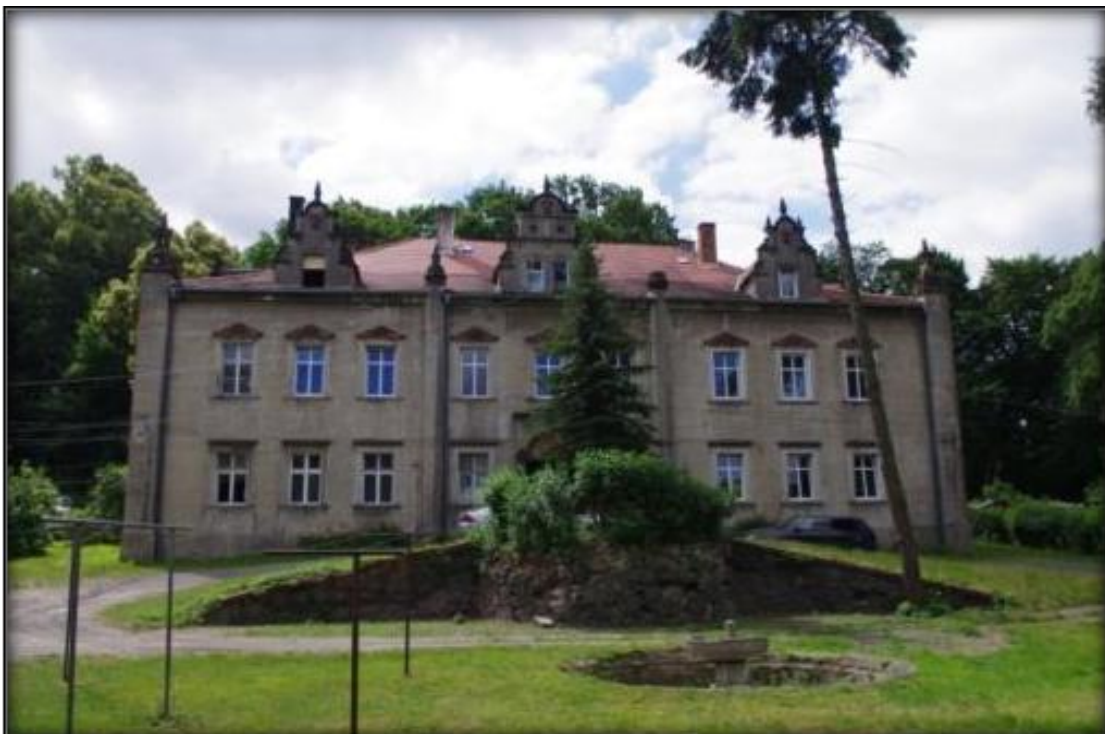
Pałac w Zarębie Dolnej