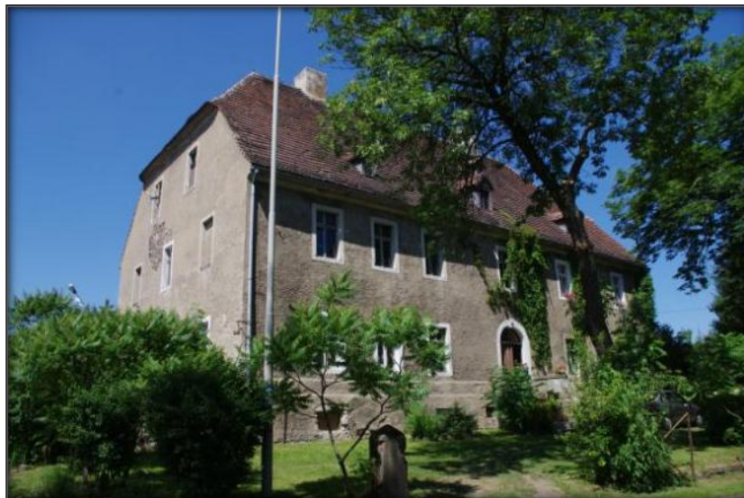
Dwór w Wyrębie