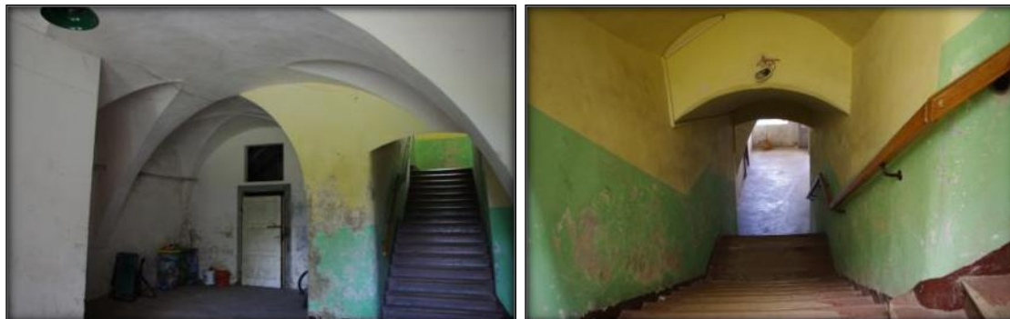
Założenie pałacowo-parkowe z folwarkiem w Zarebie

pleśni i grzybów, zarówno po stronie elewacji zewnętrznej jak i w mieszkaniach. Ściany zewnętrzne ze względu na podciąg wilgoci ulegają ciągłej degradacji.