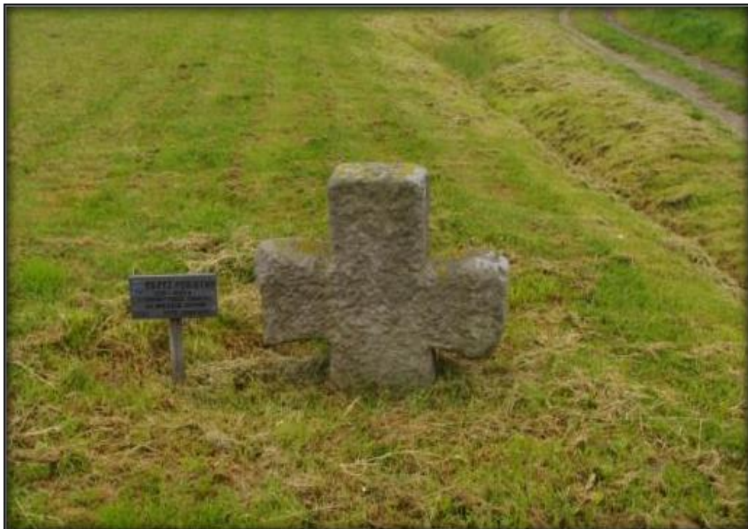
Krzyż pokutny przy nr 127 w Rudzicy

Krzyże kute są pełne na całej powierzchni lub ażurowe. Końce ramion krzyży kutych przybierają m.in. formę liści, serca, lilii, trójliści, półksiężyców, małych krzyży oraz gałek. Natomiast ramiona krzyży ażurowych przyjmują najczęściej formę trójliści. Krzyże żeliwne są szersze od kutych, na końcach ramion mają gałki, a ich powierzchnię zdobią ażurowe ornamenty. Zarówno krzyże kowalskie, jak i żeliwne osadzone są na kamiennym lub betonowych cokole wbitym w ziemię lub zalane w ziemi betonem. Na cokołach występowały inskrypcje. Jednakże w wyniku wielokrotnego malowania cokołu farbą, inskrypcje zawierające m.in. datowanie, z czasem stały się nieczytelne. Po II wojnie światowej część napisów na cokołach została zniszczona. Prawdopodobnie najstarszy z krzyży przydrożnych w Rudzicy pochodzi z 1762 roku. Obecnie na terenie Rudzicy znajduje się 8 krzyży przydrożnych, 2 kapliczki, 2 figurki na cokołach, 1 cokół na którym stał krzyż przydrożny oraz 3 nowe współczesne obiekty.