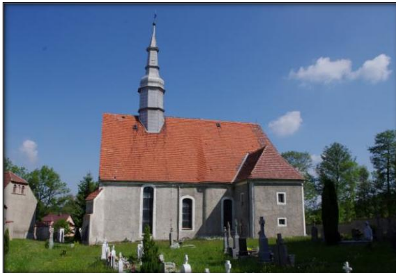
Kościół rzymsko-katolicki pw. Św. Katarzyny Aleksandryjskiej