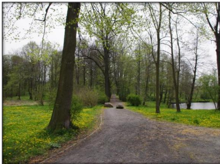
Park w Zarębie Górnej

Jednym z najcenniejszych założeń zieleni jest postromantyczny park w Zarębie Górnej o powierzchni 11,8 ha. Założony został w latach 30-tych XIX wieku, wokół neogotyckiego pałacu. Z pierwotnego układu zachowały się pojedyncze drzewa, aleja lipowa od strony południowo-zachodniej oraz stawy – element dawnego układu wodnego.