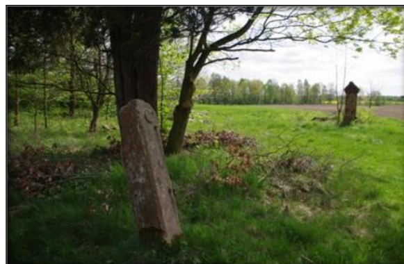
Cmentarz urnowy

We wschodniej części Siekierzyna niedaleko od drogi do Sulikowa znajdował się cmentarz urnowy (niem. „Urnenfriedhof”) nazwany również popielnicowym gajem (niem. Urnenhain) gdzie dokonywano ciałopalnych pochówków urnowych 18 . Najprawdopodobniej grzebano tam bezwyznaniowców. Nazywano ich „freidenkerami” – wolnomyślicielami. Istnieje również przypuszczenie, że chowano tam ofiary zarazy. Obecnie cmentarz nie istnieje. Pozostały tylko słupy, należące do ogrodzenia i bramy. Teren porośnięty jest zielenią.