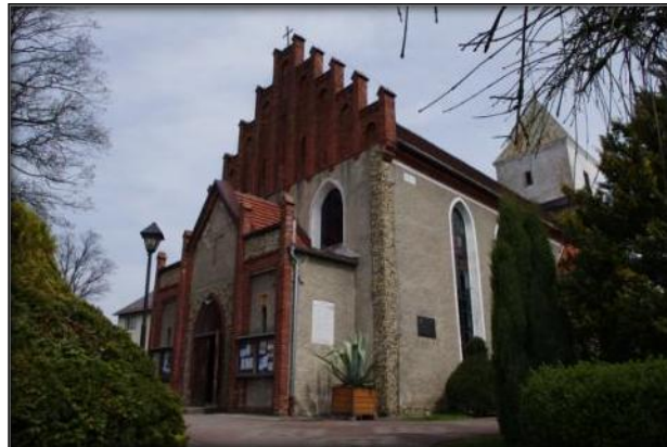
Kościół parafialny pw. Wniebowzięcia NMP