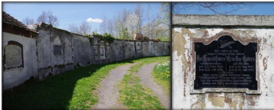
Cmentarz przykościelny

Kościół otoczony jest dziewiętnastowiecznym murem i ma charakter budowli kastelowanej. Wraz ze stojącą dawną pastorówką i dawną szkołą przykościelną tworzy zespół kościelny, usytuowany w centrum wsi. Obok wejścia do kościoła, na ścianie po prawej stronie - znajduje się tablica upamiętniająca zmarłych mieszkańców Geibsdorfu i Siekierzyna.