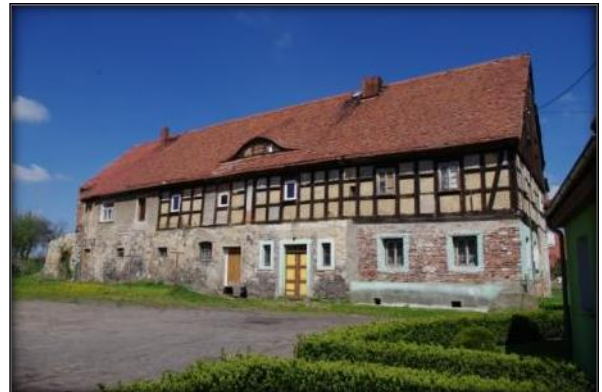
Dom mieszkalny, Siekierzyn, nr 85

Kolejnym oryginalnym rozwiązaniem jest zastosowanie tzw. przysłupów – pionowych belek przylegających do ścian lub wolnostojących. Te elementy konstrukcyjne przejmowały ciężar z reguły dwuspadowego dachu pokrytego łupkiem, później dachówką. Powstałe wnęki zwieńczone belkami rozporowymi tzw. mieczami tworzyły rząd arkad, względnie arkadowe podcienia. Na terenie wielu wsi gminy Siekierzyn, m.in. Rudzicy, Siekierzyna, Zaręby - można napotkać domy mieszkalne prezentujące ww. elementy konstrukcyjne. Należą one jednak już do mniejszości. Historyczna zabudowa powoli zanika.