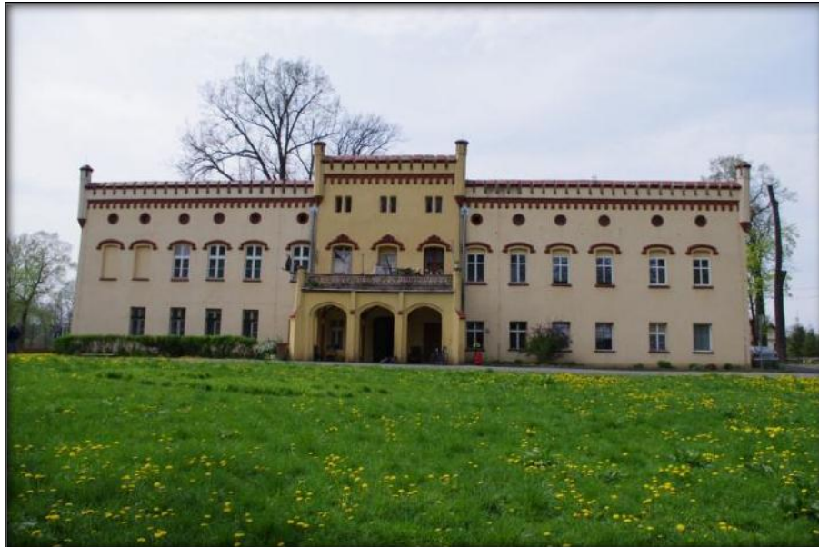
Pałac w Zarębie Górnej

Pałac wraz z zabudowaniami folwarcznymi usytuowany jest na terenie dawnego zespołu dworskiego. Został wybudowany w XVI wieku, najpóźniej w latach 20 XVII wieku. W 1673 roku strawił go pożar. Co ciekawe, w tym samym dniu spłonął pałac w Zarębie Dolnej. Został odbudowany w połowie XIX wieku w stylu neogotyckim. Pałac osadzony jest na planie wydłużonego prostokąta. Bryła budynku jest zwarta i regularna. Dwukondygnacyjną budowlę okrywa płaski dwuspadowy dach zakryty krenelażem. Elewacja frontowa podzielona jest na piętnaście osi oraz zrytmizowana jest ciągiem okien na każdej z kondygnacji. W części środkowej umieszczony jest pseudoryzalit, nieco wyższy od korpusu, zwieńczony krenelażem. Uwagę zwraca umieszczony w pseudoryzalicie jednokondygnacyjny portyk, którego trzy filarowe arkady dźwigają zwieńczenie w formie tarasu, ograniczonego balustradą balkonową, z motywem przenikających się kół i stylizowanych liści winorośli. Poniżej tarasu znajduje się główne wejście do budynku, ujęte profilowanym obramieniem i zakończone łukiem tzw. tudorowskim. Naroża korpusu oraz ryzalitu zwieńczają wąskie sterczyny. Urozmaiceniem elewacji frontowej są kształty okien - oprócz prostokątnych, każdej osi jest przyporządkowany okrągły otwór okienny, tzw. okulus, wpisany w koło maswerkowych 5-liści. Natomiast okna drugiej kondygnacji zdobione są motywami roślinnymi na nadokienniku. We wnętrzu budynku zachowała się parterowa sala neobarokowa oraz stiukowa dekoracja sufitu.