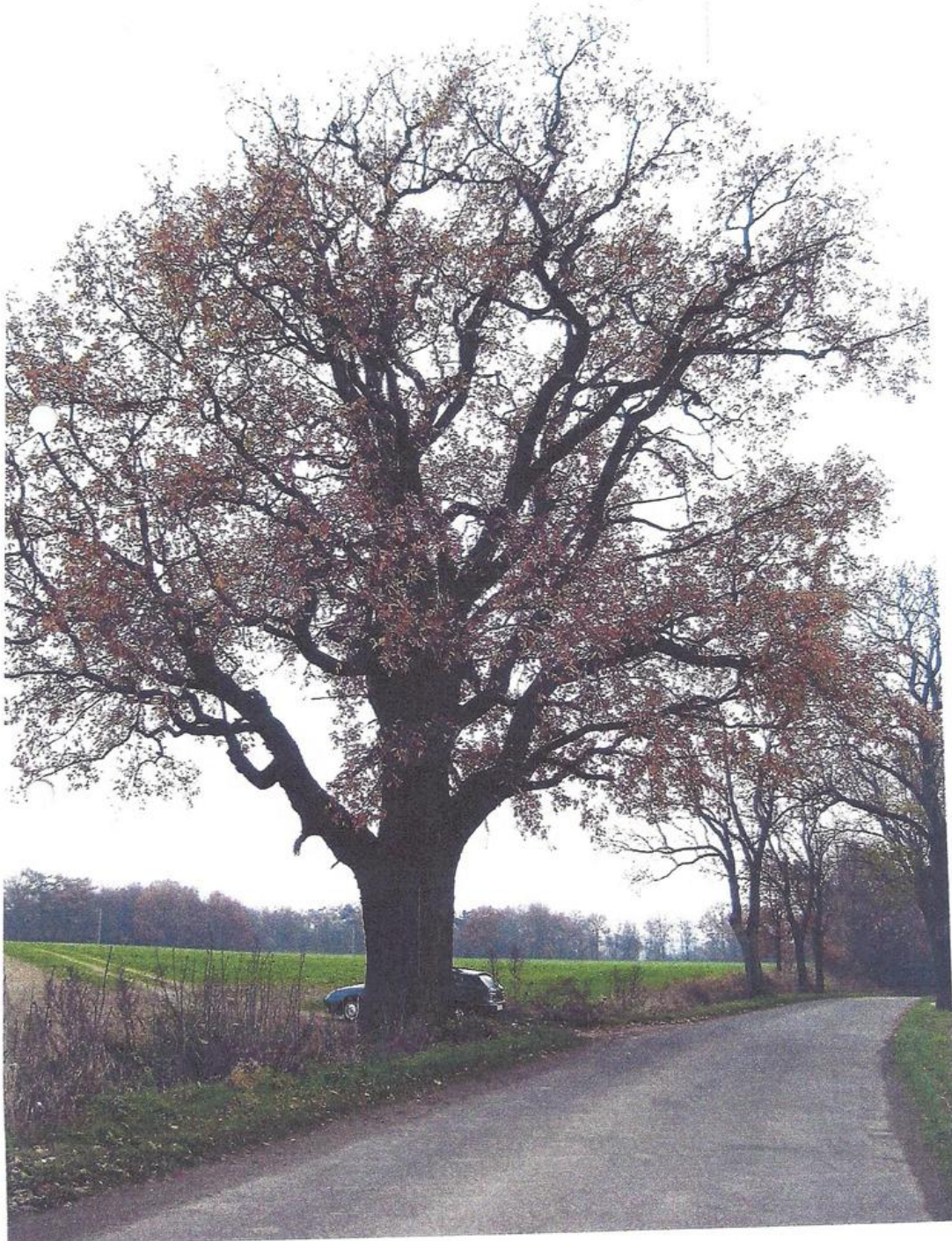
Dąb szypułkowy - pokrój

Załącznik Nr 3 do Uchwały Nr III/23/2015 Rady Gminy Złotoryja z dnia 30 stycznia 2015 r.