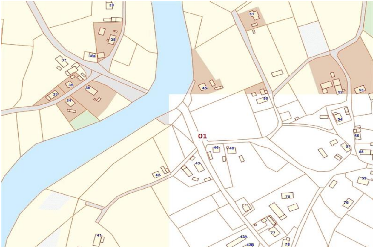
Lokalizacja przystanku w miejscowości Przejęsław