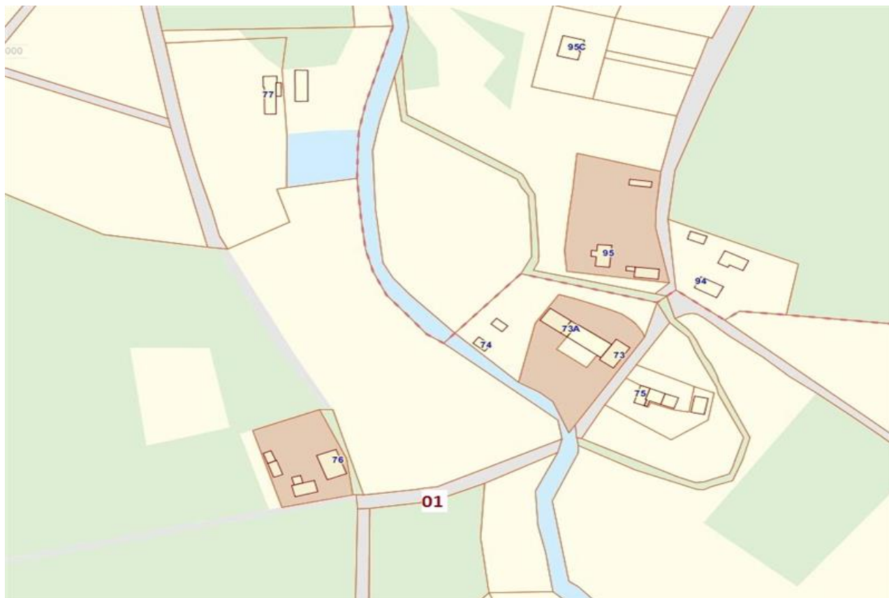
Lokalizacja przystanku w miejscowości Ołobok