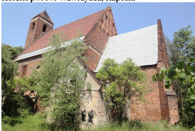
Zdjęcie nr 6. Kościół pw. św. Wawrzyńca, Rapocin

Kościół w Rapocinie to najcenniejszy zabytek gminy. Wzmiankowany w 1297 r., obecny pochodzi z przełomu XIV/XV w. Orientowany budynek jednonawowy z wieżą od zach., z prostokątnym prezbiterium, do którego przylega od póln. zakrystia (1896 r.), od póln. - kaplica, a do nawy kruchta wejściowa. Prezbiterium i zakrystia nakryte sklepieniami kolebkowymi, nawa - stropem. Ambona i ołtarze (1901 r.) - rzeźbiarz głogowski Jäkel, organy - firma Schlag i synowie. Kościół był wielokrotnie remontowany i odnawiany: 1791 r., 1849 r. W czasie II wojny spalony, został odbudowany w latach 1967 - 1968 i działał do 1988 r. Po wysiedleniu wsi Rapocin, kościół został zabezpieczony, a otwory zamurowane. Z czasem zabezpieczenia zostały usunięte, dach został częściowo rozebrany, co prowadzi do dewastacji świątyni. Obiekt popada w całkowitą ruinę, zachowały się gotyckie okna, portale i blendy w prezbiterium.