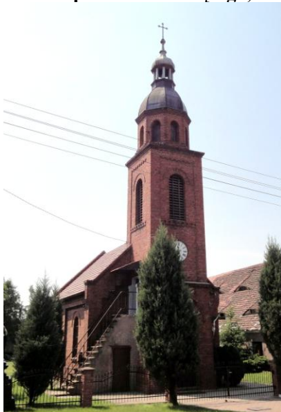
Zdjęcie nr 9. Kościół pw. Ducha Świętego, Grodziec Mały

Kościół ewangelicki, wzniesiony w 1900 r. Do lat 80-tych XX w. należał do parafii w Rapocinie, obecnie filialny parafii Wniebowzięcia NMP w Głogowie. Murowany z cegły, salowy, nakryty dwuspadowym dachem, z węższym i niższym prezbiterium - od płn. - wsch. i zakrystią przylegającą do prezbiterium od wsch. oraz z kwadratową wieżą wieńczącą kruchtę w fasadzie, dostępna po