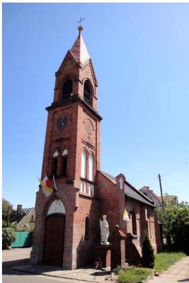
Zdjęcie nr 11. Kościół filialny pw. Narodzenia NMP, Szczyglice