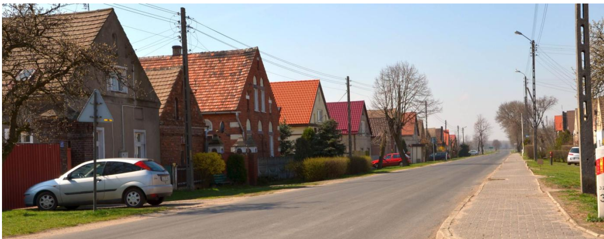
Zdjęcie nr 1. Zwarta zabudowa wsi Grodziec Mały

Układ osadniczy gminy charakteryzuje się zwartością zabudowy, historycznie wykształconą strukturą osiedleńczą z miejscowościami o randze ośrodków dominujących i silnym powiązaniem z miastem Głogowem. W oddziaływaniu osadniczym miasta znajdują się wsie: Ruszowice oraz Serby. Droga krajowa nr 12 wpływa na miejscowości: Serby, Serby Stare, Wilków i Ruszowice. W tych ośrodkach najsilniej występują tendencje do rozwoju osadnictwa.