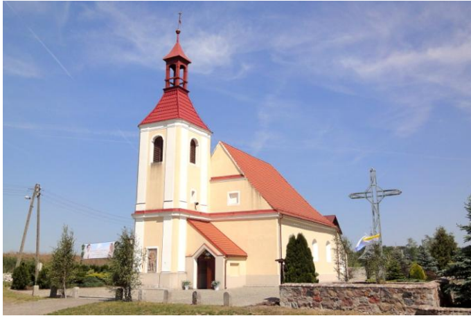
Zdjęcie nr 10. Kościół pw. św. Jana Nepomucena, Wilków

Kościół wzmiankowany w 1357 r. Początkowo pw. Wszystkich Świętych, w latach 1524 - 1654 zajęty przez protestantów. Był wielokrotnie niszczony, m.in. przez Szwedów w 1632 r., w 1759 r. przez Kozaków. W 1769 r. odbudowany dzięki fundacji pułkownika Ludwika Ferdynanda Lichnowskiego, ze zmianą wezwania. W prezbiterium zachowała się drewniana figura św. Jana Nepomucena, w kościele - dwa całopostaciowe epitafia.