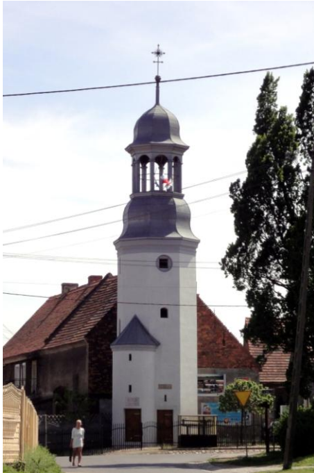
Zdjęcie nr 12. Kaplica - dzwonnica, Przedmoście