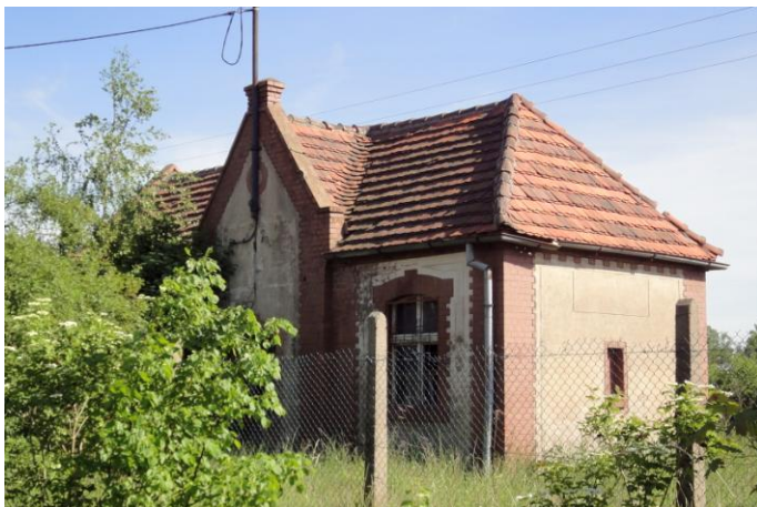
Zdjęcie nr 15. Stacja kolejowa Serby-Zachód, ob. budynek nieużytkowany, Serby