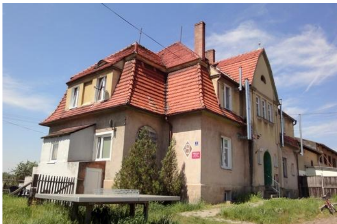
Zdjęcie nr 5. Dworek w Starych Serbach nr 9

Dworek w Starych Serbach nr 9 , tzw. dworek Pauli; wzniesiony wg proj. Karla Erbsta ze Szczecina, ob. świetlica wiejska, data powstania: XIX/XX w.