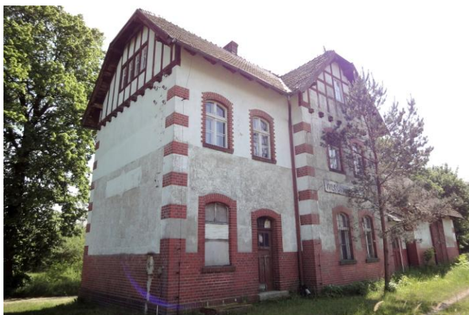
Zdjęcie nr 14. Dawny dworzec, ob. bud. mieszkalny, Wilków