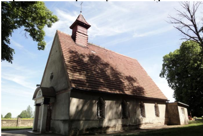
Zdjęcie nr 13. Kaplica cmentarna pw. Chrystusa Króla, Przedmoście