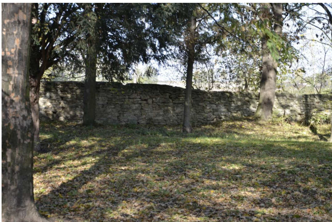
Fot. Dobrogoszcz – Ogrodzenie zespołu.