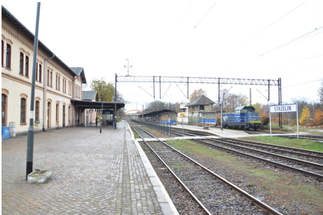
Fot. Strzelin – Dworzec - osłony zejść podziemnych