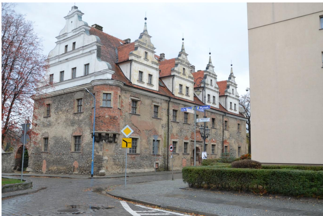
Fot. Strzelin – Dom Książąt Brzeskich