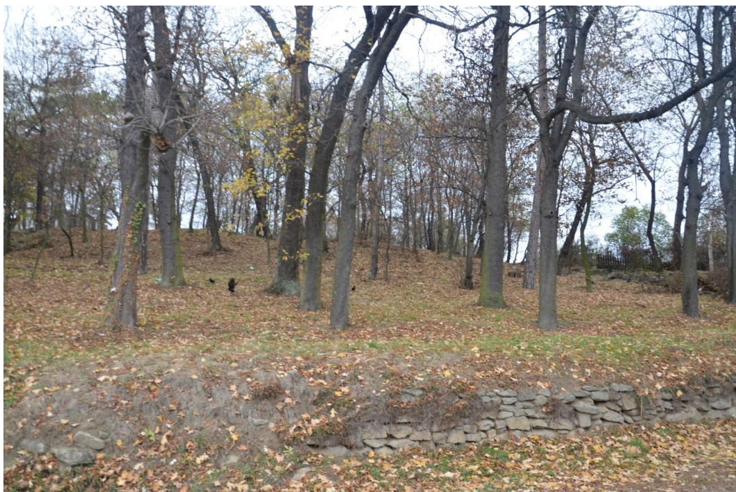
Fot. Strzelin – Park miejski, Wzgórze parkowe