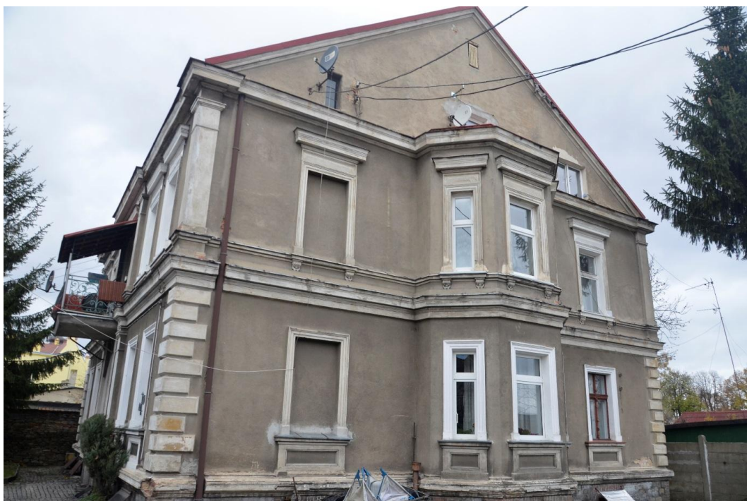
Fot. Strzelin – Dom mieszkalny ul. Brzegowa 10