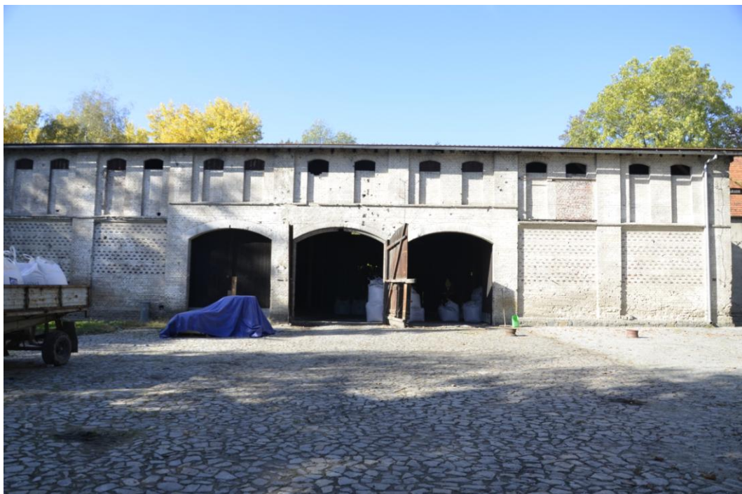
Fot. Dobrogoszcz – Stajnia.