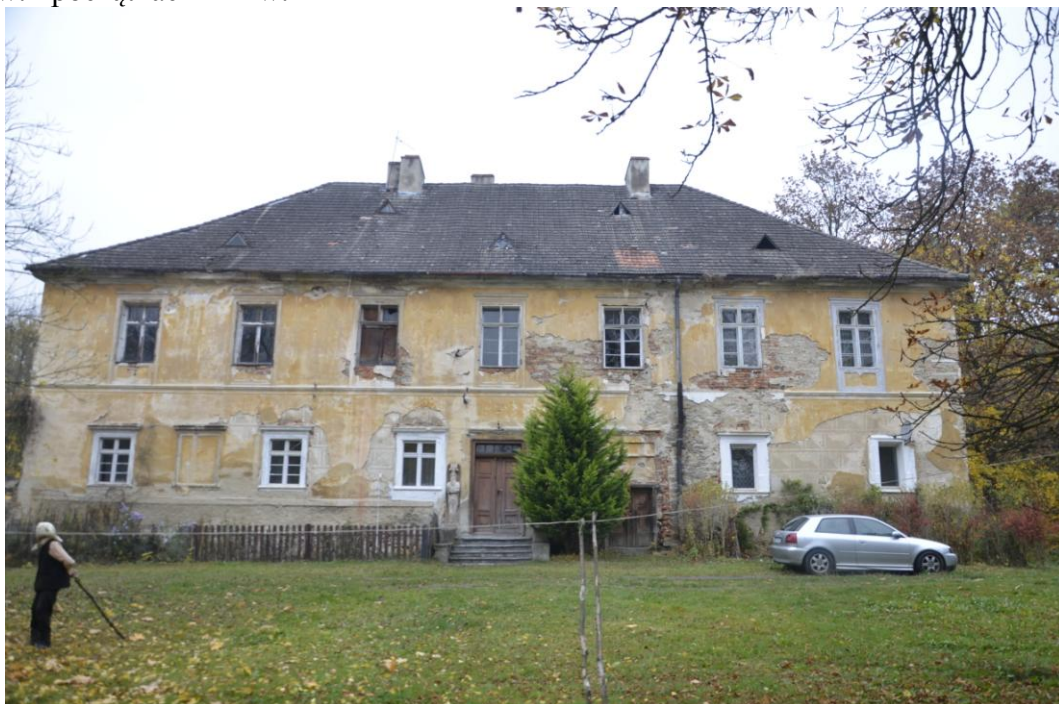
Fot. Gębczyce - Pałac

Przylegający do pałacu od strony zachodniej dziewiętnastowieczny park krajobrazowy zdominowany jest przez drzewostan liściasty, między innymi: dęby, kasztanowce, lipy. Przed frontem pałacu otwiera się dziedziniec gospodarczy, wokół którego znajdują się ruiny budynków folwarku (stodoły, stajnie, obora, spichlerzu), wzniesionych z kamienia i cegły w XIX w. i początkach XX w.