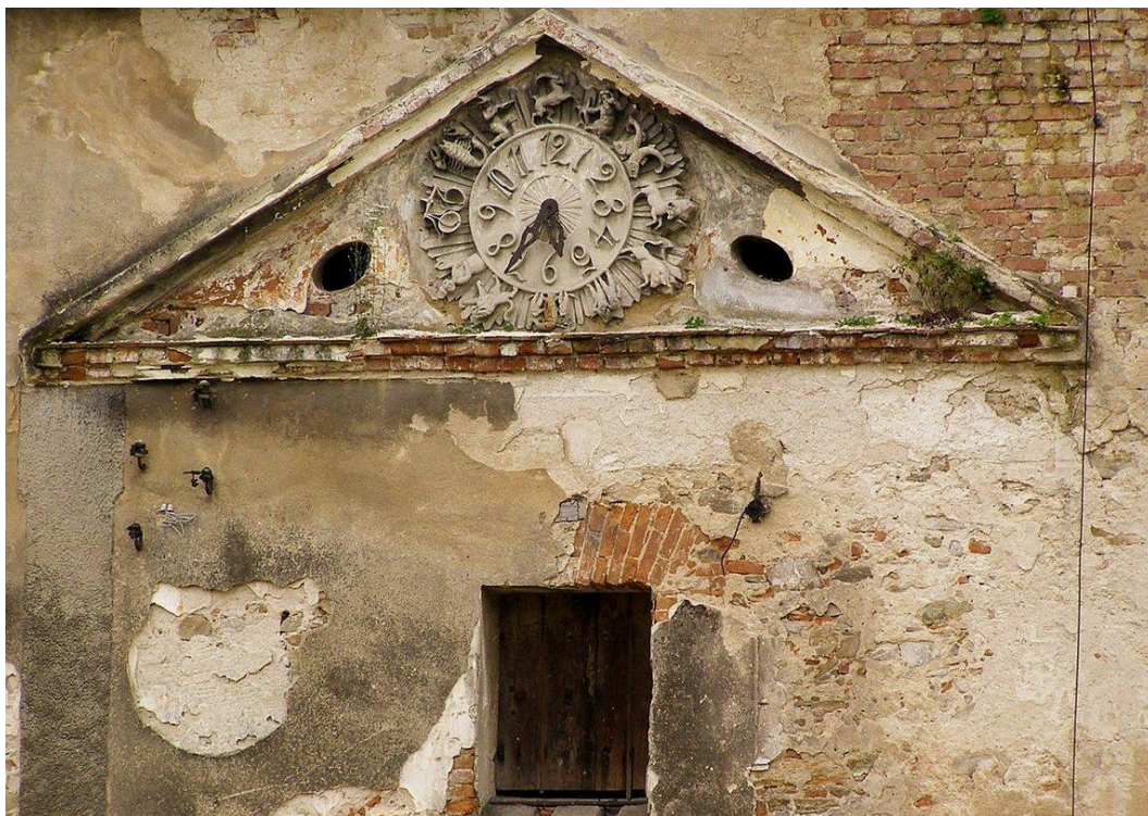
Fot. Żeleźnik – Spichlerz