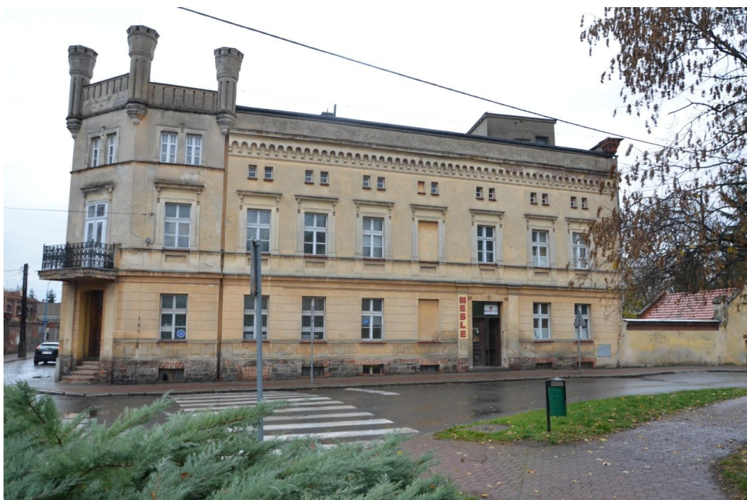
Fot. Strzelin – Zespół młyna