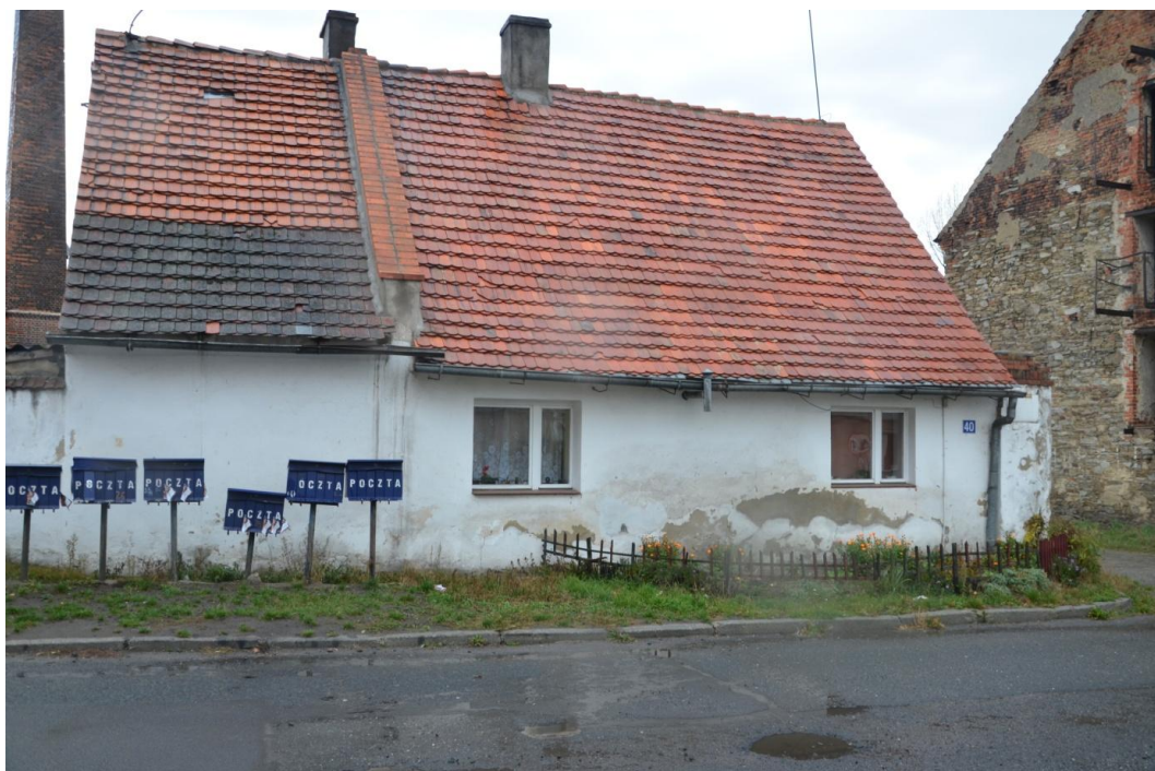
Fot. Muchowiec – Oficyna mieszkalna I nr 40