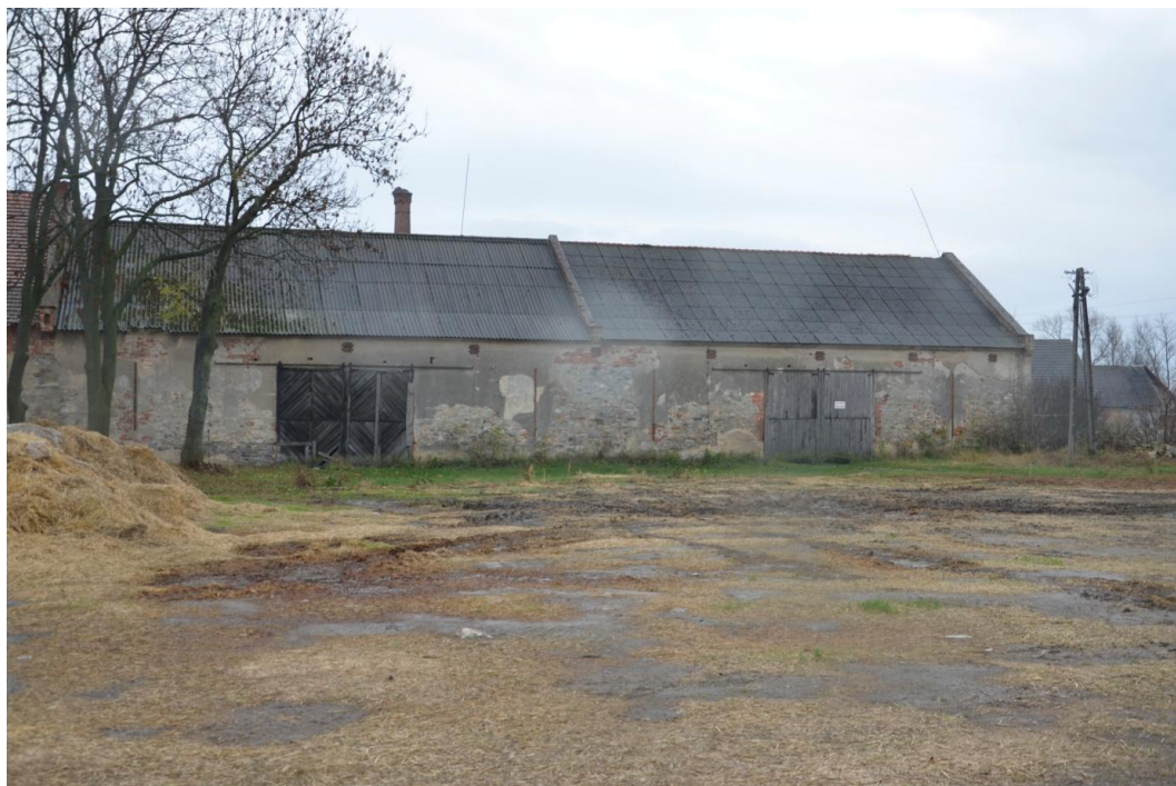
Fot. Muchowiec – Stodoła I i II