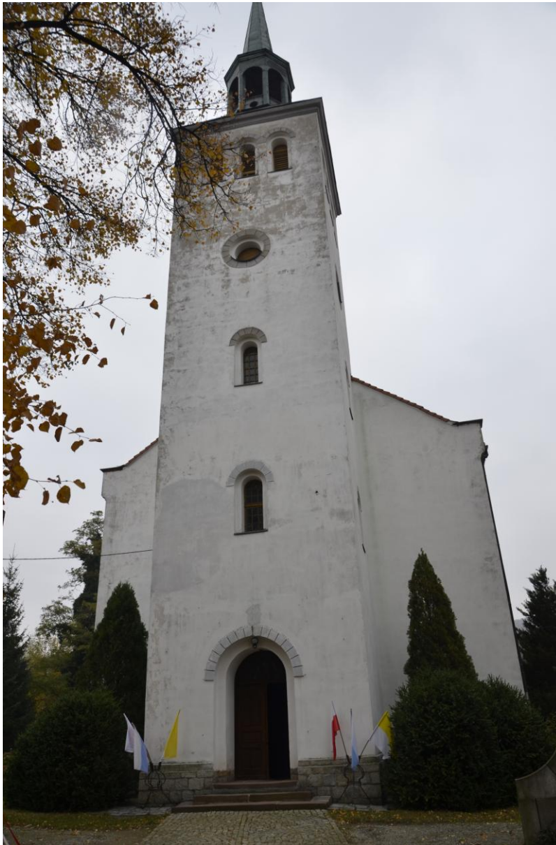
Fot. Nowolesie - Kościół parafialny p.w. Św. Marcina

założonymi na planie prostokąta aneksami, w których znajdują się zakrystia i pomieszczenia o charakterze pomocniczym. Korpus nawowy, salowy, założony na rzucie prostokąta, w jego zachodniej części znajduje się chór. Od zachodu na osi nawy wyodrębniona jest w rzucie wieża o planie czworobocznym. Kościół orientowany, jednonawowy, z wyodrębnionym niższym od wydłużonej nawy, prezbiterium i czworoboczną pięciokondygnacyjną wieżą. Po obu stronach prezbiterium znajdują się niższe od niego prostopadłościennne aneksy mieszczące zakrystie i pomieszczenie pomocnicze. Korpus nawowy został nakryty dachem dwuspadowym, natomiast dachy aneksów są dwupołaciowe, wieża nakryta jest dachem czterospadowym, dzwonnica wieży w kształcie ostrosłupa. Pokrycie dachowe nawy, prezbiterium i aneksów wykonane jest z dachówki ceramicznej. Dzwonnica wieży pokryta blachą. W kościele większość posadzki wykonana została z płytek ceramicznych, natomiast w wieży znajduje się podłoga drewniana.