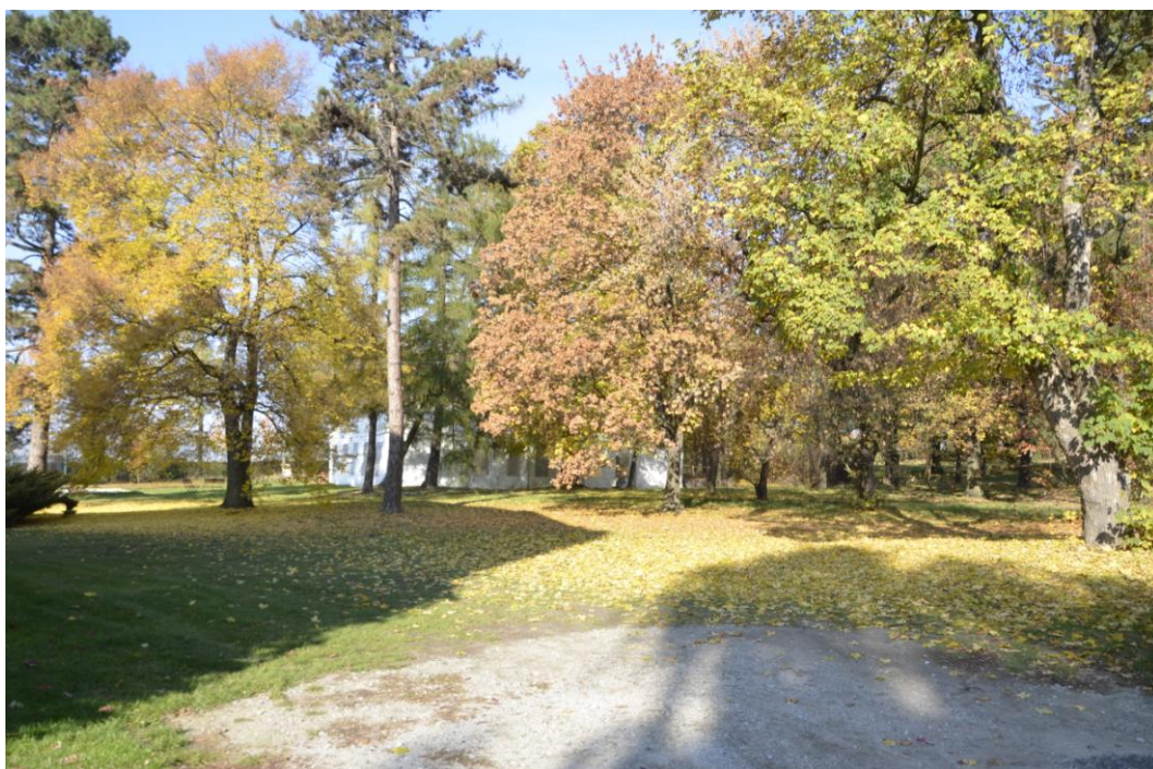
Fot. Krzepice - park