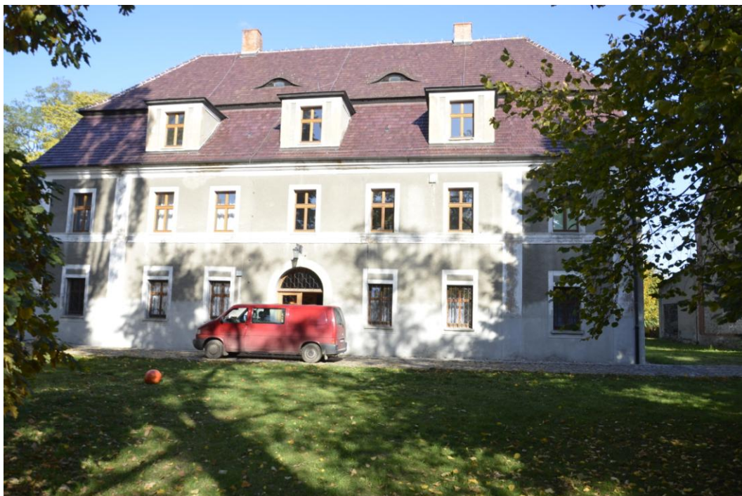
Fot. Dobrogoszcz – Pałac.

Oficyna mieszkalna wybudowana została około 1910 r., stanowi północną część wschodniego skrzydła zespołu. Dopelnienie tego skrzydła stanowi znajdująca się od południa była stajnia. Po wschodniej stronie oficyny znajduje się skromny skwerek. Budynek jest murowany, fundamenty i cokół wykonane z kamienia, natomiast wyższe części ceglane. Stropy budynku nad parterem są ceglane, nad piętrami drewniane. Więźba dachowa drewniana, pokrycie dachu wykonane jest z podwójnej dachówki karpiówki. Dach dwuspadowy, poddasze w części użytkowe, w połaciach dachu znajdują się facjatki. Posadzki parteru w holu i klatce schodowej wykonane są z lastriko, w piwnicach z cegieł, natomiast pozostałe drewniane. Otwory drzwiowe i okienne prostokątne. Budynek założony jest na planie prostokąta, trzytraktowy, bryła budynku zwarta, podpiwniczona i dwukondygnacyjna.