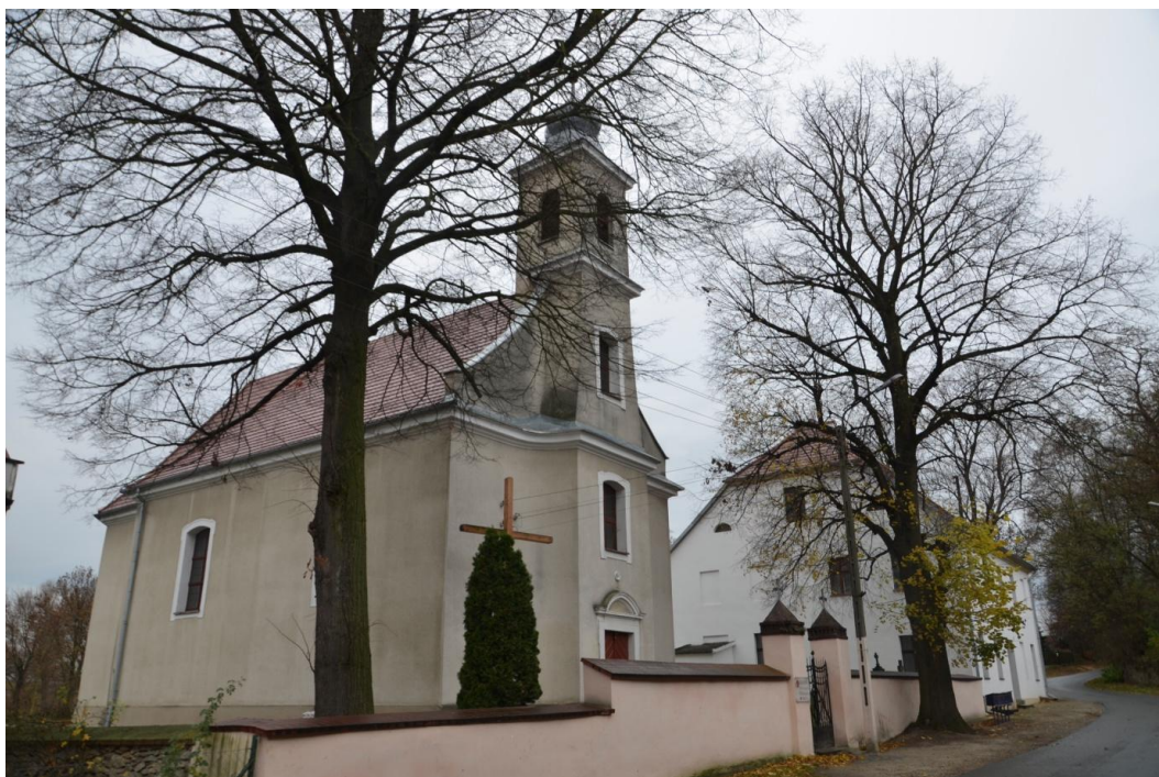
Fot. Dankowice - Kościół p.w. Świętego Józefa Oblubieńca.

Kościół parafialny p.w. Świętego Józefa Oblubieńca, orientowany, usytuowany jest przy północnej stronie drogi ze Strzelina do Niemczy. Kościół jest otoczony kamiennym murem z furtą od strony zachodniej, od strony południowej za murem znajdują się plebania oraz zabudowania gospodarcze. Kościół jednonawowy, został wzniesiony w latach 1817-1819, restaurowany w połowie XIX w. Ściany kościoła wykonane są z granitu, otynkowane, z kamiennym cokołem profilowanym gzymsem koronującym. Korpus przykryty sklepieniem zwierciadlanym, natomiast kruchta i zakrystia sklepione kolebami, wieża dachowa wykonana z drewna, a dach pokryty został podwójną dachówką karpiówką, hełm wieży po remoncie został obity blachą ocynkową. Posadzka w korpusie wykonana została z terakoty, natomiast w kruchcie posadzkę ułożono z płyt kamiennych. Na emporę prowadzą schody ślimakowe cementowe. Otwory okienne nierozglifione, zamknięte łukiem odcinkowym w tynkowych uszakowych opaskach. Kościół zbudowany został na planie prostokąta z węższym prezbiterium o zaokrąglonych narożach. Od strony południowej do prezbiterium przylega zakrystia zbudowana na planie prostokąta, natomiast od strony zachodniej do kościoła przylega wieża.