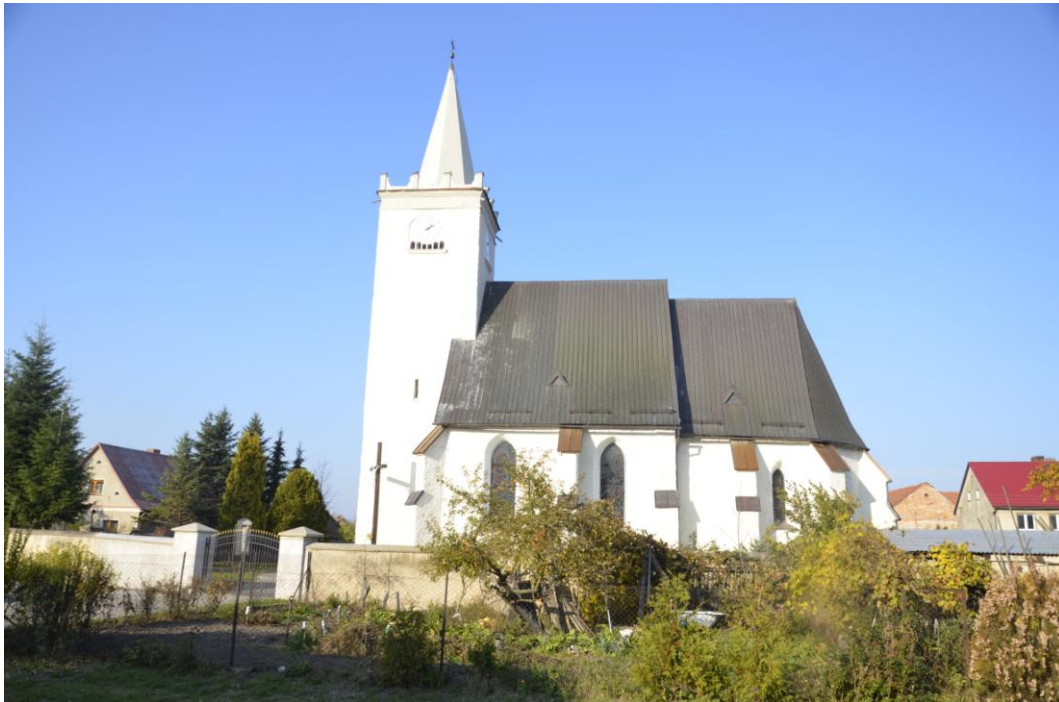
Fot. Biedrzychów – Kościół p. w. Narodzenia Św. Jana Chrzciciela.