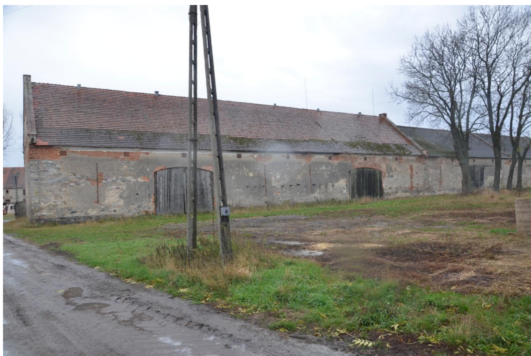
Fot. Muchowiec – Stodoła III i IV