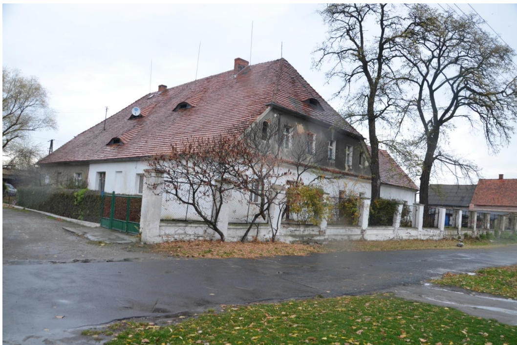
Fot. Muchowiec – dwór.