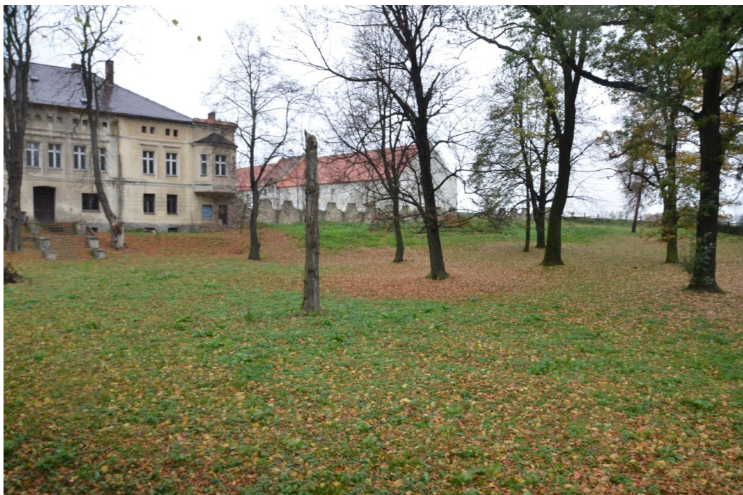
Fot. Wąwolnica – Park pałacowy

Rezydencja o cechach neorenesansowych, wzniesiona po 1840 roku, remontowany po 1985 roku. Pałac murowany z kamienia i cegły, otynkowany, założony na planie prostokąta, podpiwniczony, dwukondygnacyjny, z zagospodarowanym poddaszem, nakryty dachem czterospadowym i płaskim nad dobudówką. Elewacje zachowały liczne detale architektoniczne: boniowane przyziemie, proste gzymsy nadokienne. Pałac skierowany jest elewacją frontową na dziedziniec folwarczny. Wokół dziedzińca zabudowania gospodarcze z drugiej połowy XIX w. Od południa do rezydencji przylega niewielki park krajobrazowy z drugiej połowy XIX w. W parku dominuje liściasty drzewostan: dęby, kasztanowce, jesiony.