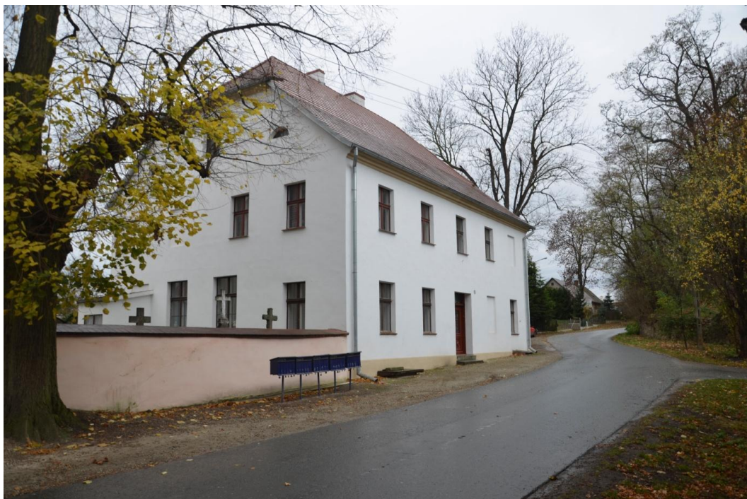
Fot. Dankowice – budynek plebanii