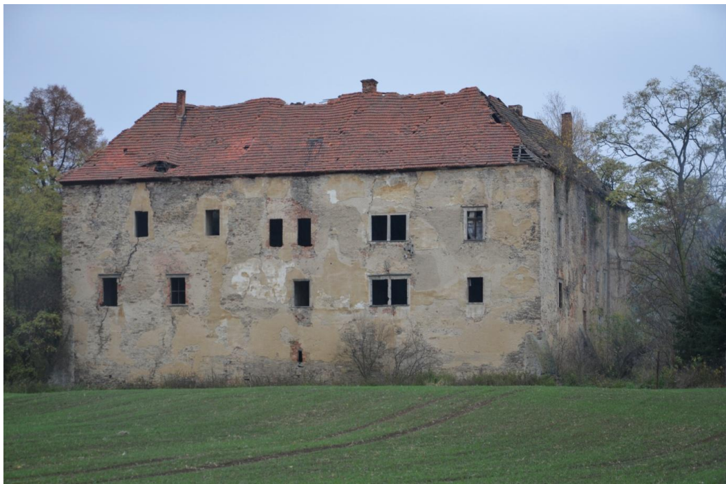
Fot. Nieszkowice - Pałac

zblizonym do litere „C”, składający się z trzech skrzydeł, których ramiona otwierają się w kierunku zachodnim tworzą prostokątny dziedziniec. Układ wnętrz jednotraktowy.