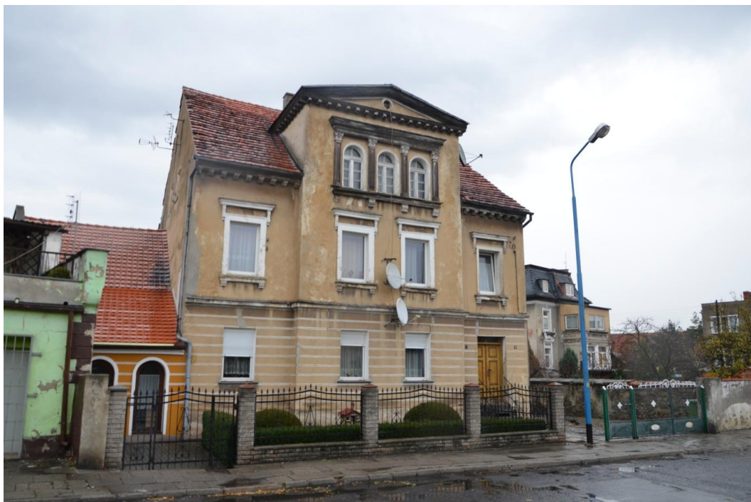
Fot. Strzelin – Dom mieszkalny – ul. Brzegowa 13