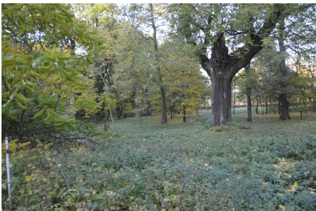
Fot. Warkocz – Park krajobrazowy