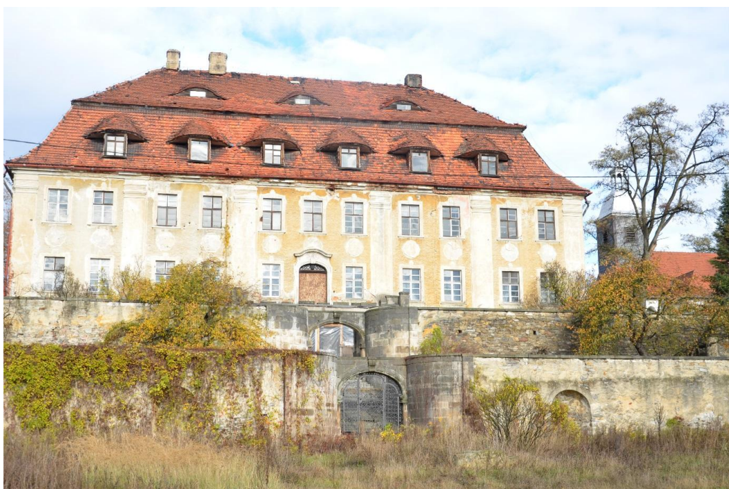
Fot. Żeleźnik – Pałac