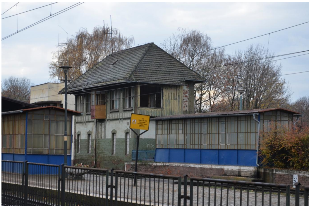
Fot. Strzelin – Dworzec - Nastawnia