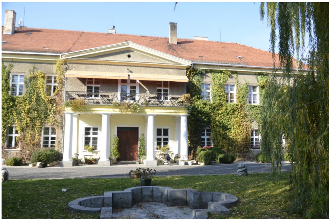
Fot. Krzepice - pałac