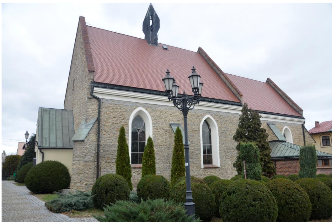
Fot. Strzelin – Kościół par. Matki Chrystusa i św. Jana od Ewangelii Braci Czeskich