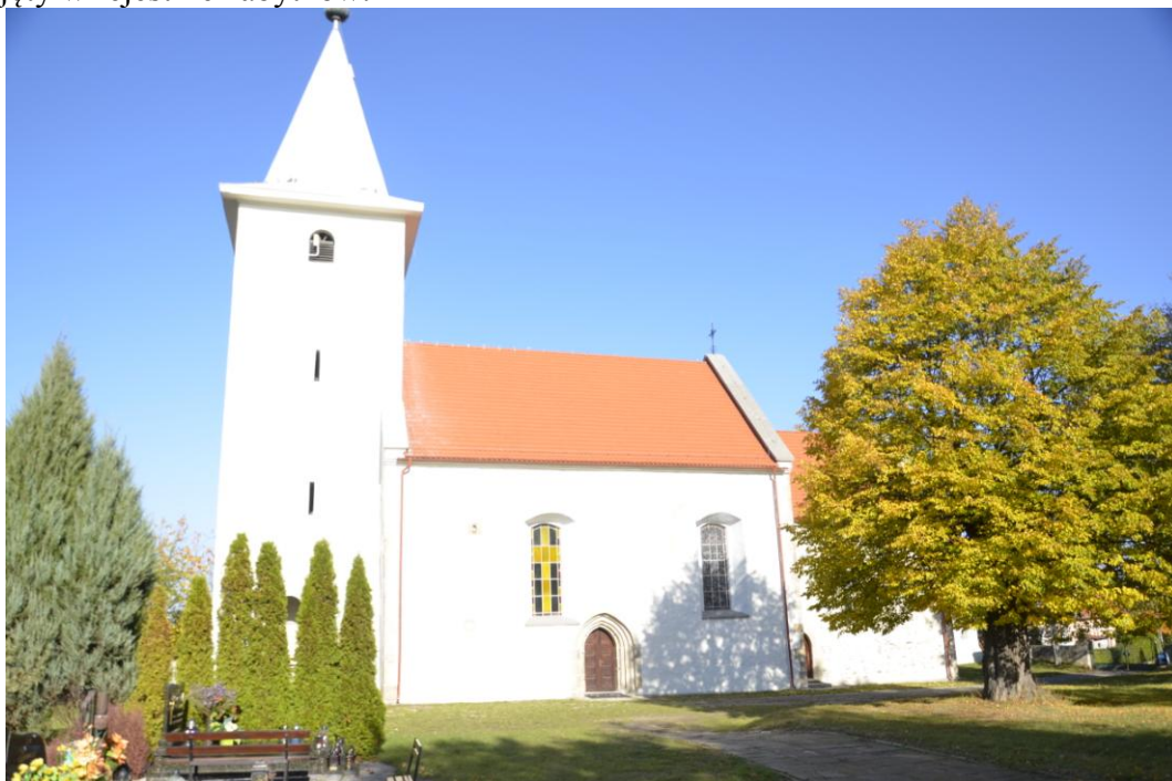
Fot. Karszów - Kościół fil. Niepokalanego Poczęcia NMP

Na terenie wsi znajduje się wpisany do rejestru zabytków cmentarz przykościelny o powierzchni 0.3 ha. W związku z tym iż pierwsze wzmianki o znajdującym się tam obecnie odbudowanym kościele pochodzą z XIII w. należy przyjąć, że najstarsze pochówki należy datować na średniowiecze. Kościół w stylu gotyckim został zniszczony w trakcie działań II wojennych i uległ destrukcji jeszcze w latach powojennych. Obecny odbudowany kościół jest ujęty w rejestrze zabytków.