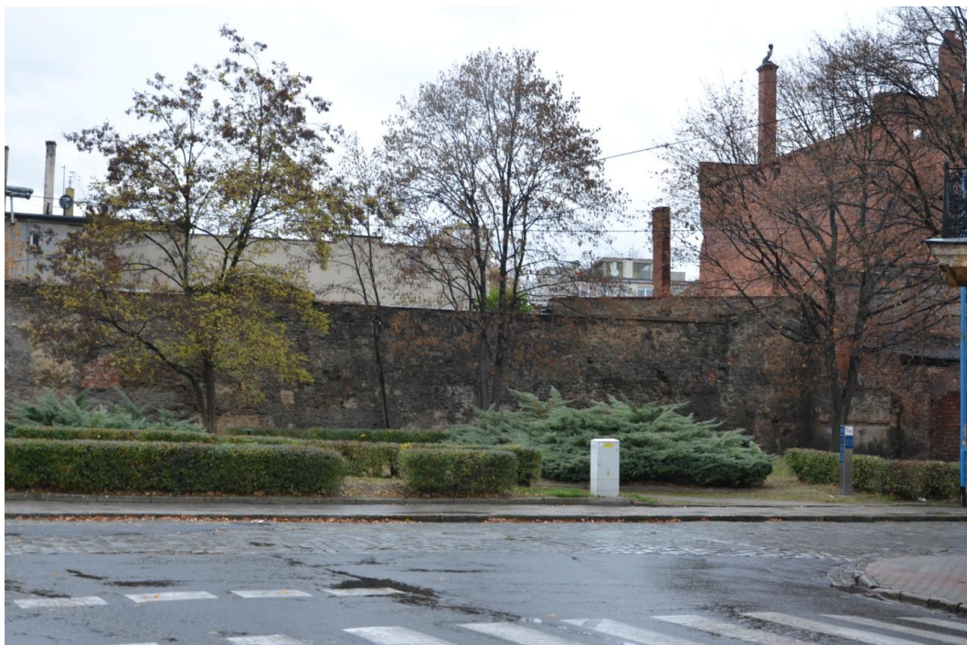
Fot. Strzelin Mury miejskie ul. Brzegowa