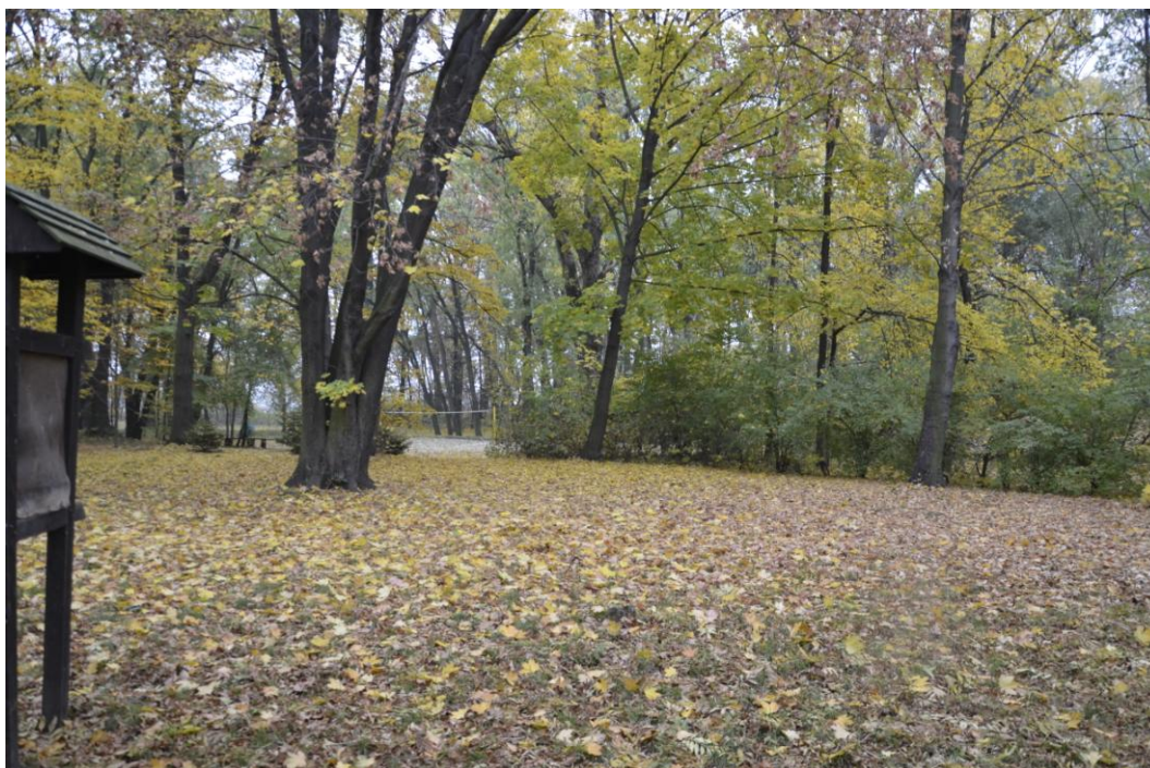
Fot. Ludów Polski - Park

Zabudowania majątku ziemskiego znajdują się terenie północno-wschodniej części wsi. Wzdłuż południowo-zachodniego skrzydła folwarku przybiega droga asfaltowa Strzeli – Wrocław. Pałac usytuowany jest na północ w znacznej odległości od folwarku, ponadto jest on oddzielony sadem i ogrodem warzywnym. Rezydencja otoczona jest o północy i wschodu parkiem. Fundamenty i cokoły pałac wykonane są z kamienne. Budynek murowany z cegły, otynkowany, dwuskrzydłowy, założony na planie litery „L”, podpiwniczony, dwu- i trzykondygnacyjny w partii ryzalitu. Pałac przykryty dwuspadowym dachem, nad ryzalitem znajduje się niski czterospadowy dach, natomiast nad tarasem jednospadowy. Fasada ośmioosiowa, z głównym wejściem znajdującym się w niższym skrzydle. Wejście poprzedzają schody i ganek. Elewacje przekształcone, dzielone lizenami i gzymsami, poza tym pozbawione detali architektonicznych.