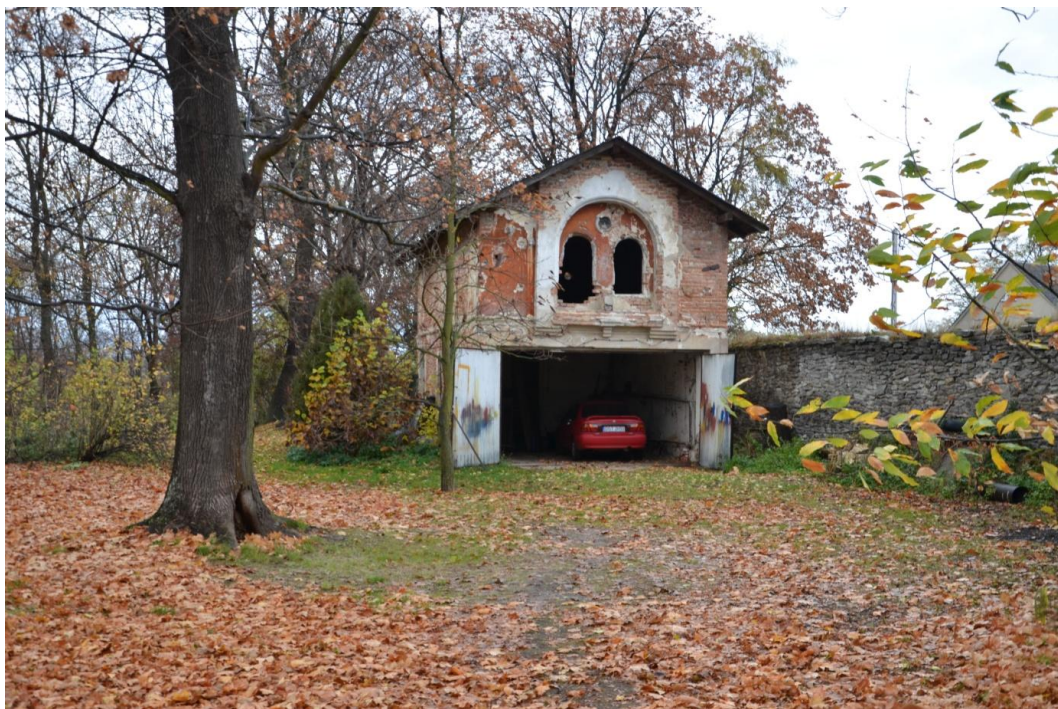
Altana w Parku