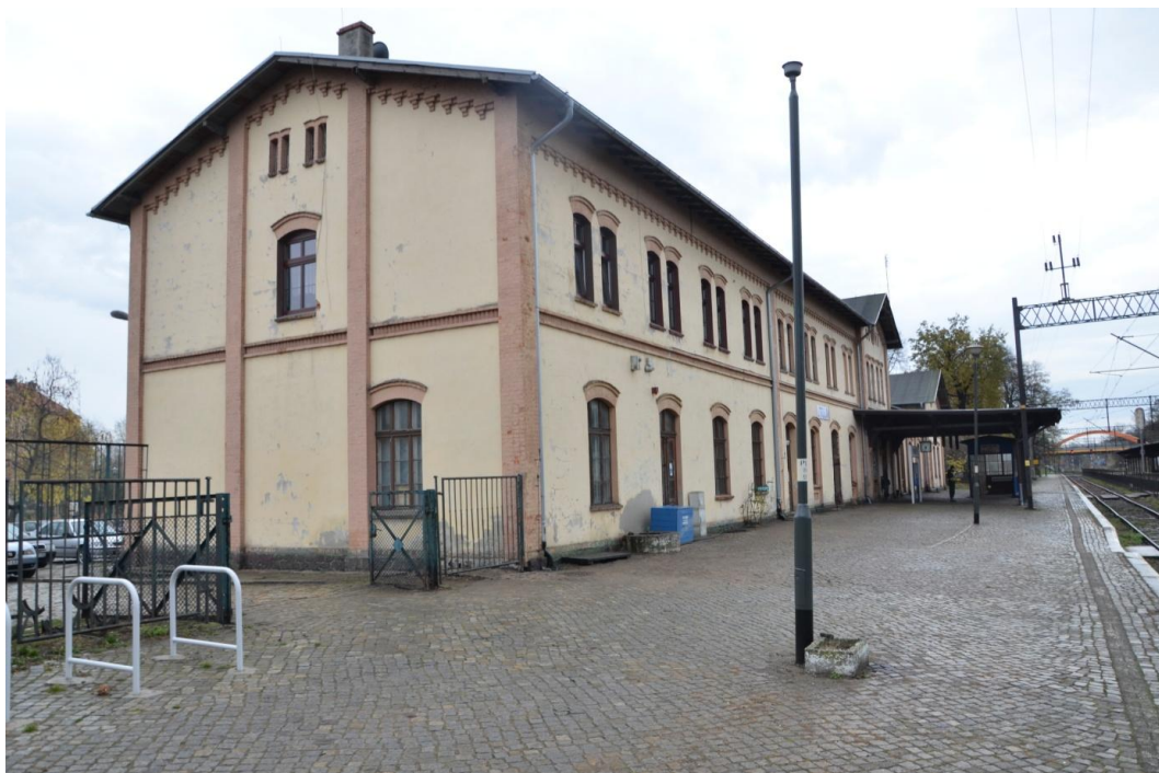
Fot. Strzelin –Dworzec