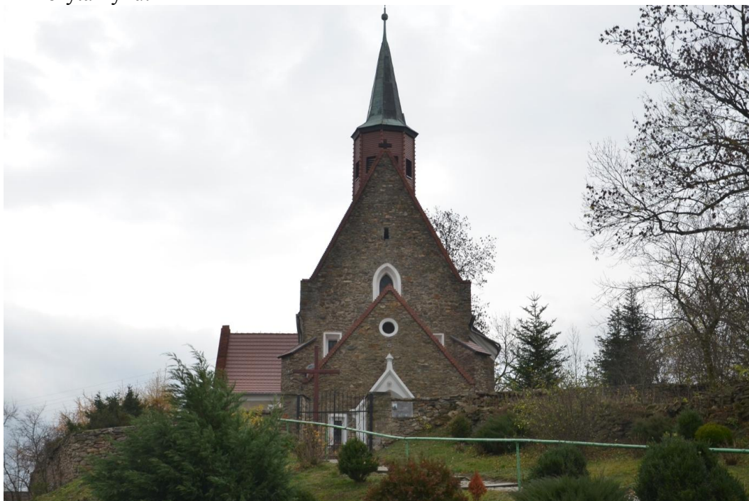
Fot. Nieszkowice – Kościół p. w. św. Jana Kantego

Dwór usytuowany jest u podnóża zalesionych Wzgórz Lipowych stanowiących część pasma wzniesień zwanych Wyżyną Strzelińską w pobliżu szosy łączącej Strzelin z Ząbkowicami Śląskimi. Budowla zwrócona jest skrzydłami w stronę rozległego czworobocznie uszeregowanego majdanu, z którym łączy się ona poprzez murowany, przerzucony przez obecnie wyschniętą fosę pomost. Pomiędzy skrzydłami dworu –