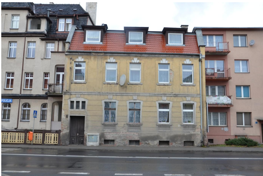
Fot. Strzelin – Dom mieszkalny ul. Wolności 17