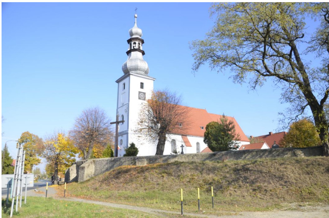
Kościół p.w. Świętego Jakuba

W tejże miejscowości znajduje się również pochodzący z I połowy XIX w. pałac. Usytuowany jest on na wschód od drogi ze Strzelina do Oławy, i w kierunku południowym od kościoła parafialnego. Pałac posiada dziedziniec, otoczony trzema skrzydłami zabudowań gospodarczych, od ulicy oddziela go metalowe ogrodzenie (przed fasadą oraz na południe od niej) oraz murem kamiennym z bramą od strony południowo-zachodniej narożnika pałacu na