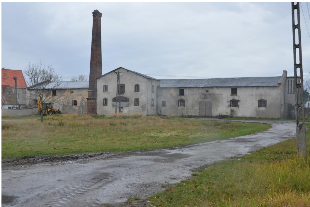
Fot. Muchowiec – Gorzelnia