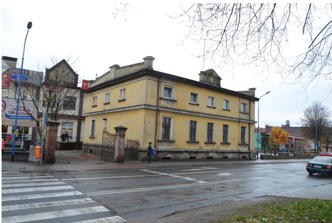
Fot. Strzelin – Dom mieszkalny ul. Wolności 12