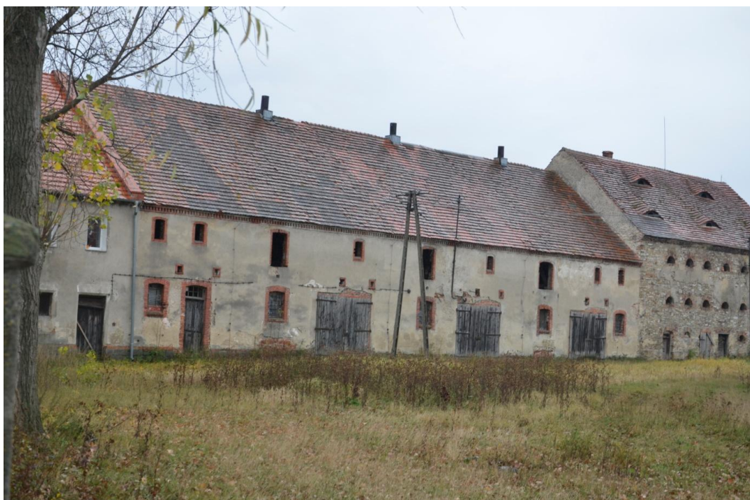
Fot. Muchowiec – Stodoła.