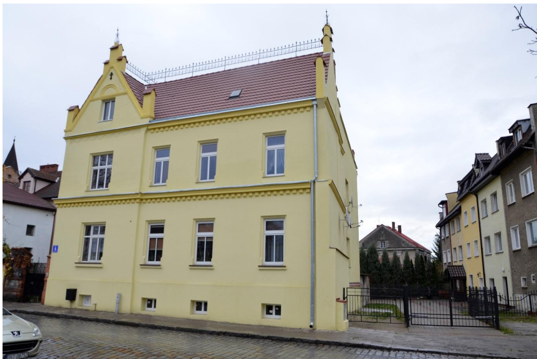
Fot. Strzelin – Dom mieszkalny ul. Stasica 4