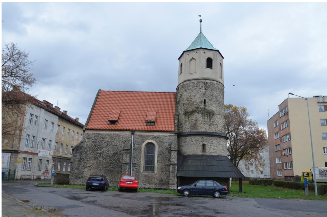
Fot. Strzelin – Kościół św. Gotarda