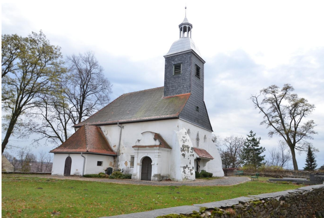
Fot. Żeleźnik – Kościół p. w. Matki Boskiej Szkaplerznej.