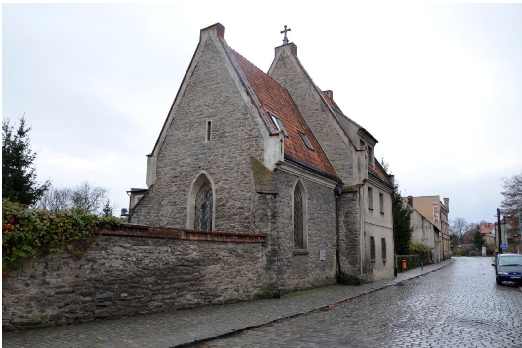
Fot. Strzelin – Kaplica szpitalna św. Jerzego