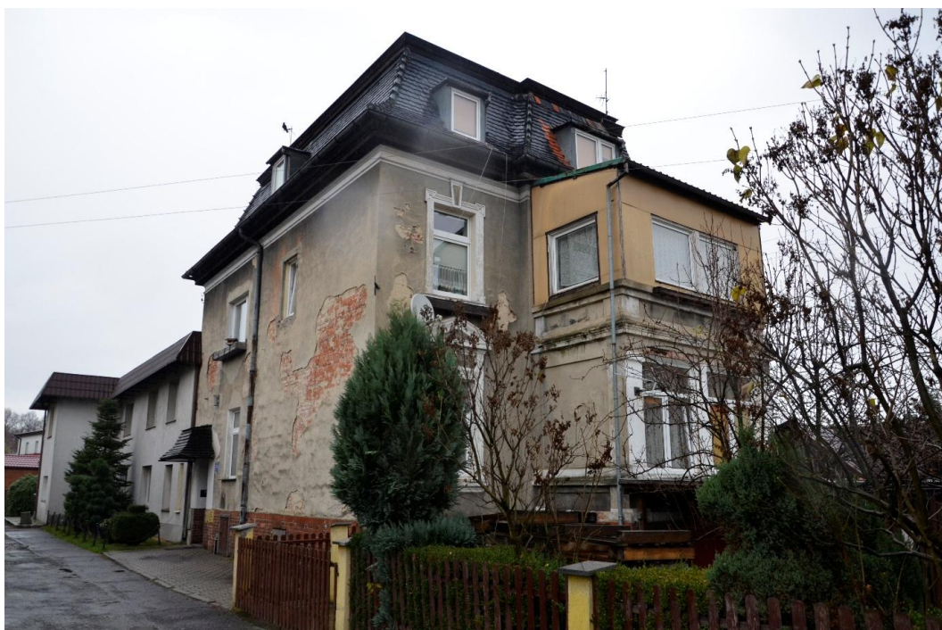
Fot. Strzelin – Dom mieszkalny ul. Brzegowa 17 b