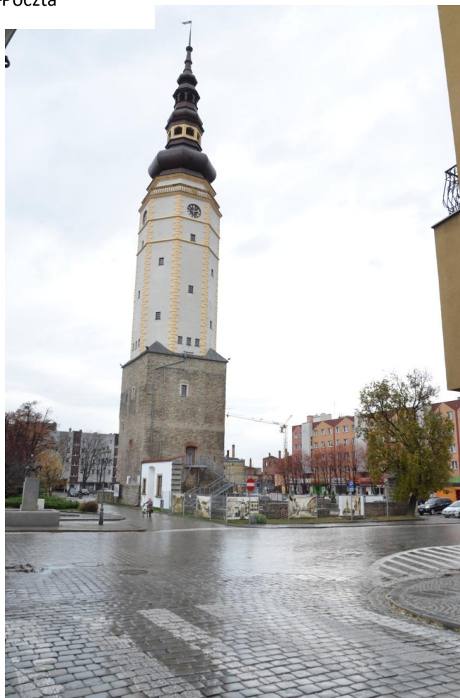
Fot. Strzelin – Wieża Ratuszowa