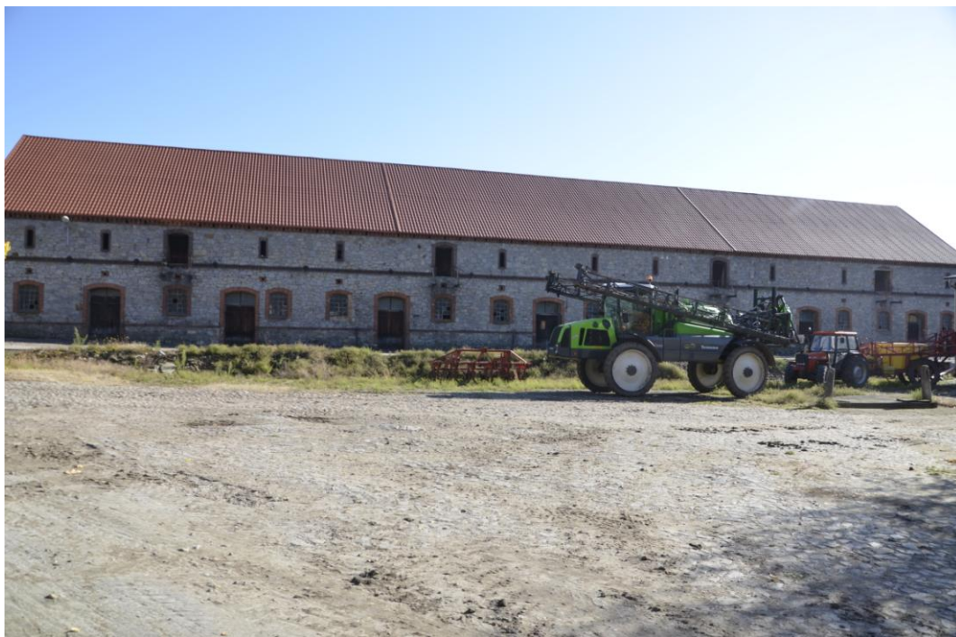
Fot. Dobrogoszcz – Stodola