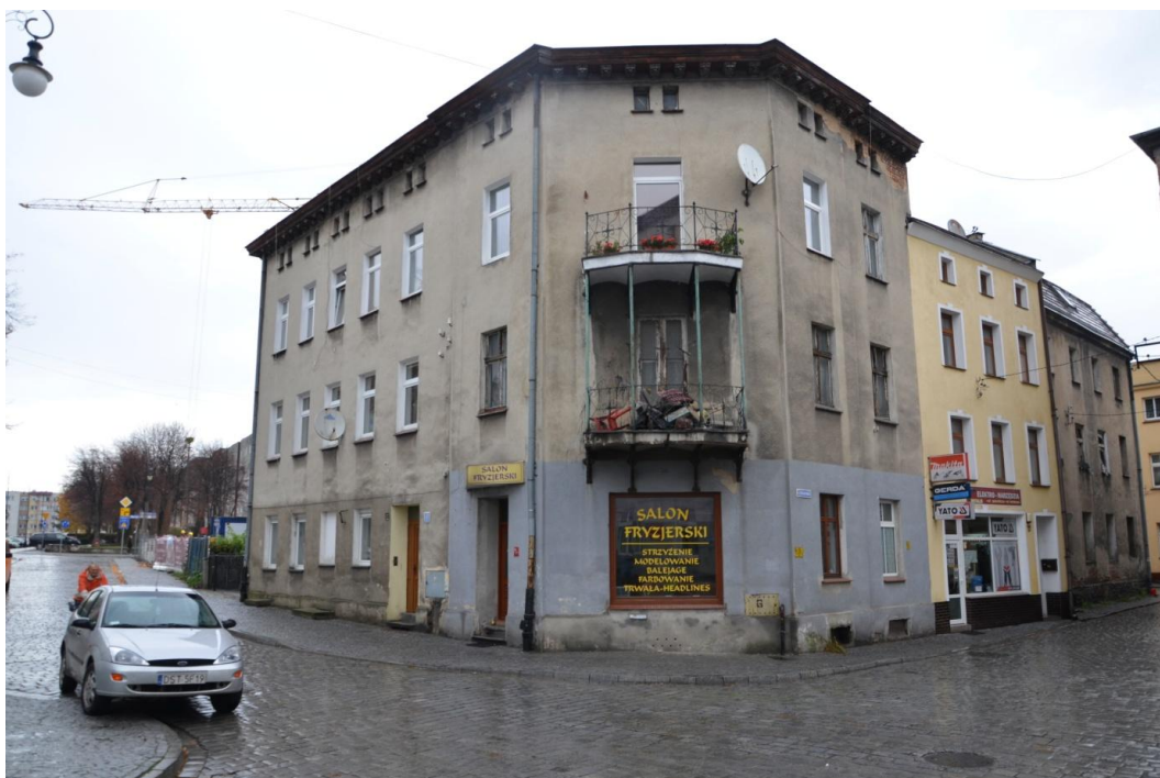
Fot. Strzelin – Dom mieszkalny ul Wodna 5