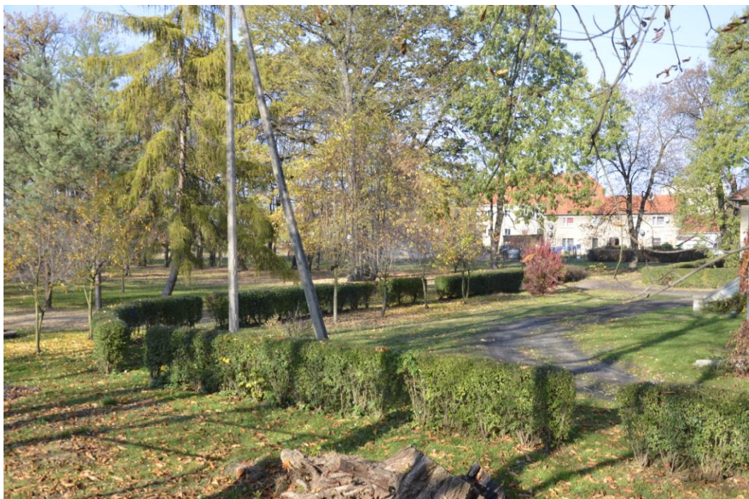
Fot. Głęboka – Zespół parkowy