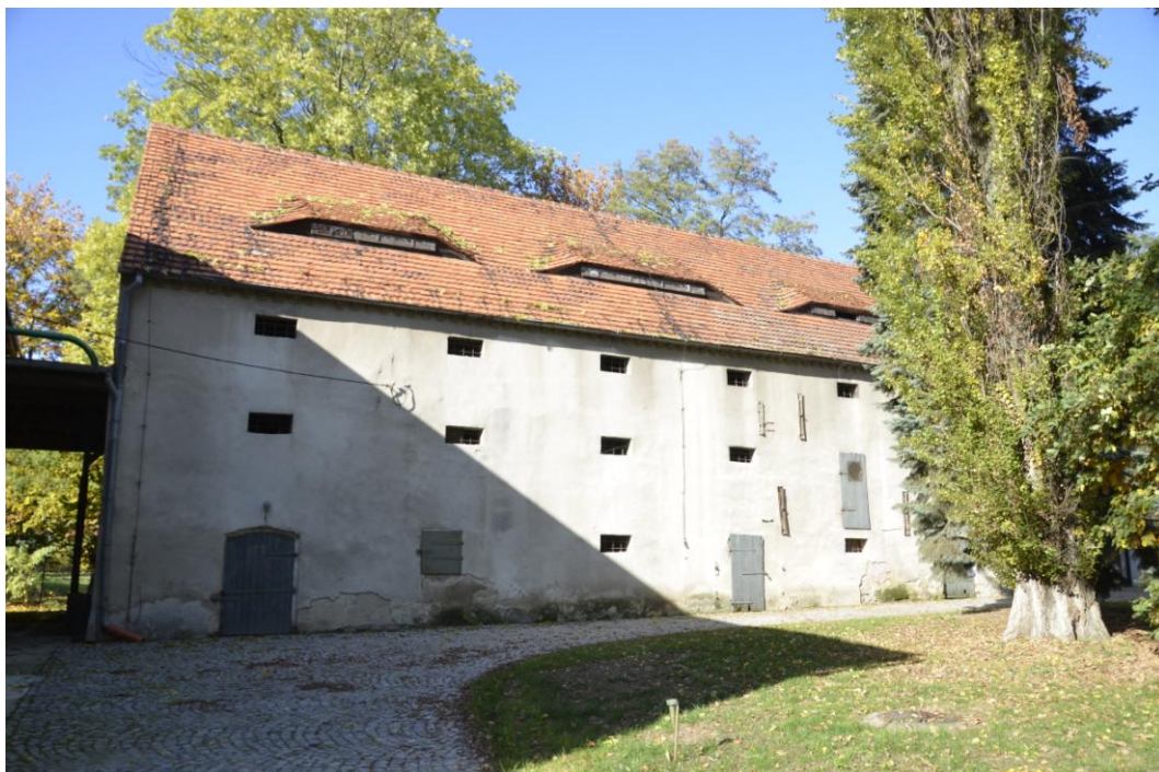
Fot. Dobroszcz – Spichlerz.