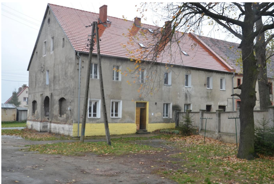
Fot. Muchowiec – Oficyna mieszkalna II nr 42