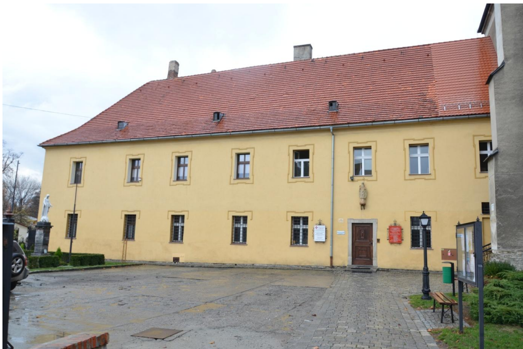
Fot. Strzelin – Klasztor ss. Boromeuszek