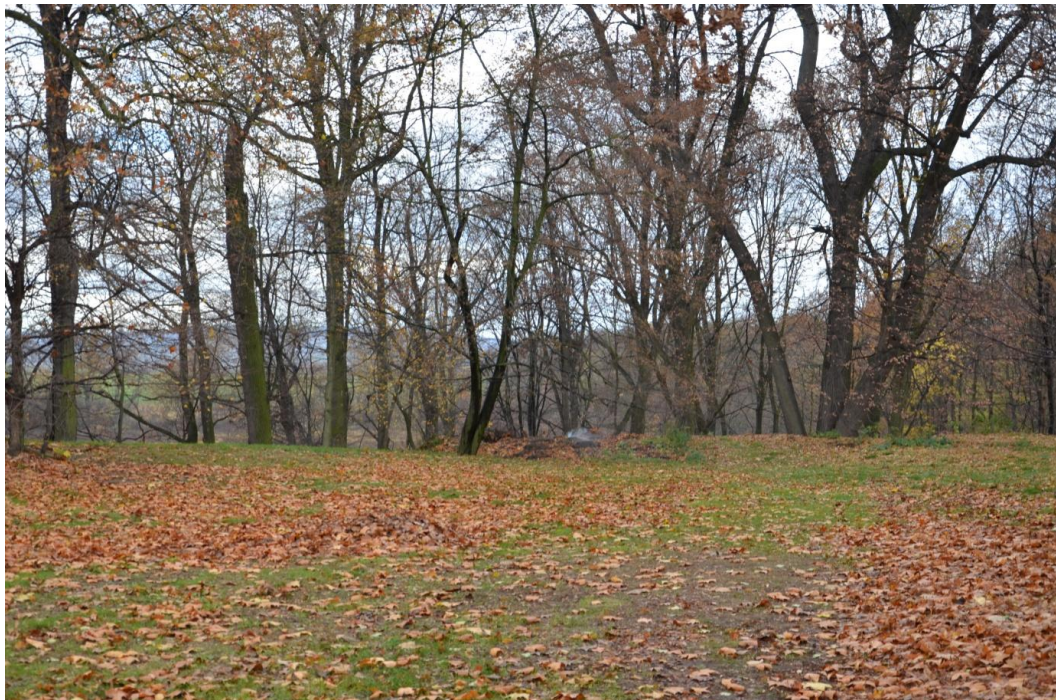
Fot. Żeleźnik – Park