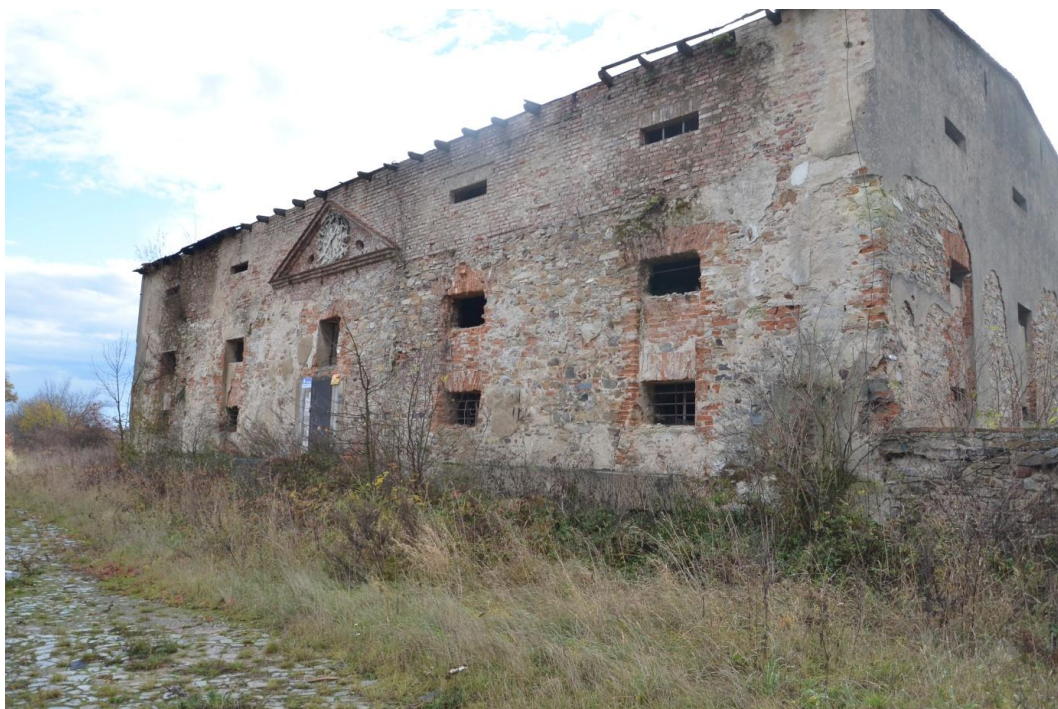
Fot. Żeleźnik – Spichlerz.