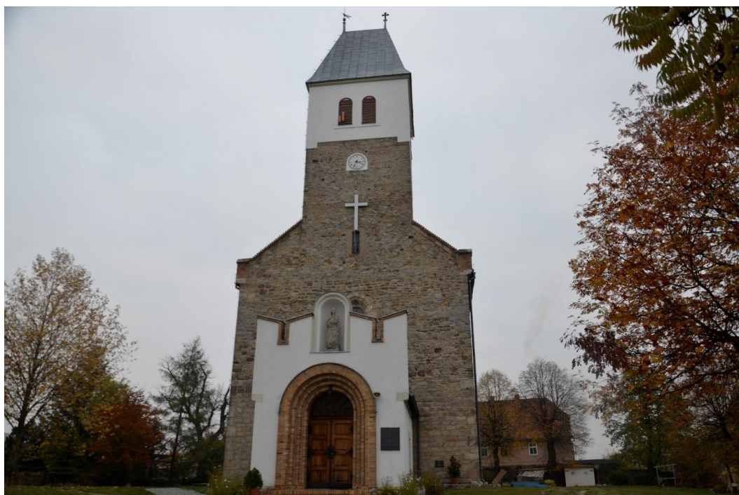
Fot. Biały Kościół - Kościół p. w. Najświętszej Marii Panny.