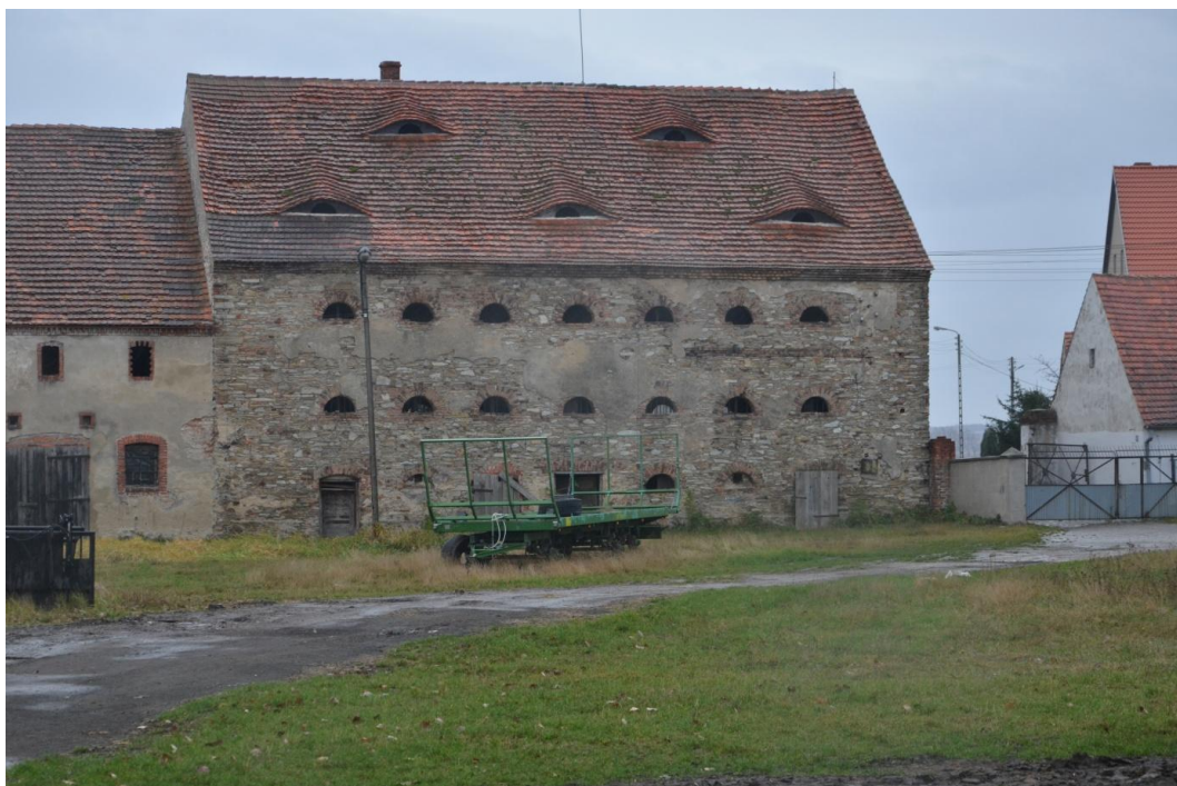
Fot. Muchowiec – Spichlerz