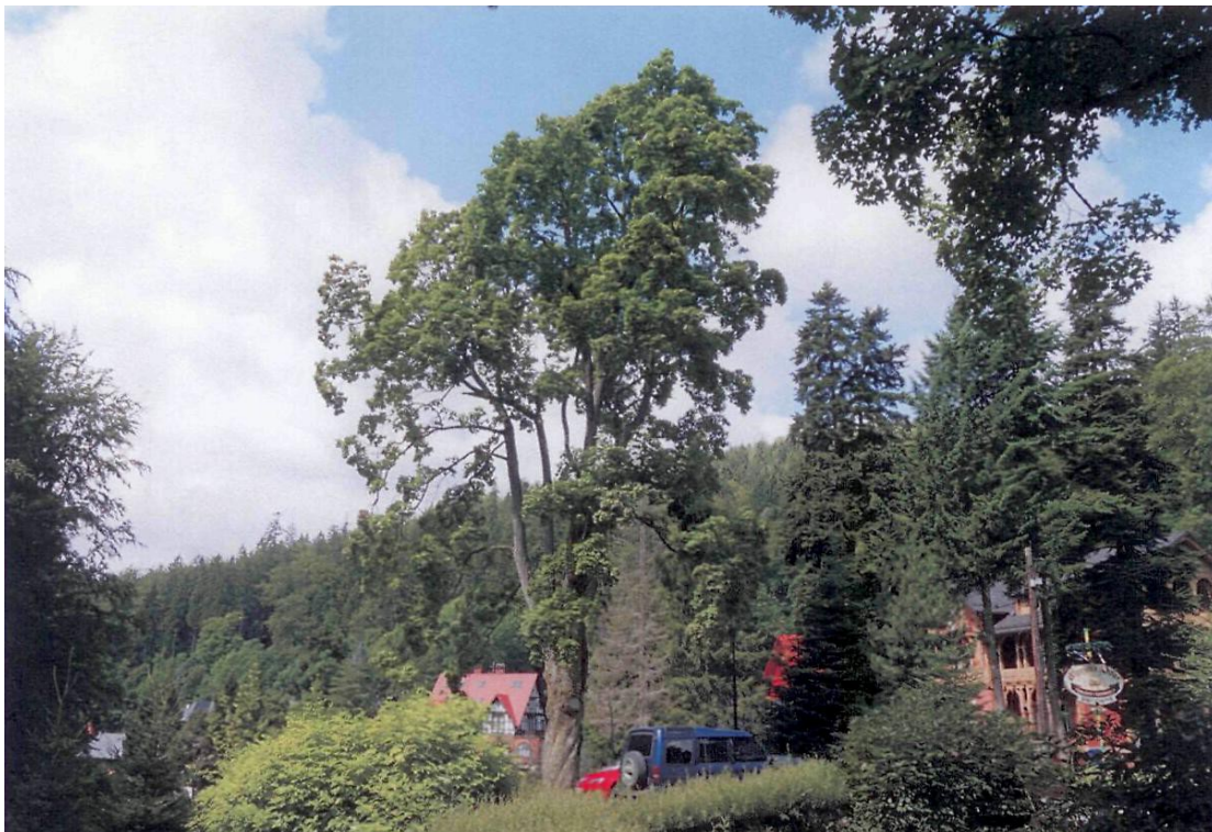
– Klon zwyczajny

Załącznik nr 1 do uchwały nr XLII/346/17 Rady Miejskiej w Bystrzycy Kłodzkiej z dnia 29 czerwca 2017 r.