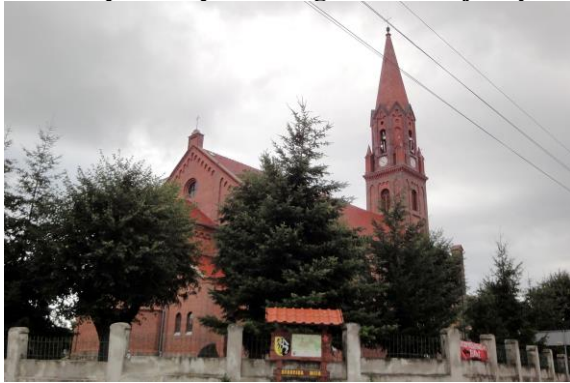
Zdjęcie nr 12. Kościół pw. Niepokalanego Serca Najświętszej Marii Panny w Strupinie

Pierwotny kościół ewangelicki, zniszczony przez husytów na pocz. XV w., po odbudowie został przejęty przez protestantów. Kolejna odbudowa nastąpiła po zniszczeniach wojny trzydziestoletniej, w 1663 r. dodano barokową drewnianą dzwonicę - wieżę. Na przełomie XVII/XVIII w. kościół zyskał bogaty wystrój. W 1828 r. z powodu złego stanu technicznego budowlę rozebrano i zbudowano od nowa w latach 1878 - 1880 według projektu mistrza budowlanego Krause ze Strupiny.