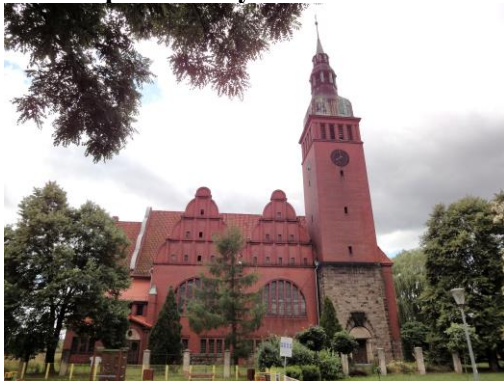
Zdjęcie nr 11. Kościół pomocniczy św. Józefa Oblubieńca w Prusicach, ul. Powstańców Śląskich 8

Kościół zbudowany w latach 1910 - 1911, jako ewangelicki. W 1956 r. przekazany kościołowi rzymskokatolickiemu, ponownie oddany do użytku w 1986 r. Styloво stanowi połączenie modernizmu z elementami stylów historycznych, z zacytowaniem formy szczytów ratusza w Prusicach. Jest to projekt wrocławskiej spółki architektonicznej R. Gaze & Büttcher.