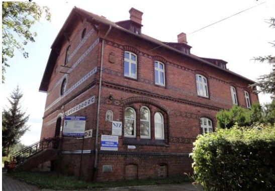
Zdjęcie nr 8. Budynek Ośrodka Zdrowia w Prusicach, ul. Żmigrodzka 22

Wzniesiony w miejscu Na miejscu obecnego Ośrodka Zdrowia w 1312 r. istniała kaplica pw. Nawiedzenia NMP (wzmiankowany w 1312 r., przebudowana ok. poł. XVI w.) i cmentarz dla ubogich i szpitalników. Zlikwidowana ok. 1803 r., cmentarz funkcjonował do poł. XIX w. W 1900 r. w miejscu kaplicy i cmentarza powstał budynek opieki dla ubogich z kaplicą modlitewną. W 1947 r. uruchomiono tu Ośrodek Zdrowia.