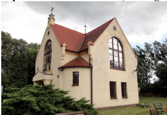
Zdjęcie nr 16. Kaplica cmentarna w Prusicach, ul. Żmigrodzka

Kaplica cmentarna, murowana, na rzucie krzyża, powstała w 1914 r. Przed wejściem dwie przysadziste kolumny wspierające trójkątny naczółek, na bokach zwieńczony kamiennymi krzyżami. W narożnikach znajdują się sterczyny. Górne okna zamknięte półkoliście, nad nimi oculusy. Frontowy