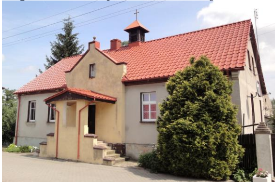
Zdjęcie nr 15. Kaplica mszalna pw. MB Królowej Polski, Kaszyce Wielkie nr 28

Kaplica powstała w 1872 r. Budynek przypomina dom mieszkalny, w kalenicy - sygnaturka. Do 1933 r. była tu katolicka kaplica pw. św. Józefa.