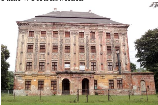
Zdjęcie nr 5. Pałac w Piotrkowicach