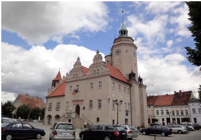
Zdjęcie nr 7. Ratusz w Prusicach

Ratusz wzmiankowany w 1512 r., spalony w 1529r., odbudowany w latach 1529-1553 wg projektu Jakuba Paara, w stylu renesansowym; w 1742 r. - od płn. dobudowano zbór ewangelicki. W1831r. budynek przebudowany, obecną formę uzyskał w latach 1932 - 1938 (projekt Ericha Graua), kiedy rozebrano zbór i wzniesiono nowy budynek z podcieniami, zabudowanymi w 1982 r. Poddany rewaloryzacji w latach 2010 - 2012. Budynek renesansowy z elementami gotyckimi.