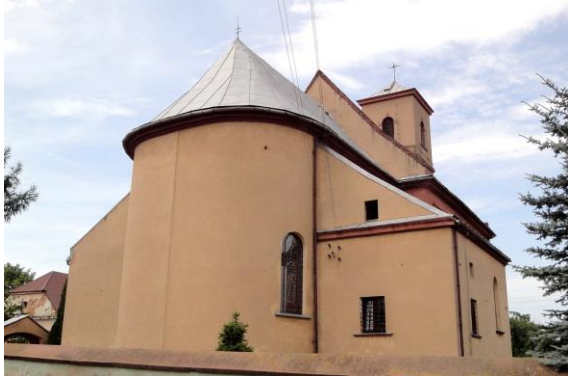
Zdjęcie nr 14. Kościół pw. św. Michała Archanioła we Wszemirowie

Pierwotnie drewniany kościół wzmiankowany jest w 1300 r., obecny barokowy, wzniesiony w 1780 r., restaurowany w XIX w. i 1972 r.