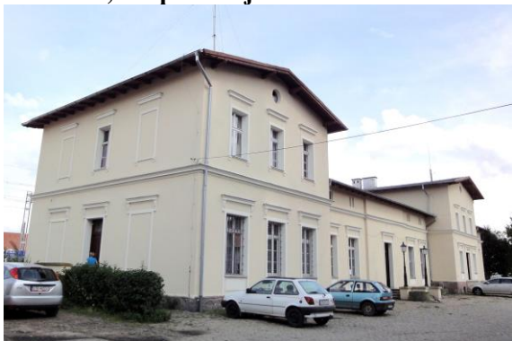
Zdjęcie nr 17. Budynek stacyjny, Skokowa

Zespół pochodzi z ok. 1880 r. Budynek stacyjny na rzucie „L” z przybudówką od płd. Parterowy z poddaszem, czteroskrzydłowy, skrzydła poprzeczne dwukondygnacyjne, wysunięte ryzalitowo. Murowany, dachy dwuspadowe z okapami wspartymi na ozdobnie wyciętych końcówkach krokwi. Elewacje tynkowane ujęte gzymsem kordonowym. W szczytach elewacji bocznych skrzydeł oculusy - od ulicy i medaliony - od peronu: w jednym postać kobieca z modelem stacji i rozwiniętym pergaminem, w drugim - postać kobieca trzymająca młot i obcęgi.