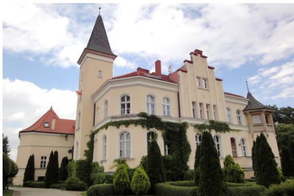
Zdjęcie nr 1. Pałac w Brzeźnie

Rezydencja wzmiankowana 1787 r. i 1830 r., obecna budowla z 1830 r., przebudowana w 1913 r. Budynek o znacznie rozczłonkowanej bryle, murowany, tynkowany, założony na planie zbliżonym do prostokąta, z różnorodnymi ryzalitami, gankiem i wydatnym wielobocznym aneksem z werandą na piętrze - w narożniku płn. - wsch., balkonem oraz z kwadratową wieżą. Podpiwniczony, dwukondygnacyjny, z częściowo użytkowym poddaszem, nakryty dachem wielospadowym z lukarnami. Ściany gładko tynkowane, podziały poziome w formie gzymsów podokiennych, międzykondygnacyjnego fryzu ujętego w gzymsy i fryzu z gzymsem - w zwieńczeniu. W szczycie - podziały lizenowe. Okna prostokątne i zamknięte łukiem tudora, w profilowanych opaskach.