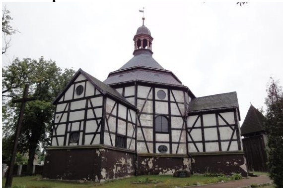
Zdjęcie nr 13. Kościół pw. św. Piotra i Pawła w Pawłowie Trzebnickim

W średniowieczu we wsi istniała kaplica, w latach ok. 1550 - 1554 znajdująca się w rękach ewangelików, w latach 1554 - 1708 ponownie w rękach katolików. W 1708 - 1709 wzniesiono obecny barokowy kościół ewangelicki, który początkowo był dwuwyznaniowy. Restaurowany w 1972 r.