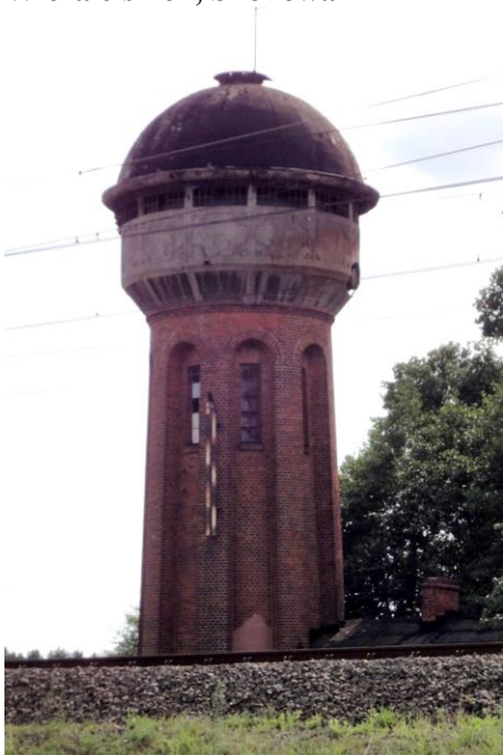
Zdjęcie nr 18. Wieża ciśnień, Skokowa

Wieża ciśnień pochodzi z ok. 1915 r. Na rzucie koła, murowana, ceglana. Nadwieszony zbiornik tynkowany fakturalnie z dekoracją z gładkiego tynku. Poniżej - głęboko wcięte lizeny u góry połączone arkadowo.