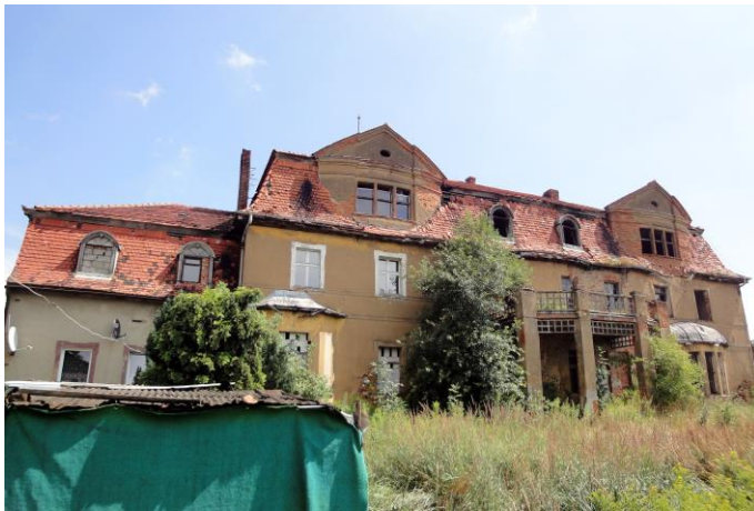
Zdjęcie nr 6. Pałac w Górowie

Zbudowany ok. 1800r., przebudowany w 1871 r. wg projektu Wassermnna. Budynek na rzucie wydłużonego prostokąta, podpiwniczony, dwukondygnacyjny, z użytkowym poddaszem, z dwoma węższymi skrzydłami. Dach główny mansardowy z facjatkami zwieńczonymi szczytami wykrojonymi w spływy wolutowe i lukarnami, skrzydła przykryte dachami mansardowo-naczółkowymi. Na osi fasady trójosiowy podcień kolumnowy dźwigający taras, na osi elewacji ogrodowej - podcień filarowy, w skrajnych osiach elewacji ogrodowej - jednokondygnacyjne ryzality: na rzucie trapezu i na rzucie odcinka koła. Wnętrze dwutraktowe z sienią na rzucie litery K. Elewacje na cokole zaznaczonym uskokiem, dzielone pionowymi ramiakami ujmującymi poszczególne osie okienne. Okna w opaskach z górnymi uszakami, w strefie międzyokiennej każdej osi - prostokątna płycina z wgłębnym owalem. Detal architektoniczny wypracowany w tynku.