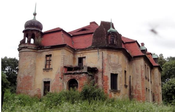
Zdjęcie nr 4. Pałac w Ligocie Strupińskiej

Pałac wzmiankowany w 1845 r., obecny wzniesiony ok. 1890 r. jest własnością prywatną. Zleceniodawcą jego budowy była zapewne hrabina Agnes von Pourtalès. Neobarokowy budynek murowany, na planie rozczłonkowanego prostokąta ze ściętym narożem, z aneksami, ryzalitami i trójkondygnacyjną, cylindryczną basztą w narożu płn. - zach., zwieńczoną cebulastym hełmem. Podpiwniczony, dwukondygnacyjny, nakryty dachami mansardowymi z lukarnami. Dwuosiowa fasada skomponowana asymetrycznie, z wejściem umieszczonym w parterowym ganku zwieńczonym balkonem. Elewacje ryzalitowane, narożniki zaakcentowane boniowaniem, okna w uszakowych opaskach ze zwornikiem w kluczu; W części okien podwieszony ornament cęgowy - pod parapetami oraz spływy wolutowe po bokach zworników. Detal architektoniczny wypracowany w tynku.