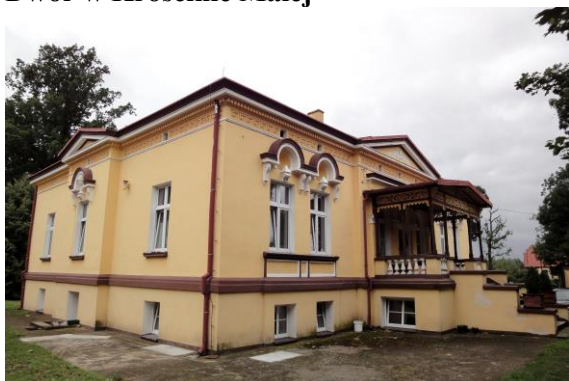
Zdjęcie nr 2. Dwór w Krościnie Małej

Dwór o formie palladiańskiej willi - eklektyczny z elementami neorenesanu - ok. 1880 r. Dwór założony na rzucie prostokąta zbliżonego do kwadratu, podpiwniczony, parterowy, z użytkowym poddaszem, nakryty dachem czterosпадowym o niewielkim kącie nachylenia połaci. Fasada siedmioosiowa z centralnym trzyosiowym ryzalitem mieszczącym główne wejście, ryzalit zwieńczony trójkątnym przyczółkiem, poprzedzony jest gankiem ze schodami. W elewacji tylnej i bocznej elewacji wsch. - płytkie ryzality. Elewacje bogate w detale architektoniczne: wieńczący gzyms kostkowy, fryz, nad oknami półkoliste naczółki z dekoracją sztukatorską, płyciny podokienne, profilowane opaski okien w części obramień zastąpione pilastrami z kompozytowymi głowicami. Dach tarasu wsparty na drewnianych słupach z dekoracją ciesielską o motywach roślinnych,