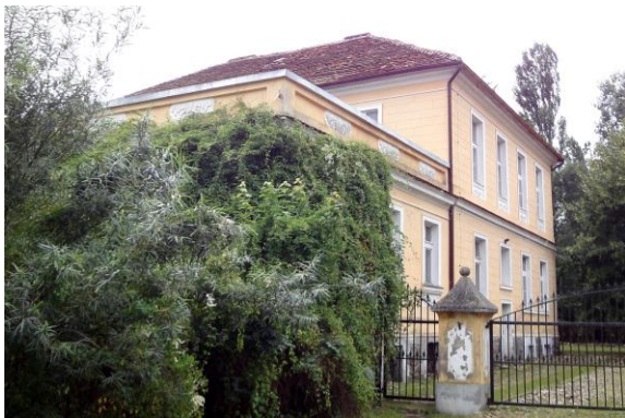
Zdjęcie nr 3. Dwór w Raszowicach

Dwór wzmiankowany w 1830 r., w obecnej formie klasycystyczny z 1860 r. i 1900 r. Murowany z cegły, tynkowany, założony na rzucie prostokąta, z parterową przybudówką zwieńczoną tarasem - od wsch. Podpiwniczony, dwukondygnacyjny nakryty dachem czterospadowym. Elewacje zdobione boniowaniem pasowym, prostokątne okna w profilowanych opaskach, część z płycinami podokiennymi z dekoracją sztukatorską.