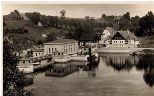
Elektrownia we Wrzeszczynie, pocztówka z l.30. XX w.