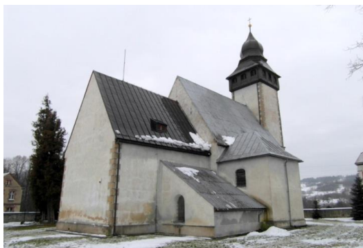
pocz. XIV w., pocz. XVI w., XVI/XVII, 1700 r.

Kościół wzmiankowany w 1399 r., obecna budowla pochodzi z pocz. XVI w., wzniesiona zapewne na miejscu starszej. Budynek orientowany, nawa trójprzęsłowa, z węższym i niższym prezbiterium dwuprzęsłowym. W na osi fasady wieża na rzucie kwadratu, zwieńczona drewnianym gankiem nakrytym baniastym hełmem z 1915 r. Od pn. barokowa kaplica z XVIII w., od pd. - kamienna kruchta z 1915 r.