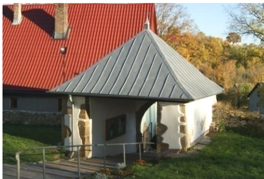
Brama na cmentarz

Kościół wzniesiony w 1 ćw. XV w., przebudowany w XVIII w.; remontowany w pocz. XX w., 1965 r., w latach 1980–81 i 2012 r. Owalny cmentarz przykościelny otoczony murem, z bramą o ostrołukowym prześwicie – XIV w., 2 poł. XIX w.