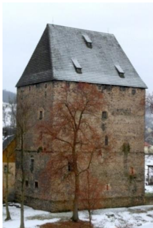
Wieża rycerska, pocz. XIV w., k.XVI w.