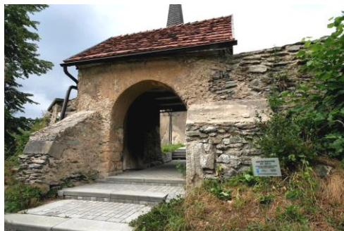
Brama w murze cmentarza przykościelnego

Kościół wzmiankowany w 1399 r., obecny z ok. poł. XIV w., przeb. w pocz. XVI w., remontowany w XVIII w., XIX w., 1957, 1979–80 i po 1990. Cmentarz pierwotnie grzebalny, otoczony murem – pocz. XVI w., z bramą z 1786 r.