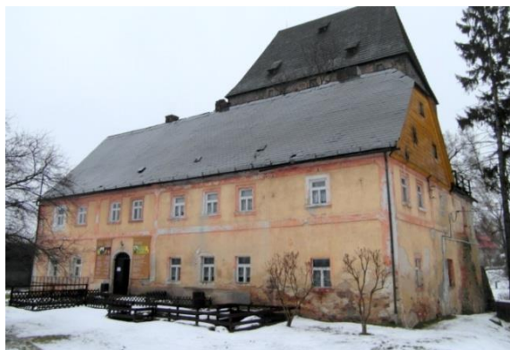
Oficyna, 2 poł. XVIII w.

Jeden z najstarszych i najcenniejszych zabytków Dolnego Śląska. Wieża wzniesiona w pocz. XIV w. dla ochrony przeprawy na Bobrze oraz jako rezydencja myśliwska księcia. Od 3 ćw. XIV w. znajdowała się w rękach Jentscha von Redern, potem w rękach rodziny von Zedlitz, w l. 1732–1945 – von Schaffgotsch.