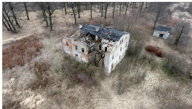
Fot. 12. Dwór w Kotowicach w roku 2018. Rok później został rozebrany.