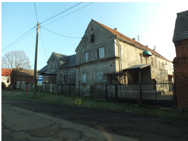
Fot. 37. Dawna gospoda w Wojszynie