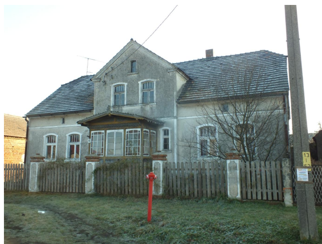
Fot. 36. Wojszyn nr 4 - dom mieszkalny