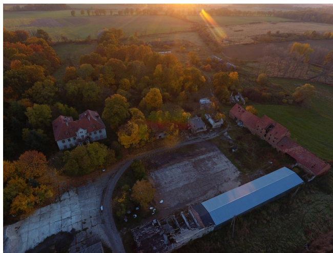
Fot. 26. Zespół dworski w Leszkowicach