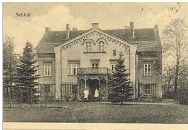
Fot. 30. Dwór w Mileszynie ok. 1910 r.