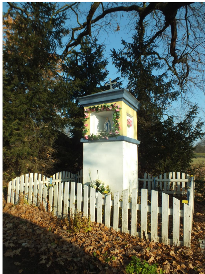
Fot. 6. Kaplica w Borkowie