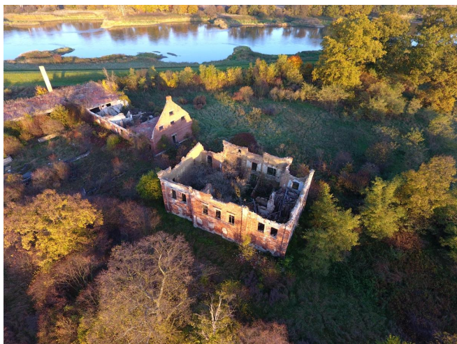
Fot. 29. Ruina dworu w Mileszynie