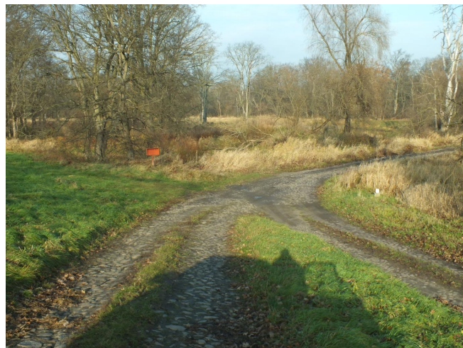
Fot. 24. Golkowice - brukowana droga do dawnej przeprawy odrzańskiej i przystani