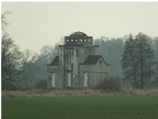
Fot. 41. Przepompownia w Leszkowicach