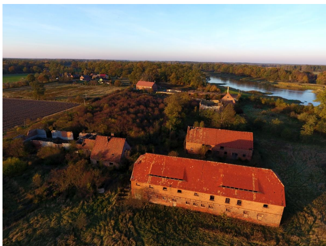
Fot. 27. Zespół dworski w Mieszynie