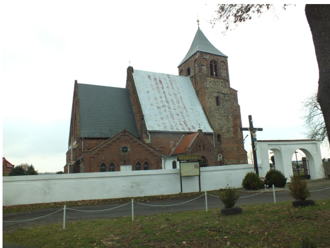
Fot. 31. Kościół w Piersnej