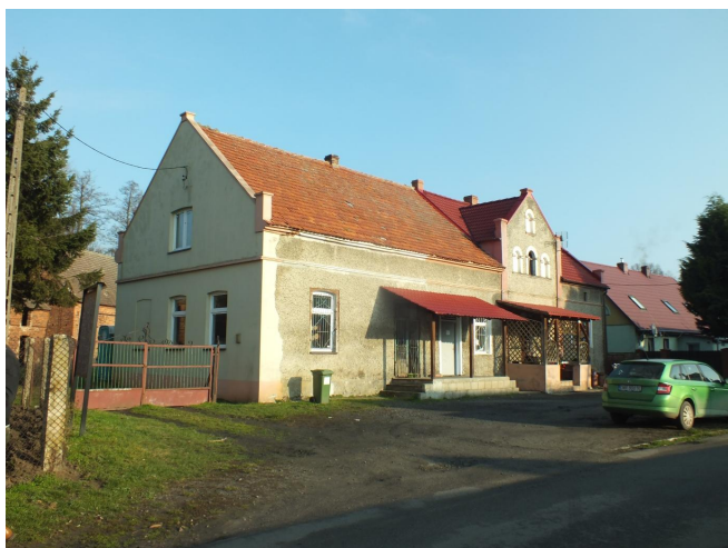
Fot. 15. Dawna gospoda w Drogłowicach