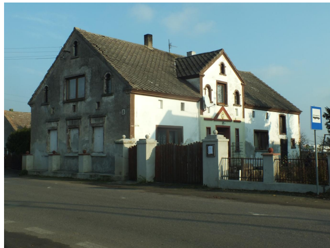
Fot. 2. Białoleka nr 3 - budynek mieszkalny