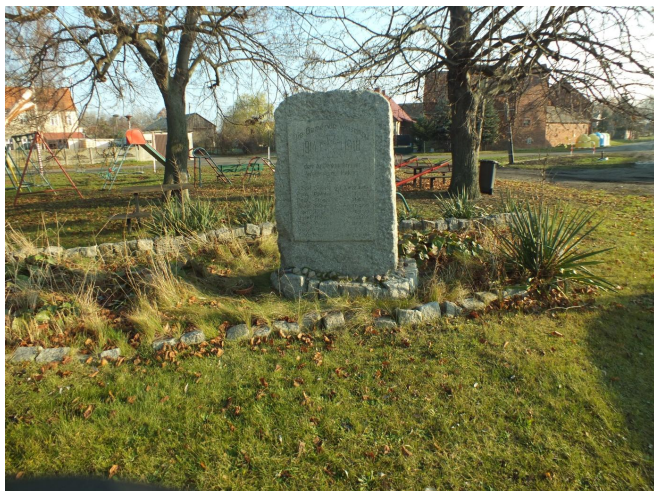
Fot. 39. Pomnik poległych w trakcie I wojny światowej w Wojszynie