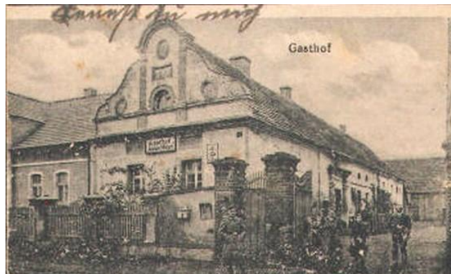
Fot. 38. Gospoda w Wojszynie - okres międzywojenny