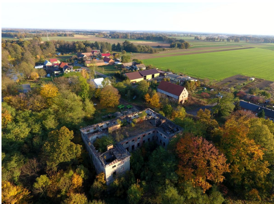
Fot. 17. Ruiny pałacu w Droglowicach w otoczeniu parku