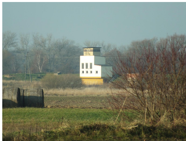
Fot. 8. Borków - przepompownia wody