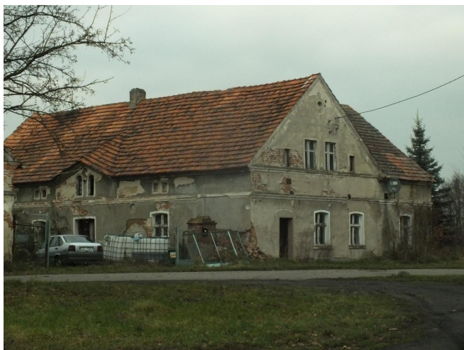
Fot. 25. Dawna gospoda w Leszkowicach