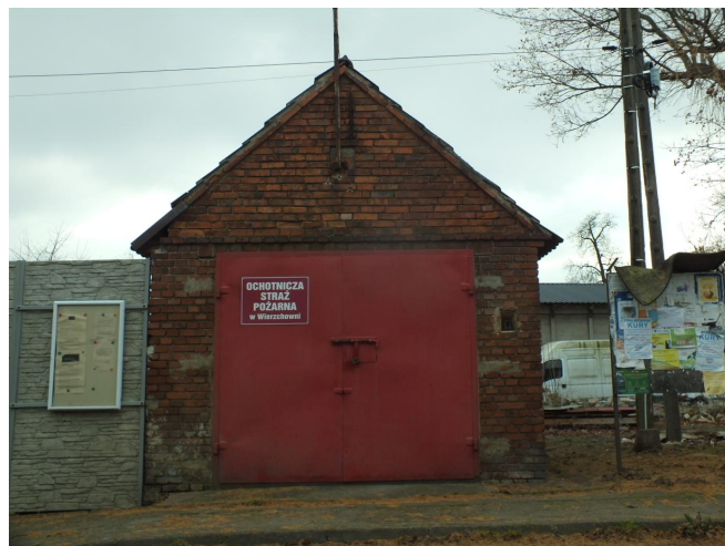
Fot. 34. Remiza strażacka w Wietszycach