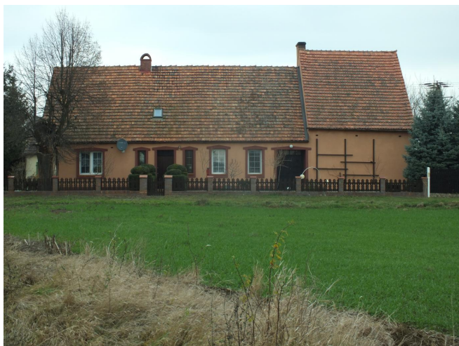
Fot. 33. Dawna szkoła w Wietszycach