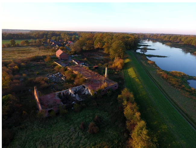
Fot. 28. Zespół dworski w Mieszynie - zrujnowany jeden z budynków gospodarczych, na drugim planie użytkowana oficyna