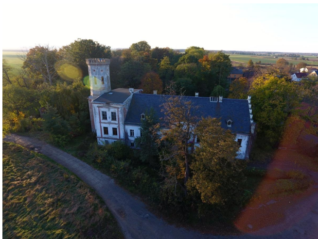
Fot. 13. Pałac w Białoleęce