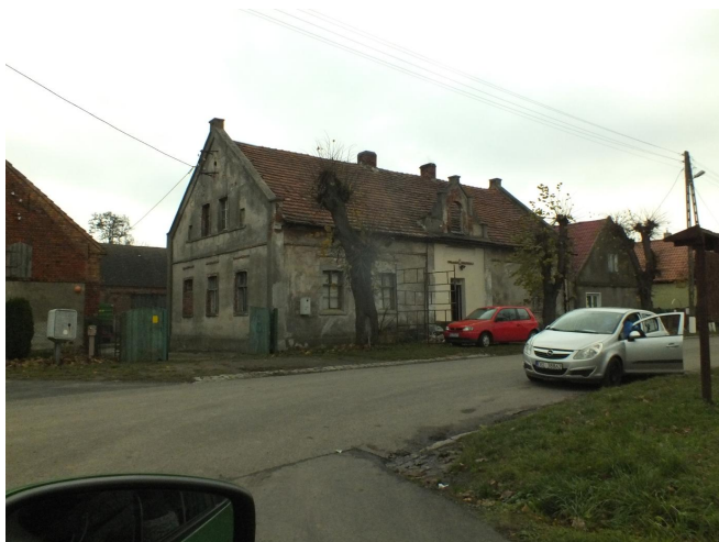
Fot. 11. Kotowice - dawna gospoda