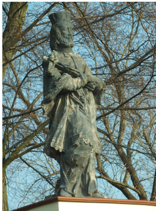
Fot. 22. Golkowice - figura Jana Nepomucena przy wjeździe do wioski