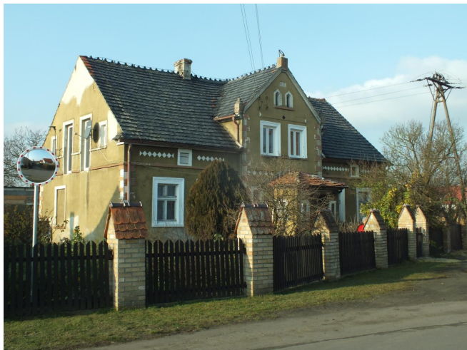
Fot. 1. Białoleka nr 28 - budynek mieszkalny z 1911 r.