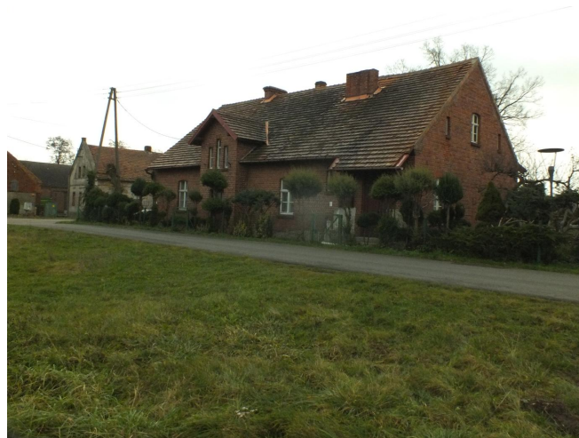
Fot.10. Kotowice - dawna szkoła