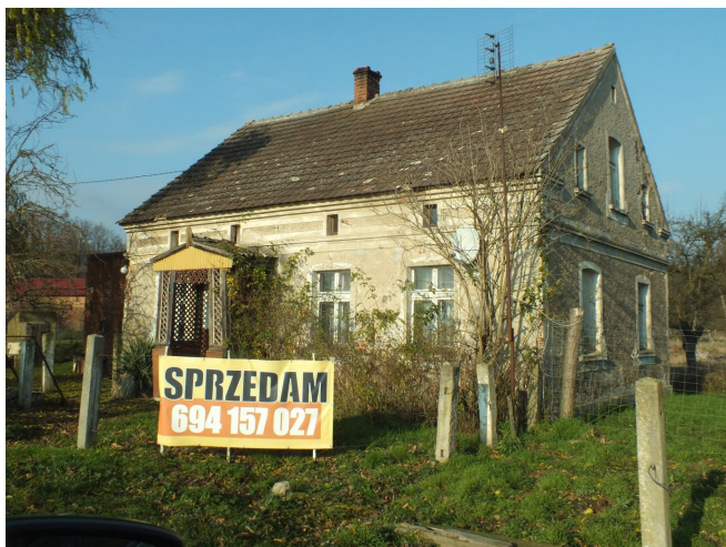
Fot. 9. Borków nr 35 - dom mieszkalny