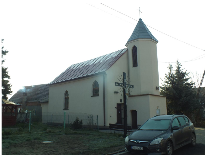
Fot. 35. Kaplica w Wojszynie