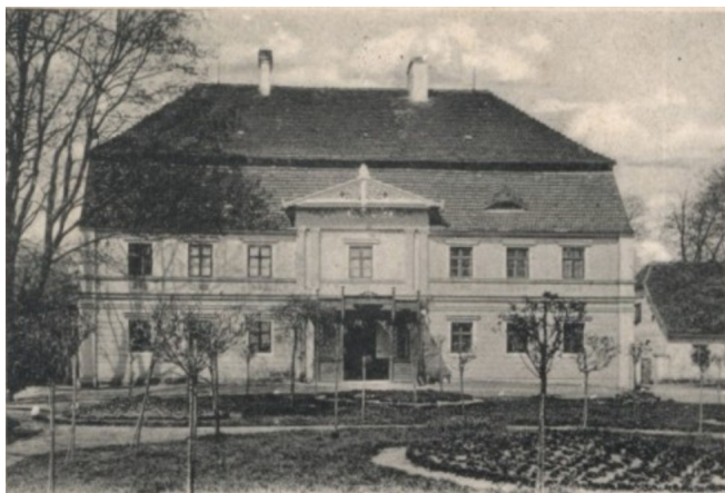
Fot. 21. Pęcław - nieistniejący dwór w 1 poł. XX w.; źródło: www.polska-slask.org