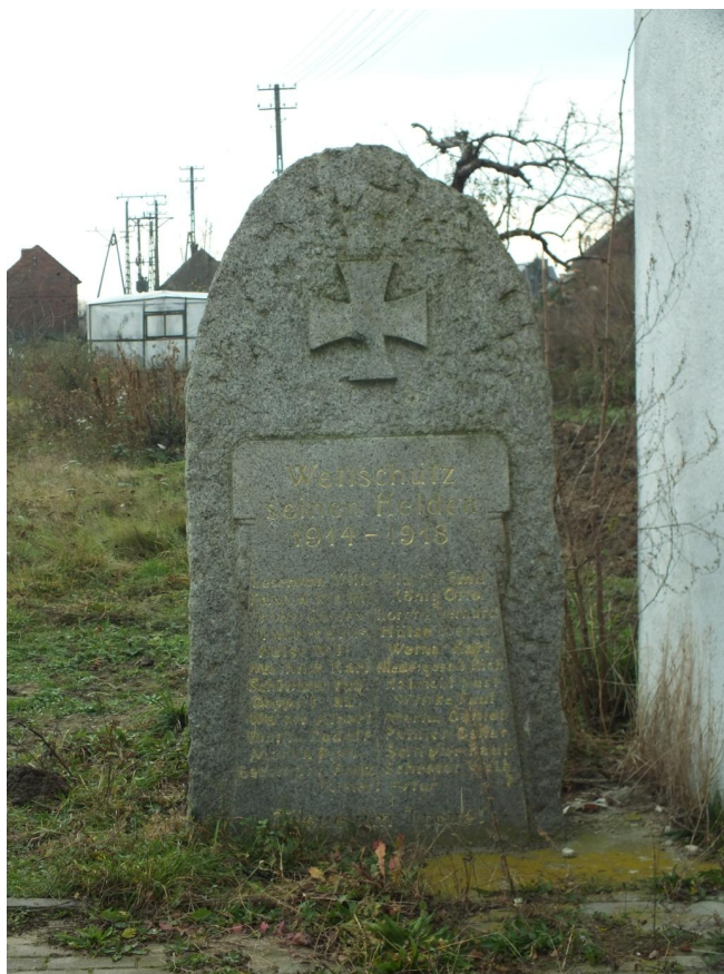
Fot. 32. Pomnik poległym w trakcie I wojny światowej w Wietszychy