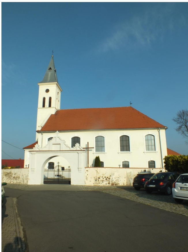
Fot. 5. Białotłęka - kościół