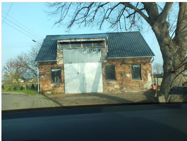
Fot. 7. Białotłęka - kuźnia po przebudowie