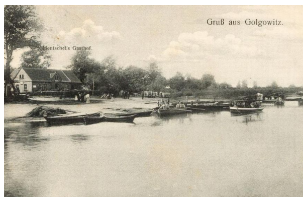
Gruß aus Gólkowitz.