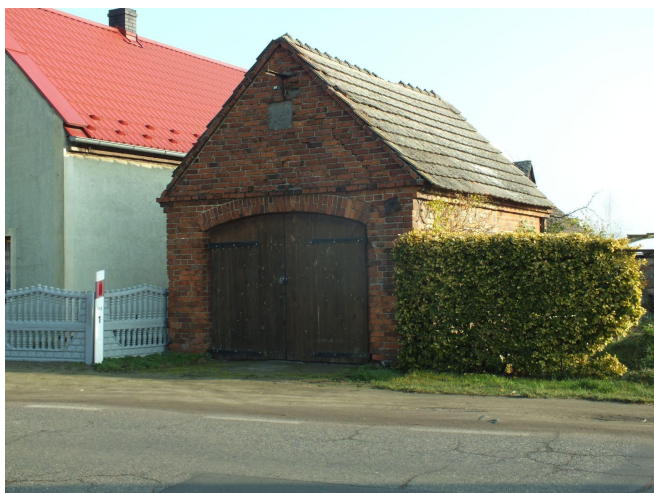
Fot. 3. Białoleka - remiza