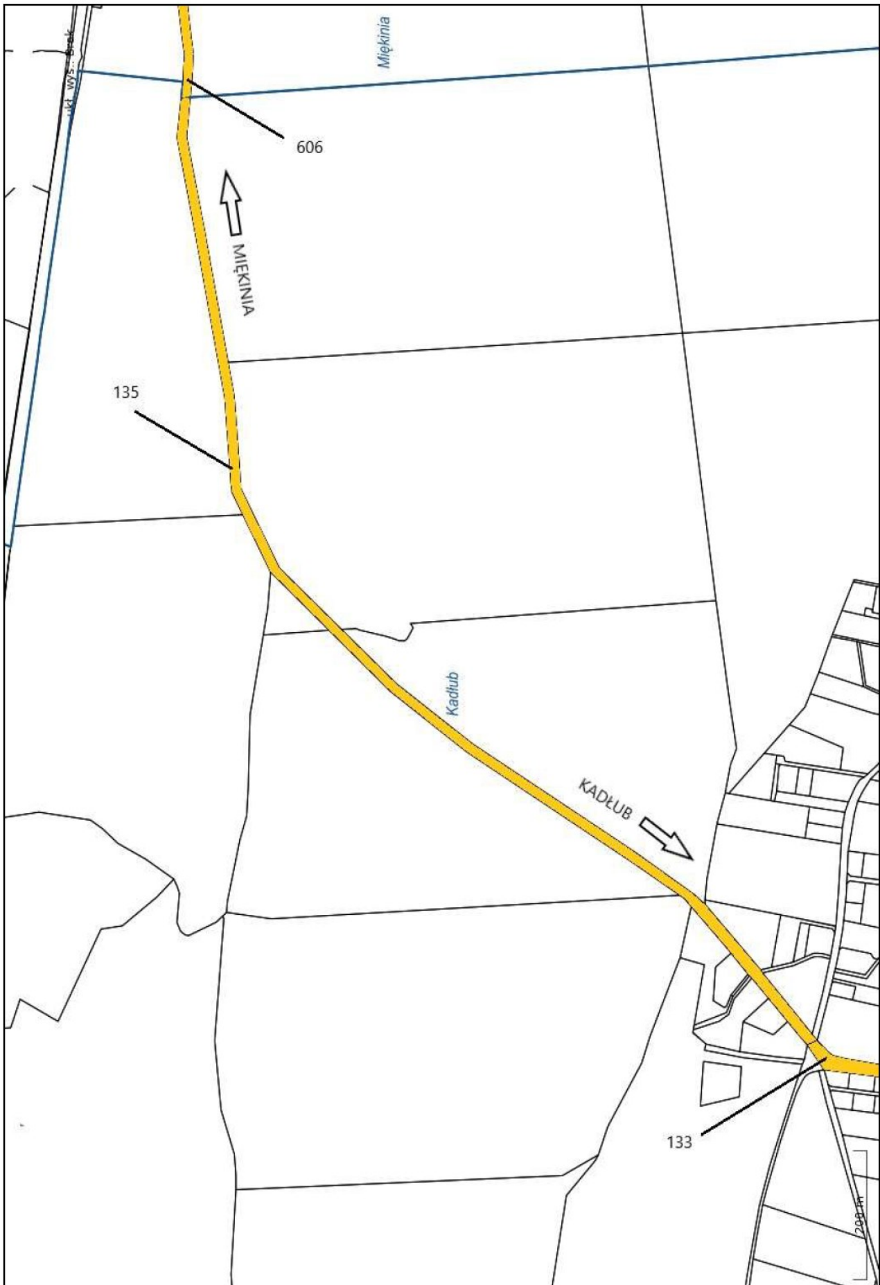
Załącznik nr 2 do Uchwały Rady Gminy Miękinia Nr XLVI/540/22 z dnia 30 września 2022

Załącznik nr 2 do uchwały nr XLVI/540/22 Rady Gminy Miękinia z dnia 30 września 2022 r.