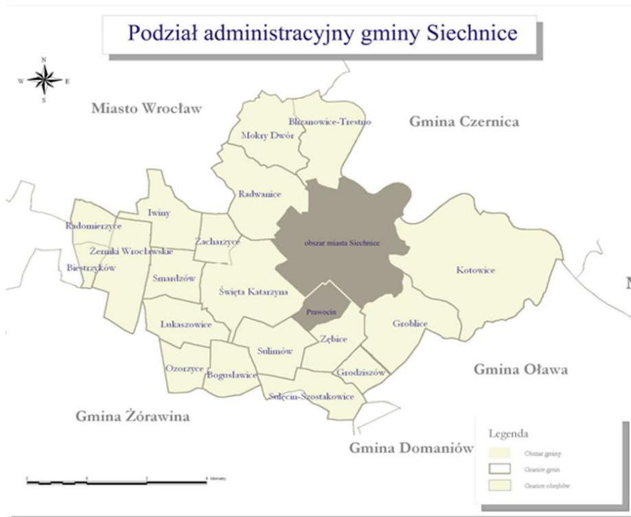
Rysunek 1 Podział administracyjny Gminy Siechnice