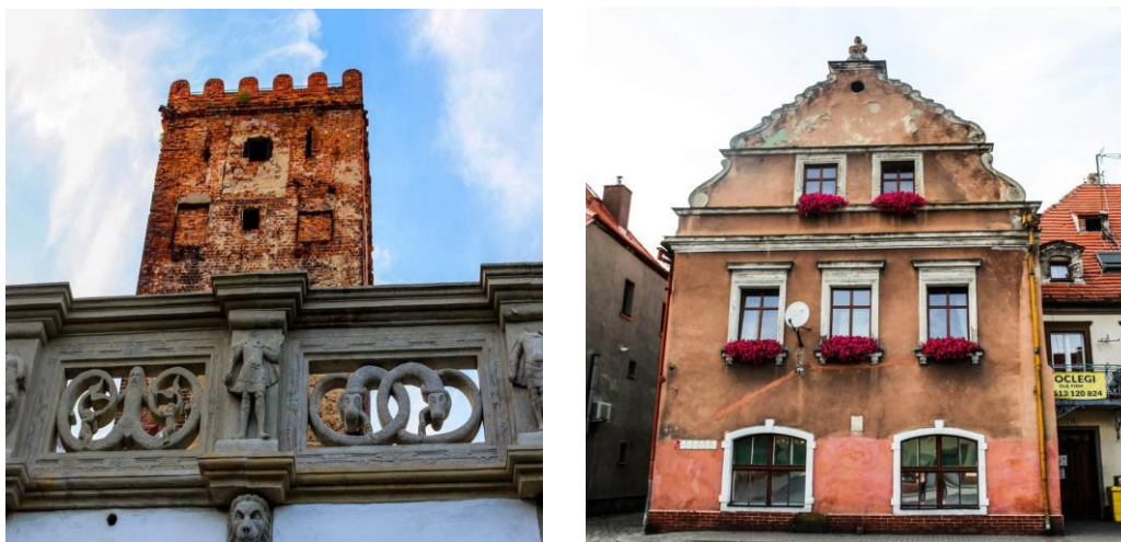
Fot. Fragment prochowickiego zamku, najstarsza kamienica w Prochowicach (zbudowana w 1588 roku)

Przebieg szlaku: Prochowice – Legnica – Krajów – Jawor – rezerwat „Wilcza Góra” – Chojnów – Rokitki – Chocianów – Przemkowski Park Krajobrazowy” – Głogów.