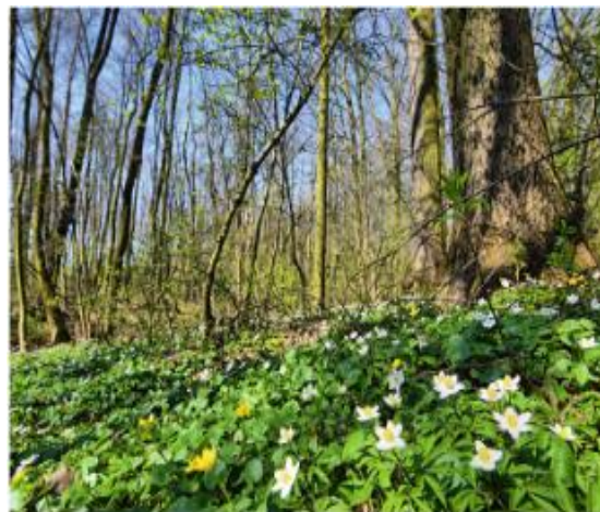
Fot. Rezerwat przyrody Błyszcz

Na terenie powiatu występują dwa obszary krajobrazu chronionego: