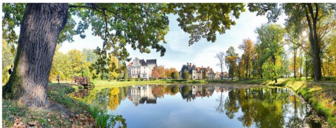
Fot. Zespół pałacowy „Prząśnik” w Brenniku