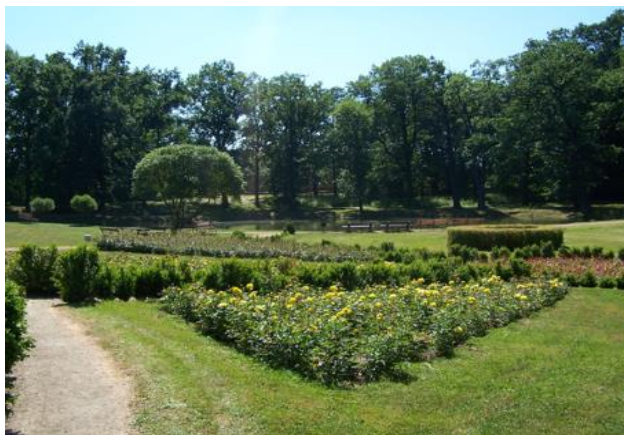
Fot. Park przy zespole pałacowym w Brenniku

Od zachodu do dawnego sadu przylegała niegdyś winnica i ogródek japoński, założone zapewne u schyłku XIX w., wraz z budową nowego pałacu. Trzy tarasy ziemne ujęte zostały ceglany, otynkowanym murem o formie wycinka koła. Poniżej winnicy, na skarpie, na wprost elewacji północnej pałacu powstał niewielki ogródek japoński. Został on oddzielony od rezydencji potokiem płynącym w głębokim umocnionym kamieniami korycie, nad którym rosną stare dęby. Z dawnego ogrodu japońskiego zachowały się pozostałości kamiennych urządzeń oraz niewielka sadzawka. Od zachodu i północy wzdłuż terenu winnicy biegła niegdyś droga, umożliwiająca bezpośrednio dojście do rezydencji przez bramę umieszczoną w kamiennym murze. Zapewne bezpośrednio przed II wojną światową północno-zachodni fragment głównego rowu melioracyjnego posłużył do wykonania zespołu stawów hodowlanych. Założono też nową drogę, biegnącą między rowem a potokiem, stanowiącą obecny dojazd do rezydencji prowadzący od północnego zachodu.