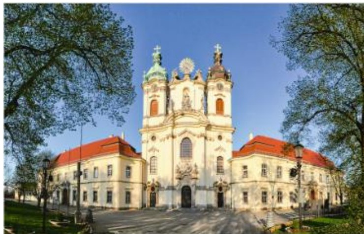
Fot. Widok od frontu na pobenedyktyński zespół klasztorny

Historia klasztoru i Kościoła pw. św. Jadwigi związana jest z tragicznymi wydarzeniami, które miały miejsce dnia 9 kwietnia 1241 roku, kiedy to na Dobrym Polu w walce z Tatarami poległ Henryk II Pobożny. W miejscu, gdzie według legendy św. Jadwiga odnalazła ciało swego syna wzniesiono ufundowaną przez nią kaplicę, przebudowaną następnie w gotycki kościół z łamanego kamienia, w którym od roku 1961 do chwili obecnej mieści się Muzeum Bitwy Legnickiej. Opiekę nad wzniesionym w tym miejscu kościołem powierzono, sprowadzonym z czeskich Opatowic, przez żonę Henryka II Annę, benedyktynom.