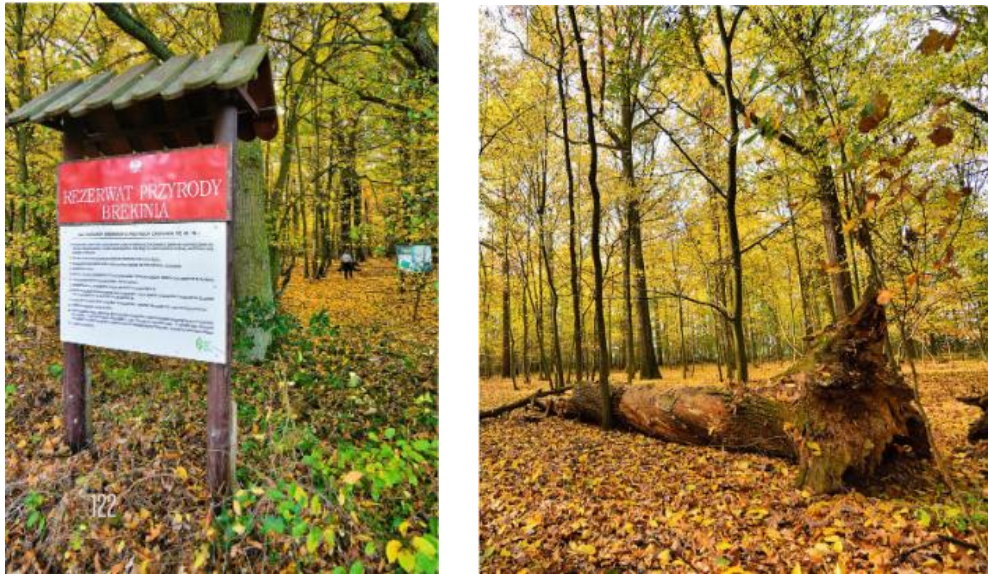
Fot. Rezerwat przyrody Brekinia

3. Łęg Korea o pow. 79,29 ha obejmujący leśnictwo Mierzowice w gminie Prochowice. Jest to obszar leśno-bagienny z mozaiką łągu jesionowo-wiązowego z grądem; łągiem wierzbowo-topolowym i olsem porzeczkowym. Ze zbiorowisk nieleśnych wymienić należy: zespół z arcydzięglem nadbrzeżnym; zespół z rdestami i uczepem; zespół osoki aloesowej i zabiścieku pływającego; zespół z rzęsą mniejszą i spirodelą; łąka wyczyńcowa i szuwar trzcinowy. Celem ochrony jest zachowanie lasów łągowych z bogatą ornitofauną.