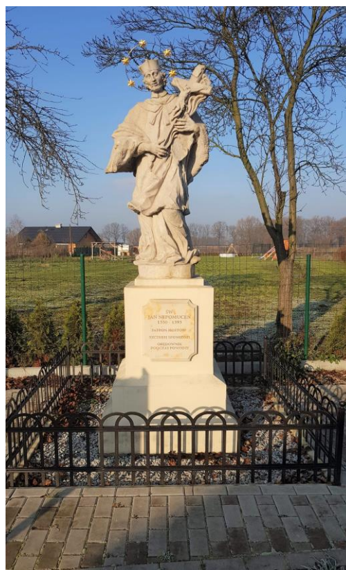
Fot. Odrestaurowana figura św. Jana Nepomucena – rok 2018 i rok 2020

Barokowa wolnostojąca rzeźba figuralna o wysokości 160 cm ustawiona jest na murowanym i otynkowanym, prostokątnym postumencie z cokołem o sfazowanych ścianach. Rzeźba powstała najprawdopodobniej na początku XVIII wieku i została wykuta z piaskowca. Nie są dokładnie znane jej wczesne dzieje. Dostępna dokumentacja dotycząca historii wsi Pątnówek i okolic niestety nie pozwala na ustalenie twórcy dzieła ani fundatora figury. Nie ma również pewności czy obecne miejsce ekspozycji figury jest pierwotne, czy może została przeniesiona z innej lokalizacji. Rzeźby nepomuków ustawiano m.in. na mostach