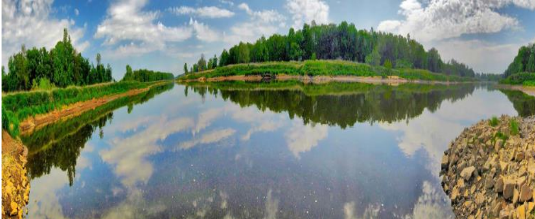
Fot. Dolina Odry

2. Dolina Odry o pow.1270 ha (gmina Prochowice). Dolina powstała jako wynik ruchów pionowych w młodszym plejstocenie. Zachowały się pozostałości pierwotnego brzegu rzeki w postaci resztek meandrów w podmokłej dolinie (starorzecze), oddalone od koryta oraz fragmentów naturalnych lasów łągowych z drzewostanem dębowo-grabowym. Występuje tu bogata fauna, w tym: czapla siwa, bocian czarny, kania rdzawa i czarna pustułka.