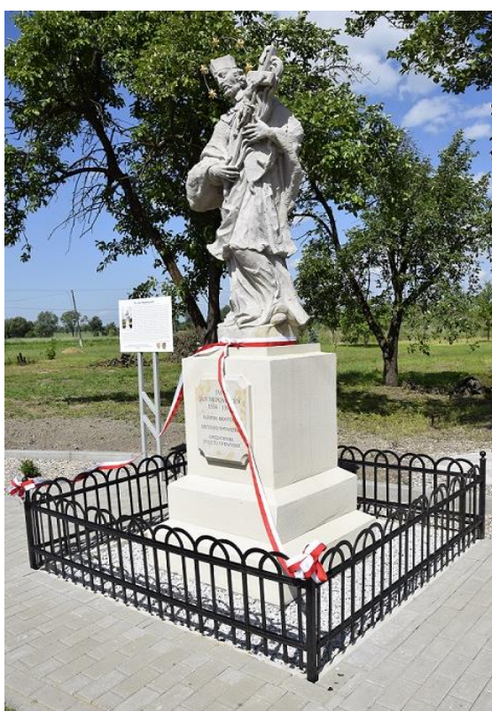
Figura przedstawiająca postać Św. Jana Nepomucena stoi przy drodze w centrum niewielkiej wsi Pątnówek w gminie Miłkowice. Zabytek został wpisany do rejestru zabytków ruchomych decyzją nr B/2102 z dnia 25 marca 2010 roku Dolnośląskiego Wojewódzkiego Konserwatora Zabytków we Wrocławiu. Rzeźba przydrożna św. Jana Nepomucena jest przykładem rzeźby kultowej z początku XVIII wieku i jako dzieło sztuki rzeźbiarskiej stanowi świadectwo minionej epoki.

swoich obowiązków, parafianie w ramach przypomnienia, urządzali figurce zdjętej z kapliczki kąpiel lub obwozili łodzią po rzece czy jeziorze.