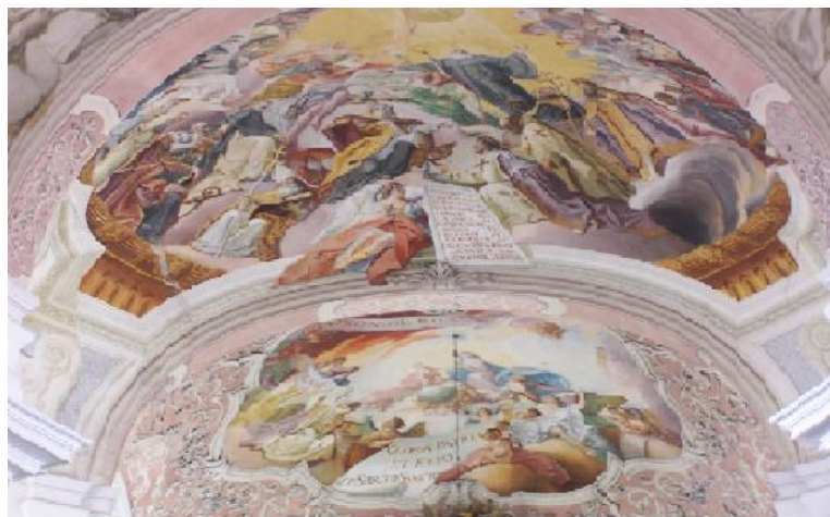
Fot. Sklepienie w Kościele Św. Jadwigi

Imponujące malarstwo iluzjonistyczne na sklepieniach wykonał w 1733 roku wybitny bawarski artysta Kosma Damian Asam, należący do najbardziej znanych w Europie twórców. Polichromie ilustrują, m. in. wprowadzenie chrześcijaństwa, odnalezienie relikwii Krzyża Świętego przez św. Helenę, pielgrzymki do Ziemi Świętej, triumfującego Chrystusa oraz Matkę Bożą modlącą się do zakonników.