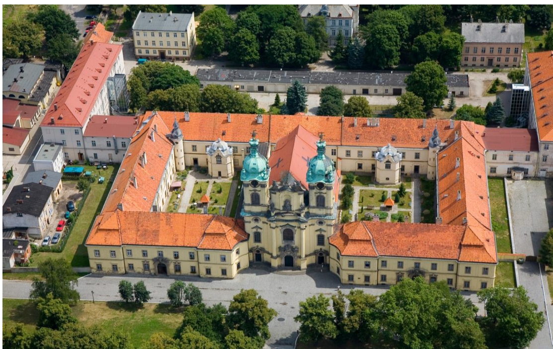
Fot. Widok z lotu ptaka na zespół klasztorny

strony południowej oba skrzydła łączy niski mur z bramką na linii zakrystii, tworząc dziedziniec południowy. Dziedzińce dostępne są przez dwie przelotowe sienie, znajdujące się w osiach głównych zachodnich skrzydeł klasztoru oraz przez skrzydło wschodnie. Do wschodniego skrzydła klasztoru przystawione są za pośrednictwem łączników wyższe skrzydła koszarowe. W północno – zachodnich i południowo-zachodnich narożnikach założenia utworzyły wewnętrzne dziedzińce ograniczone od zachodu masywnym murem. Po północnej stronie ulicy Benedyktynów znajduje się kompleks zabudowań gospodarczych dawnego ogrodnictwa z kotłownią i dwoma budynkami mieszkalnymi. Pierwotnie założenie charakteryzowała osiowość i symetria, niestety współcześnie została zakłócona wtrętami w rodzaju budynku stolarni, usytuowanego w zakolu muru ogrodowego, wiaty i długiego budynku gospodarczego w centrum. Bezpośrednio przy południowym odcinku oryginalnego muru ogrodu wybudowano około 1887 roku lodownię. Obok niej w murze istniała furka, po której zostały filary zwieńczone piaskowcowymi kołpakami. Dawniej całość ograniczało ogrodzenie, które od zachodu sięgało aż do chodnika ulicznego.