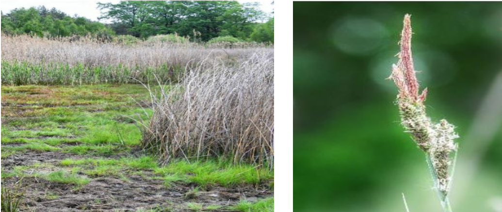
Fot. Torfowisko Szczytniki, turzyca Hartmana

2. Torfowisko w okolicach Miłkowic (gmina Miłkowice) - 1,67 ha. Użytek ekologiczny położony w pobliżu doliny Czarnej Wody - jest to śródpolne jeziorko otoczone szeroką strefą trzciny. Ze względu na małe zacienienie lustra wody charakterystyczna jest duża ilość grążela żółtego. Poza tym występuje tu roślinność wodna: rzęsa wodna, rzęsa trójrowkowa, spirodela, pływacz zwyczajny, rogatek krótkoszyjkowy, żabiściek pływający. W strefie roślin wynurzonych rosną płatami: oczeret jeziorny, pałka szerokolistna z narecznicą błotną i domieszką innych gatunków bagiennych. Największą powierzchnię zajmuje zwarty jednogatunkowy łąn dorodnej trzciny.