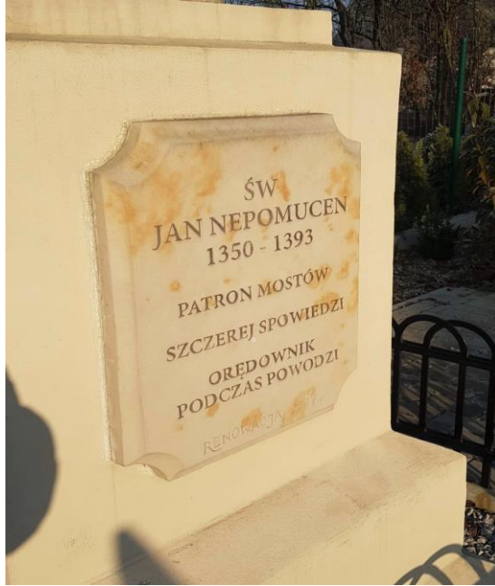
Fot. Tablica wkomponowana w frontową część postumentu

tablicę z napisem o treści: „Św. Jan Nepomucen, 1350 – 1393, Patron mostów, szczerzej spowiedzi, orędownik podczas powodzi”. Teren wokół zagospodarowano, tj. zamontowano metalową balustradę, a podłoże wokół pomnika obsypano gruboziarnistym żwirem.