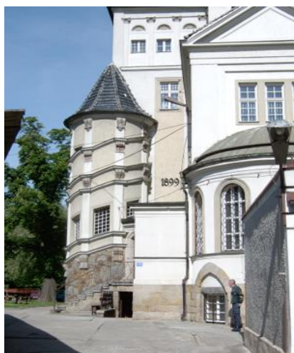
Fot. Budynek pałacu

Data umieszczona na jednej ze ścian obecnego pałacu wskazuje na to, że powstał on w roku 1899, prawdopodobnie na miejscu starszej rezydencji, przy czym w latach dwudziestych naszego stulecia (1928 rok) poddano go modernizacji. Monumentalny pałac wraz z zabudowaniami dla służby łączy w sobie kilka stylów architektonicznych. Obecnie jest to monumentalna trzykondygnacyjna, a partiami czterokondygnacyjna budowla założona na planie zbliżonym do litery L, z licznymi tarasami, ryzalitami i wykuszami po bokach. Pałacowi, który kryje wielospadowy dach, nadano eklektyczną formę złożoną z elementów neorenesansu, neobaroku i neorokoka. W tym stylu utrzymane są wnętrza, między innymi okazała sala rycerska o sklepieniu wspartym na granitowych kolumnach, ozdobny kominek oraz pseudorokokowa kaplica. Neobarokowe formy zdecydowanie dominują na zewnątrz budynku, w elewacjach przybranych pilastrami wielkiego porządku i w monumentalnym portalu głównym z herbem Zedlitzów i datą 1928 w zwieńczeniu. Na szczególną uwagę zasługuje też XX-wieczny wystrój rzeźbiarski zdobiący pałac z wizerunkami Św. Jerzego i Henryka Pobożnego.