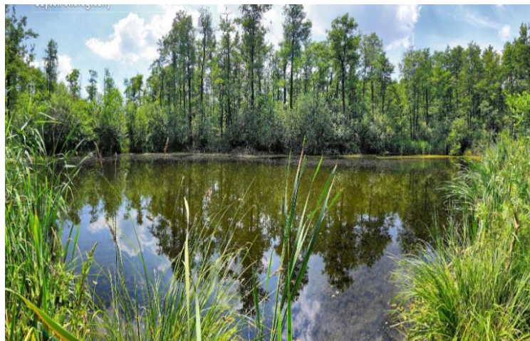
Fot. Torfowisko w okolicach Miłkowic

2. Torfowisko w okolicach Miłkowic (gmina Miłkowice) - 1,67 ha. Użytek ekologiczny położony w pobliżu doliny Czarnej Wody - jest to śródpolne jeziorko otoczone szeroką strefą trzciny. Ze względu na małe zacienienie lustra wody charakterystyczna jest duża ilość grążela żółtego. Poza tym występuje tu roślinność wodna: rzęsa wodna, rzęsa trójrowkowa, spirodela, pływacz zwyczajny, rogatek krótkoszyjkowy, żabiściek pływający. W strefie roślin wynurzonych rosną płatami: oczeret jeziorny, pałka szerokolistna z narecznicą błotną i domieszką innych gatunków bagiennych. Największą powierzchnię zajmuje zwarty jednogatunkowy łąn dorodnej trzciny.