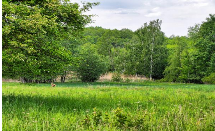
Fot. Korytarz ekologiczny Mierzowice

Pośród zarejestrowanych pomników przyrody występują również: klony, wiązy, buk i olsza czarna, cisy, świerki, sosny, platany i inne. Przeważnie drzewa pomnikowe znajdują się w objętych ochroną przyrody i ochroną zabytków licznych ogrodach, parkach, alejach zabytkowych, najczęściej związanych z dworami i pałacami.