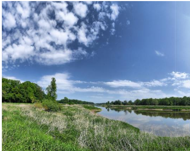
Fot. Rezerwat przyrody Łęg Korea

3. Łęg Korea o pow. 79,29 ha obejmujący leśnictwo Mierzowice w gminie Prochowice. Jest to obszar leśno-bagienny z mozaiką łągu jesionowo-wiązowego z grądem; łągiem wierzbowo-topolowym i olsem porzeczkowym. Ze zbiorowisk nieleśnych wymienić należy: zespół z arcydzięglem nadbrzeżnym; zespół z rdestami i uczepem; zespół osoki aloesowej i zabiścieku pływającego; zespół z rzęsą mniejszą i spirodelą; łąka wyczyńcowa i szuwar trzcinowy. Celem ochrony jest zachowanie lasów łągowych z bogatą ornitofauną.