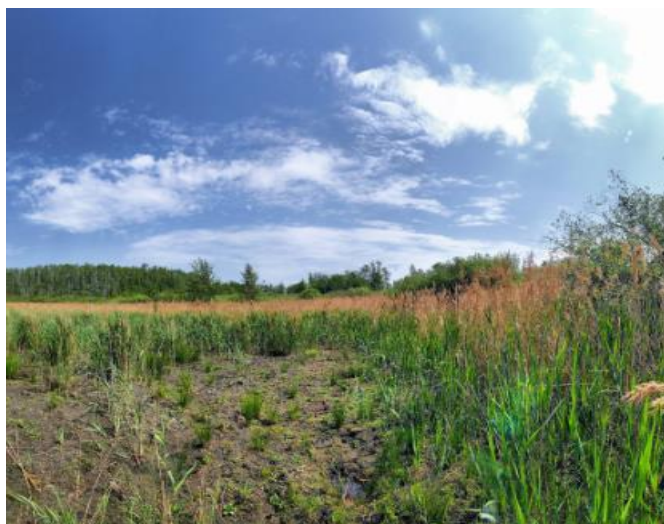
Fot. Rezerwat przyrody Torfowisko kunickie

1. Torfowisko Kunickie o pow. 11,83 ha w gminie Kunice. W skład rezerwatu wchodzi obszary leśne i zabagnione, odznaczające się dużą różnorodnością zespołów roślinnych (łącznie 21 zespołów), szczególnie gdy weźmie się pod uwagę niewielką powierzchnię tego obiektu. Stwierdzono tutaj występowanie 558 taksonów roślin, a wśród nich 267 należy do glonów, 32 do mchów, 6 do paprotników i 253 do roślin okrytonasiennych. Złóża torfu i osadów jeziornych stanowią cenne archiwum informacji dotyczących ostatniego glacjału i całego holocenu. Odczytać z nich można informacje dotyczące zmian roślinności dokonujących się na przestrzeni dziejów.