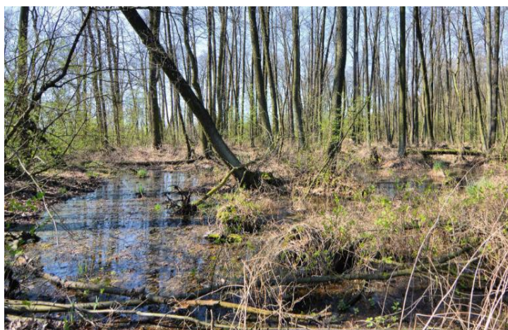
Fot. Rezerwat przyrody Ponikwa

służy ochronie kruszczyka połabskiego oraz licznych źródlisk, które zasilają w wodę „poprzez strumienie”, rosnący u podstawy zbocza las olszowy. Zarówno strumienie jak i las olszowy należą na Dolnym Śląsku do rzadkości. Występuje tu 7 gatunków roślin chronionych - oprócz kruszczyka występuje pierwiosnka wyniosła, kopytnik pospolity, kruszyna zwyczajna, kalina kolorowa i konwalia majowa. Występują tu również 34 gatunki mchów. Z awifauny stwierdzono gnieźdzenie się trzech gatunków ptaków, których egzystencja jest zagrożona w całej Europie. Są to: dzięcioł czarny, dzięcioł średni i ortolan. Gnieździ się tu też siniak, myszołów, puszczyk i grzywacz.