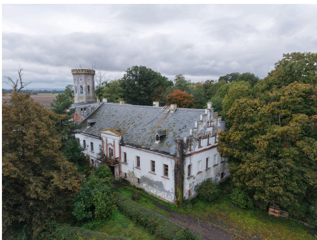
011. Pałac w Białoleźce, elewacja wschodnia