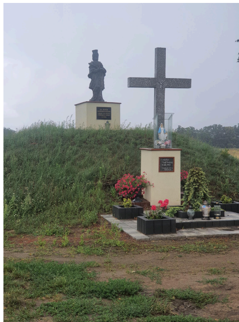
028. Golkowice - figura Jana Nepomucena przy wjeździe do wioski, na pierwszym planie krzyż