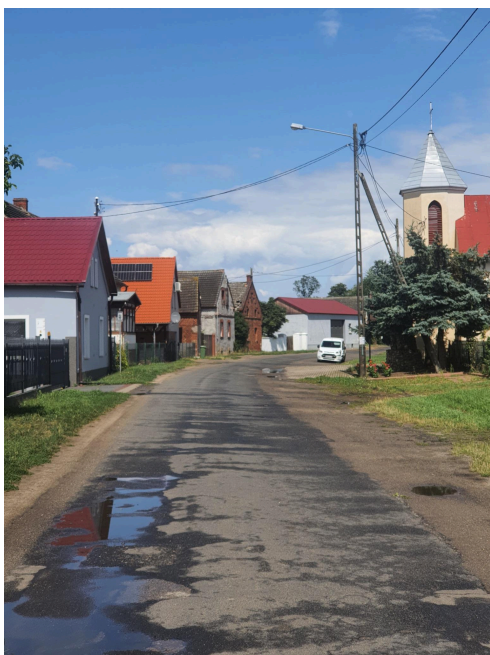
049. Wojszyn, układ ruralistyczny. Po prawej widoczna wieża kościelna