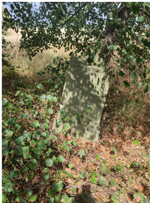
056. Wojszyn, jeden z lepiej zachowanych nagrobków na cmentarzu protestanckim