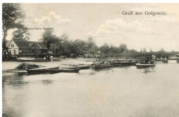
Grüß aus Golgowitz.

025. Borków - tzw. Rybaczówka - gospoda i restauracja nad Odrą (Borków 31), okres międzywojenny, źródło: polska-org.pl