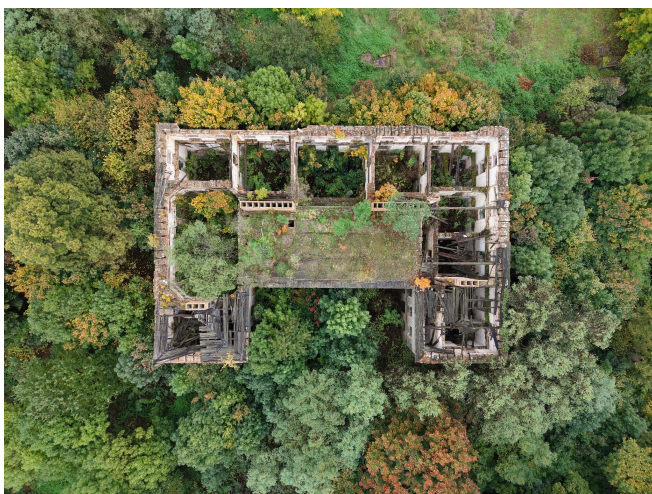
021. Droglowice, pałac z lotu ptaka