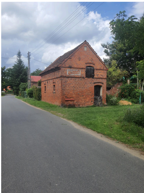
039. Mileszyn, jeden z typowych budynków gospodarczych we wsi