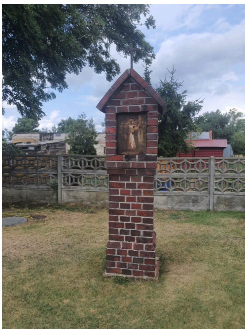
043. Piersna, droga krzyżowa wokół świątyni