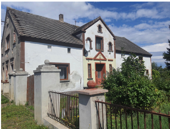
001. Białoleka nr 3 - budynek mieszkalny