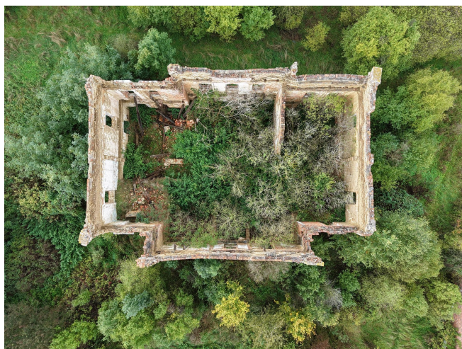
038. Ruina dworu w Mieszynie