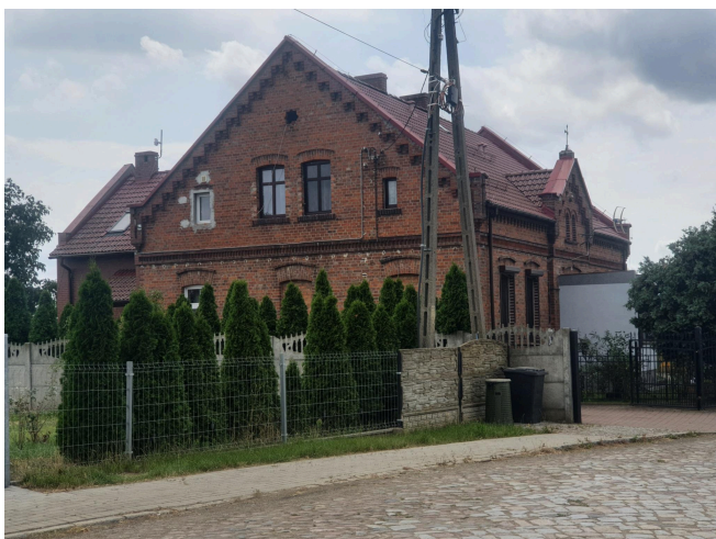
045. Piersna, parafia