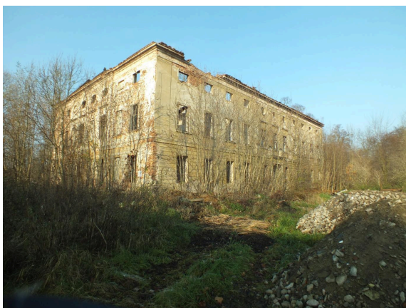
019. Ruiny pałacu w Droglowicach w roku 2022