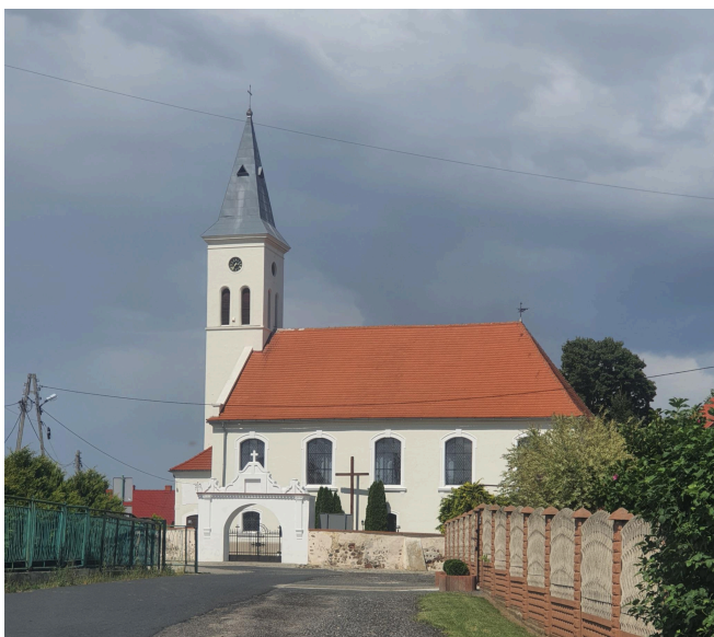
003. Białoleka - kościół