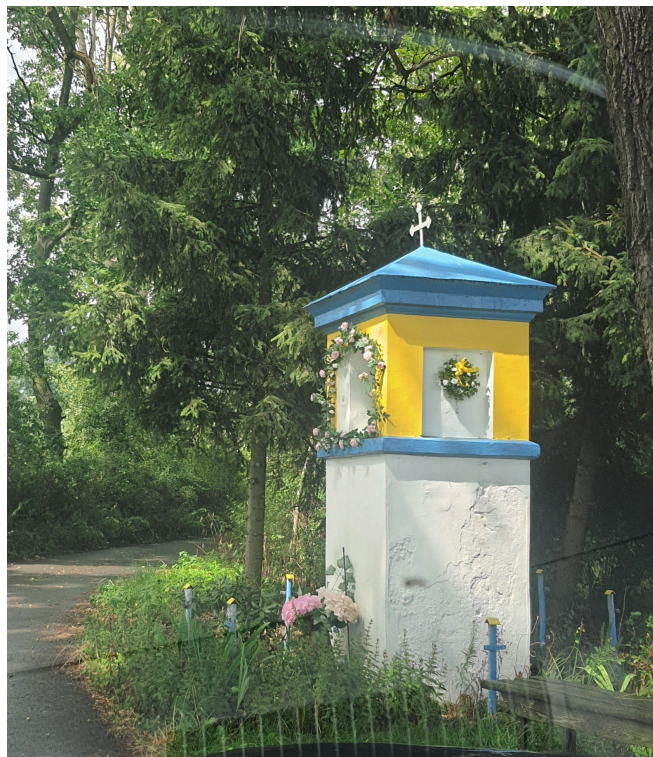
006. Kapliczka w Borkowie