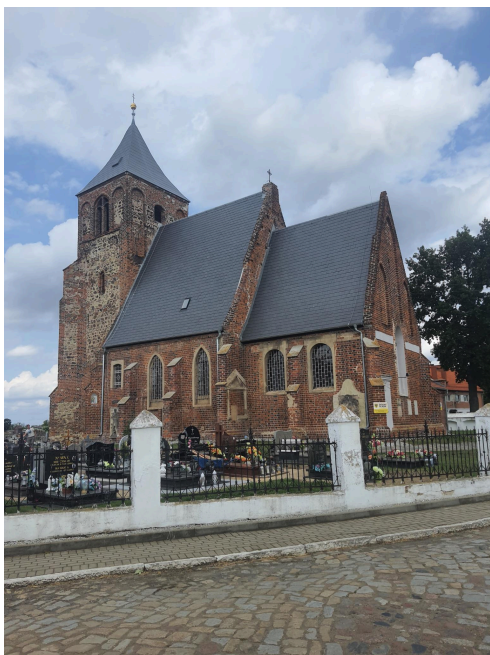
041. Kościół w Piersnej, elewacja południowa