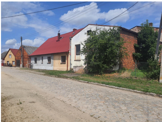
047. Wietszyce 16 i 17 - dawna gospoda.