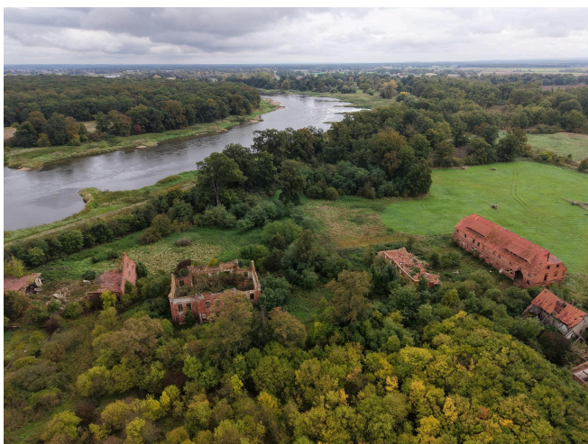
037. Zespół dworski w Mieszynie, po prawej widoczne jedyne zachowane zadaszenie budynku gospodarczego