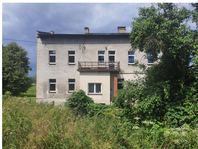
024. Borków - Rybaczówka dziś. Obiekt nie widnieje w ewidencji (z uwagi na zatarcie oryginalnych elementów), jednak jego bezpośrednie otoczenie to sztandarowy przykład historycznej krainy przepraw i łęgów odrzańskich.