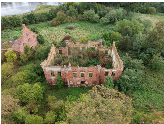
035. Ruina dworu w Mieszynie