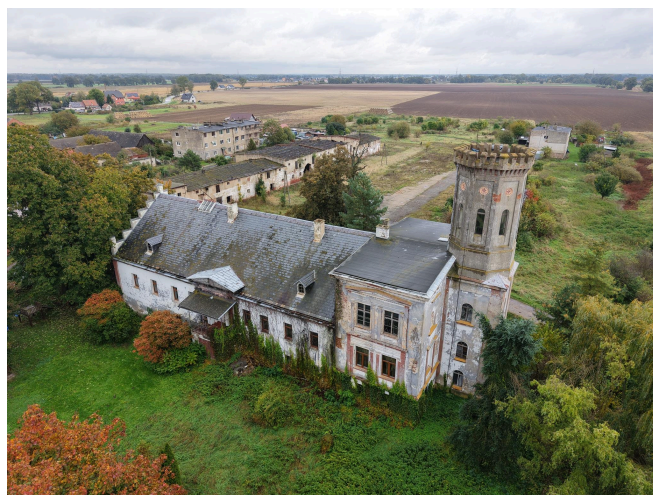
012. Pałac w Białoleźce, elewacja zachodnia