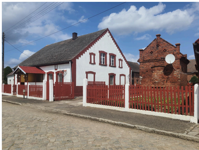
048. Wietszyce 14, budynek mieszkalny i gospodarczy