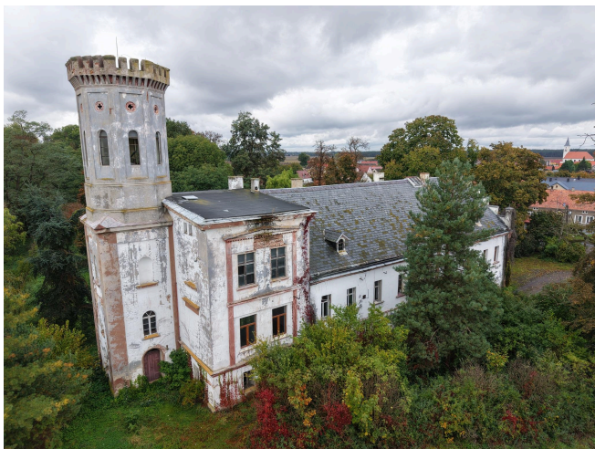
013. Pałac w Białoleścu