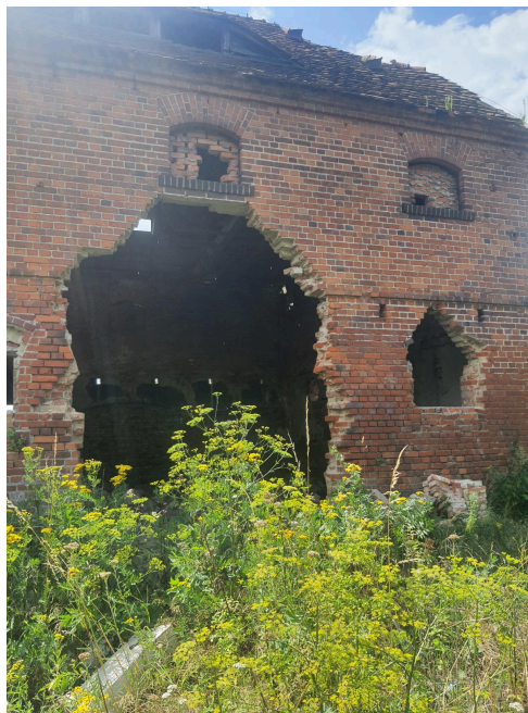
040. Mieszyn, otwór w elewacji północnej najlepiej zachowanego budynku gospodarczego w zespole dworskim