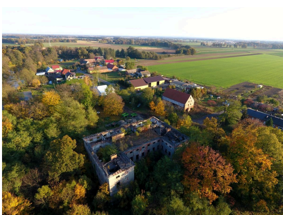
017. Ruiny pałacu w Droglowicach w otoczeniu parku w roku 2022