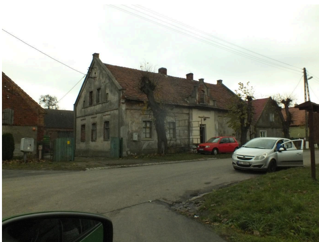
007. Kotowice, dawna gospoda, 2022