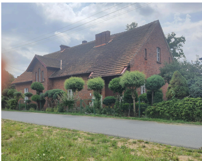
009. Kotowice - dawna szkoła