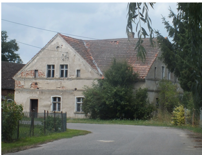
031. Dawna gospoda w Leszkowicach