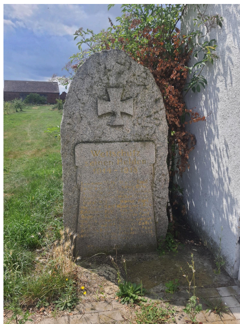
046. Pomnik poległym w trakcie I wojny światowej w Wietszycach