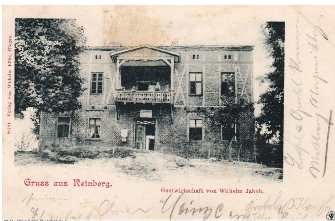
023. Borków - Rybaczówka, dawna gospoda Wilhelma Jakoba nad Odrą (ob. silnie przebudowany budynek mieszkalny w Borkowie nr 31), pocz. XX w.