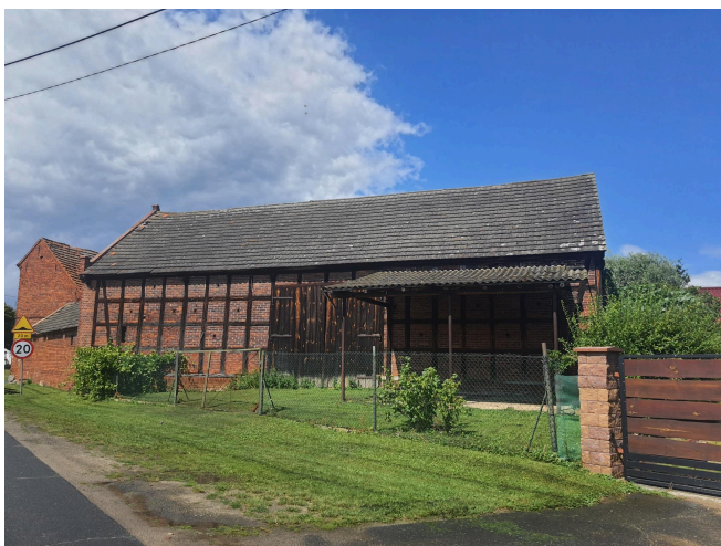
053. Budynek gospodarczy w Wojszynie