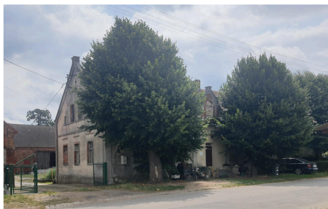
008. Kotowice - dawna gospoda