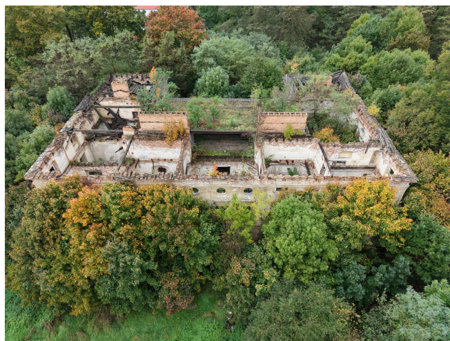
022. Droglowice, ruina pałacu