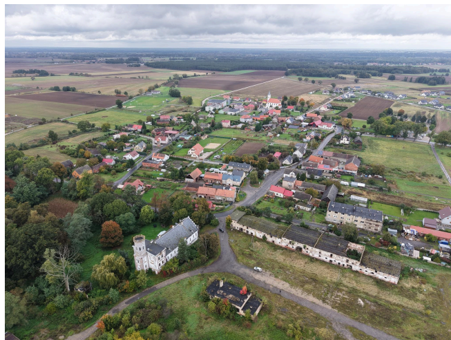
014. Białoleśca - zespół pałacowy z układem ruralistycznym wsi