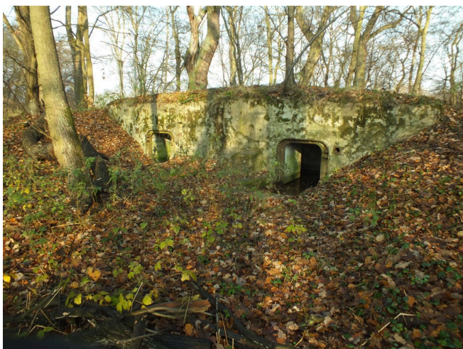
029. Golkowice - fragment umocnień Rygla Odry - jeden ze schronów, stan na 2022 r.