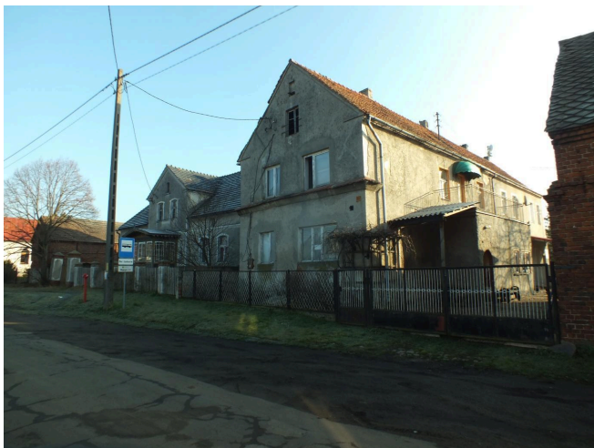
051. Dawna gospoda w Wojszynie, 2022 r.