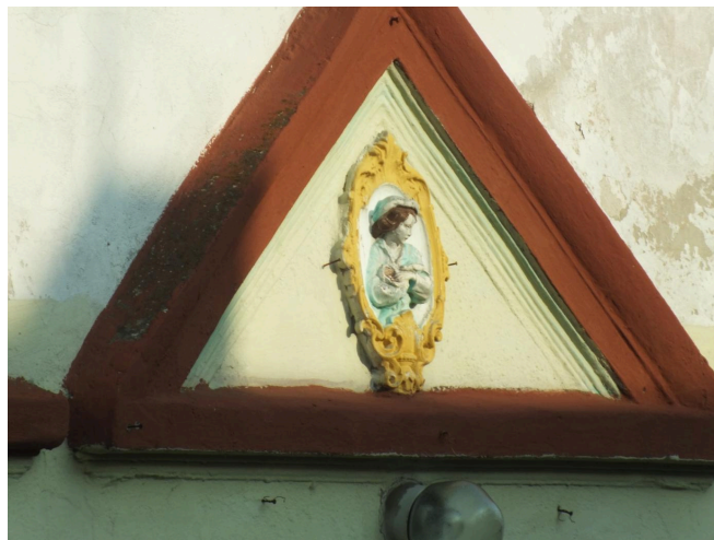
002. Białoleka nr 3 - medalion nad wejściem głównym budynku mieszkalnego, rok 2022