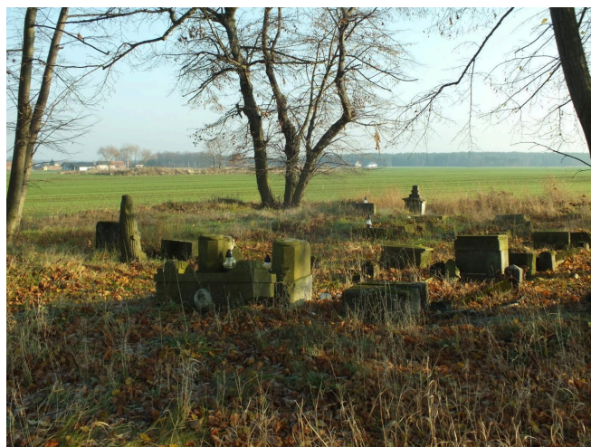
054. Cmentarz w Wojszynie, 2022 r.