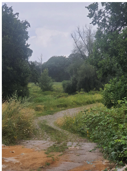
030. Golkowice - brukowana droga do dawnej przeprawy odrzańskiej i przystani