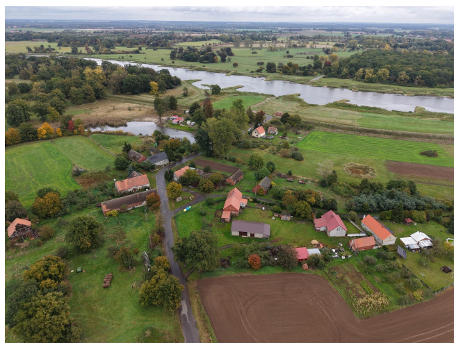
034. Leszkowice, układ ruralistyczny