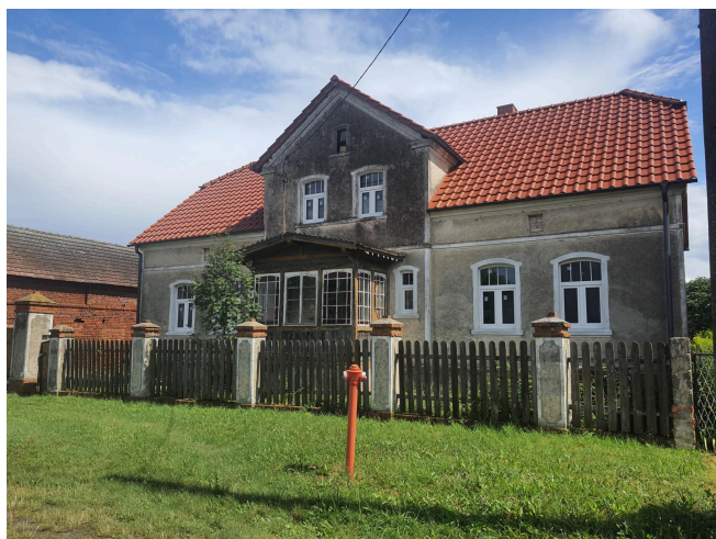
050. Wojszyn 4 - dom mieszkalny