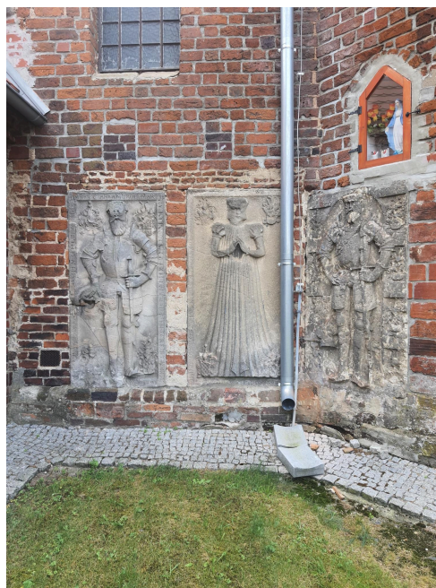
044. Piersna, jedne z najstarszych epitafiów, wmurowane w elewację kościoła