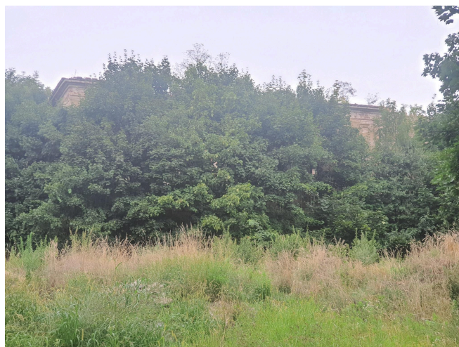
020. Zupełnie zarośnięte ruiny pałacu w Droglowicach, 2025 r.