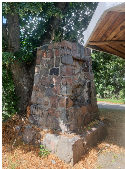
004. Pomnik poległych w trakcie I wojny światowej w Białolece (postument bez tablicy)