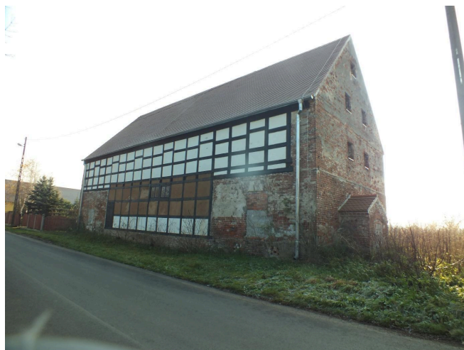
016. Częściowo wyremontowany spichlerz w Droglowicach, 2022