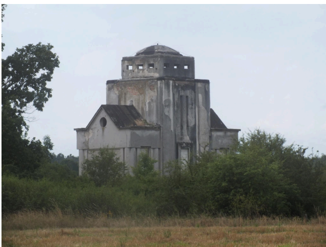
057. Leszkowice, przepompownia