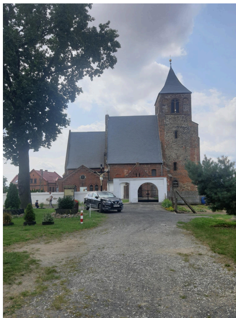
042. Kościół w Piersnej, elewacja północna