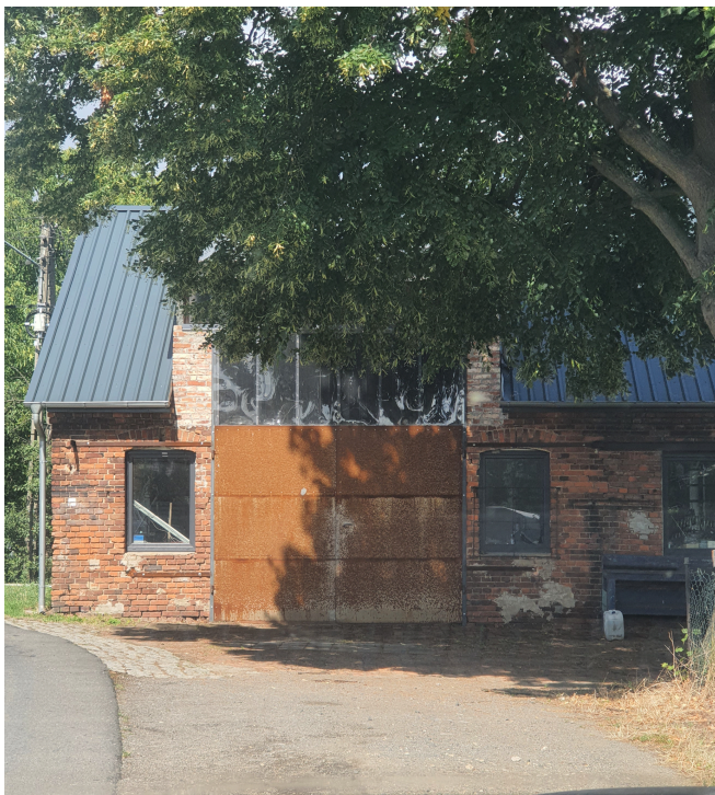
005. Białotłęka - kuźnia