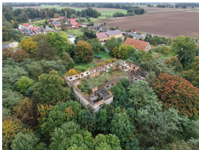
018. Ruiny pałacu w Droglowicach w 2025 r.