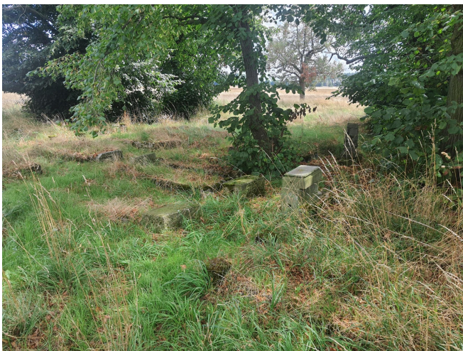
055. Wojszyn, zabytkowy cmentarz