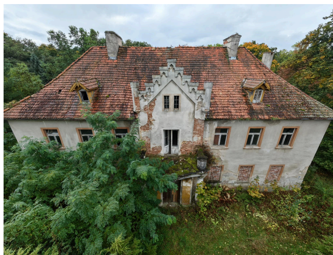
032. Dwór w Leszkowicach, fasada