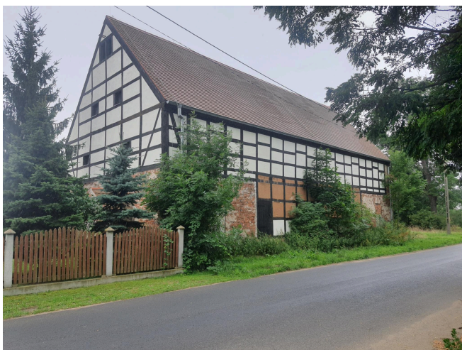
015. Spichlerz w Droglowicach