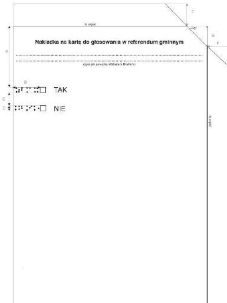
Nakładka na kartę formatu A4

Załącznik nr 4 do postanowienia Komisarza Wyborczego w Zielonej Górze z dnia 27 grudnia 2012 r.