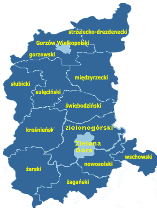
Powiat gorzowski na tle województwa lubuskiego

Obecny powiat gorzowski został utworzony z dniem 1 stycznia 1999 roku w ramach reformy administracyjnej. Powiat gorzowski leży w zachodniej części Polski, na północnym skraju województwa lubuskiego. Graniczy na północy z powiatem myśliborskim, na wschodzie z powiatami strzelecko-drezdeneckim i międzyrzeckim na południu z powiatem sulęcińskim, a na zachodzie z powiatem marchijsko - odrzańskim (Niemcy). Powierzchnia powiatu wynosi ogółem 1.217 km 2 , co stanowi 8,7 % powierzchni województwa lubuskiego. Zamieszkuje go ok. 70 tys. osób, z czego 39% w miastach. Gęstość zaludnienia wynosi 58 osób na km 2 . Siedzibą władz powiatowych jest miasto wojewódzkie Gorzów Wlkp., które nie wchodzi w skład powiatu gorzowskiego.