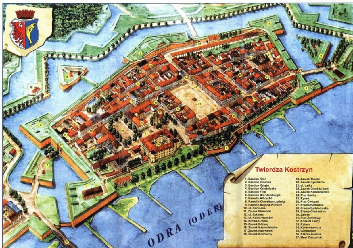
Widok Twierdzy Kostrzyn ok. 1921 r.

Nad prawym brzegiem Odry, w sąsiedztwie przekraczających ją mostów, rozciąga się dzielnica Kostrzyna nad Odrą - Stare Miasto. Na układ przestrzenny średniowiecznego grodu wpływ miały warunki topograficzne - wyjątkowo dogodne położenie u zbiegu dwóch dużych rzek, w sąsiedztwie okolicy bagiennej, usianej licznymi starorzeczami nadodrzańskimi. Na skrzyżowaniu lądowych oraz rzecznych szlaków komunikacyjnych i handlowych powstało miasto z regularną siatką ulic z wytyczonym w centrum rynkiem, które w pierwszej połowie XVI wieku zostało ujęte w ramy nowożytnych fortyfikacji ziemno-murowanych. Zamknięte w twierdzy miasto otrzymało zwartą urbanistycznie, gęstą zabudowę. Stare Miasto - Twierdza było wielokrotnie odbudowywane i przebudowywane. Na przestrzeni wieków zmieniała się architektura kościoła farnego i zamku. Unowocześniono i rozbudowano umocnienia twierdzy. Oddano do użytku miejski wodociąg, wybrukowano ulice, przeprowadzono linie tramwajowe - łączące starówkę z przedmieściami. W 1945 roku Stare Miasto - Twierdza przestało istnieć. W obecnej formie posiada status ruiny, która powoli jest odbudowywana.