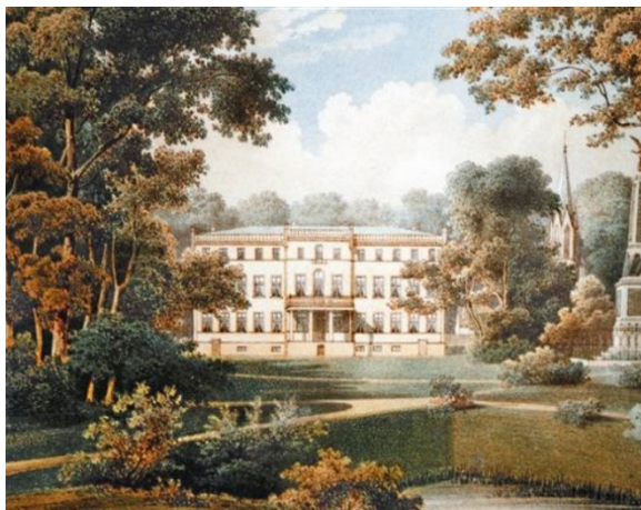
Pałac w Dąbroszynie ok. 1860 r.