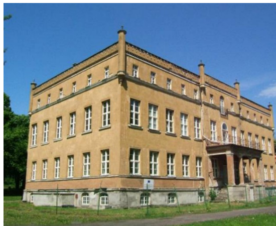
Pałac w Dąbroszynie stan obecny