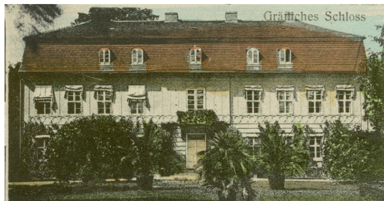
Pałac w Kamieniu Wielkim (gmina Witnica)

Ponadto zabytkami o najwyższym znaczeniu dla powiatu gorzowskiego są pałac i park pałacowy w Kamieniu Wielkim, które stanowią własność powiatu gorzowskiego a pozostają w trwałym zarządzie Domu Pomocy Społecznej w Kamieniu Wielkim – jednostki organizacyjnej powiatu.