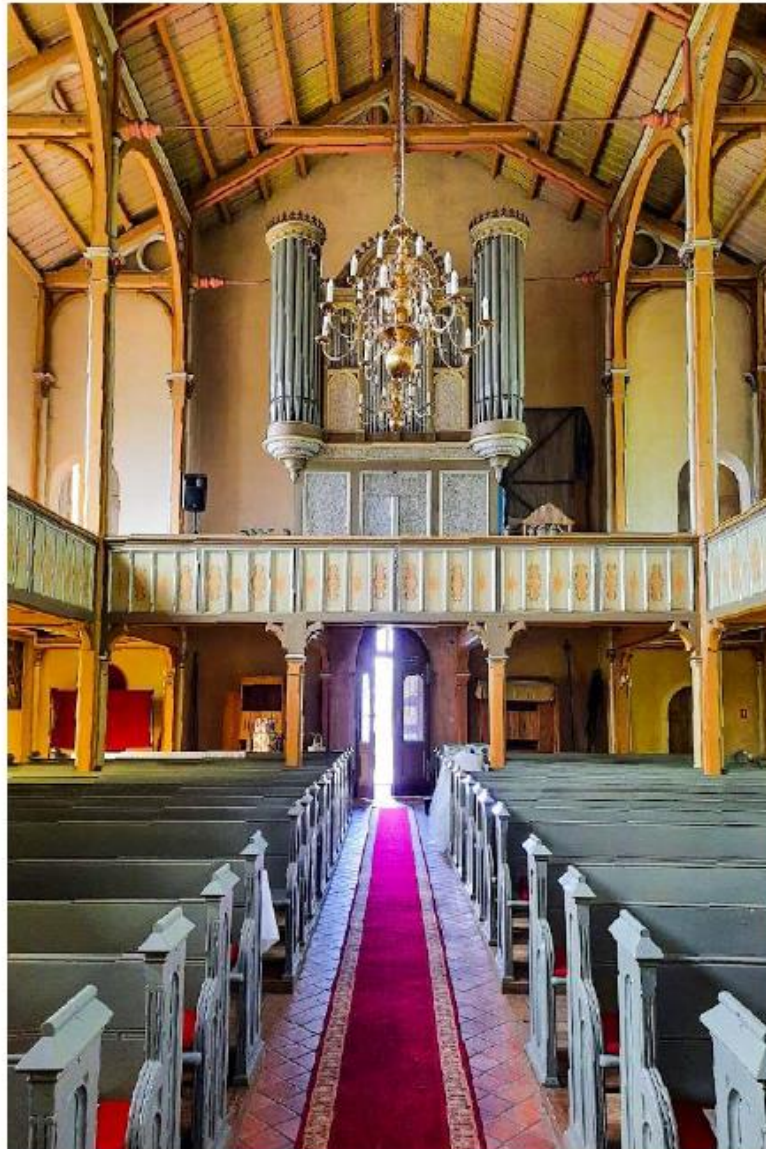
Wnętrze kościoła w Wicinie