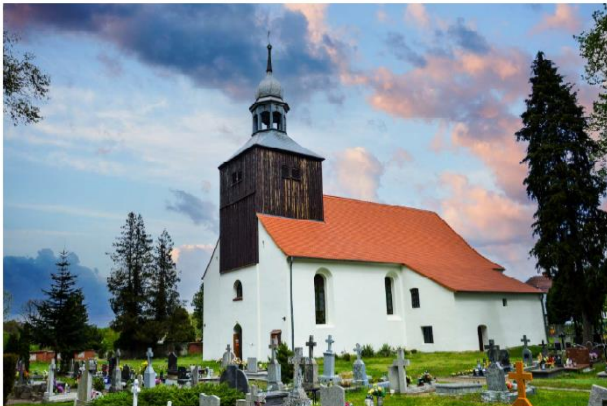
Kościół w Jabłońcu