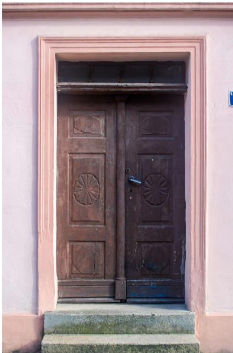
Zabytkowa stolarka drzwiowa w Jasieniu

Gmina miejsko-wiejska Jasień będzie podejmowała działania w obrębie wszystkich instrumentów wdrażania w formie inicjatyw własnych oraz w ramach współudziału w takowych działaniach, które będą realizowane przez inne instytucje.