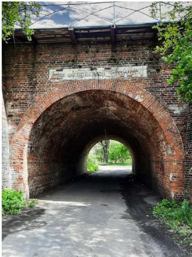
Przepust kolejowy w Jasieniu