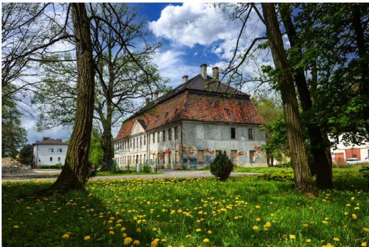
Pałac w Jasieniu