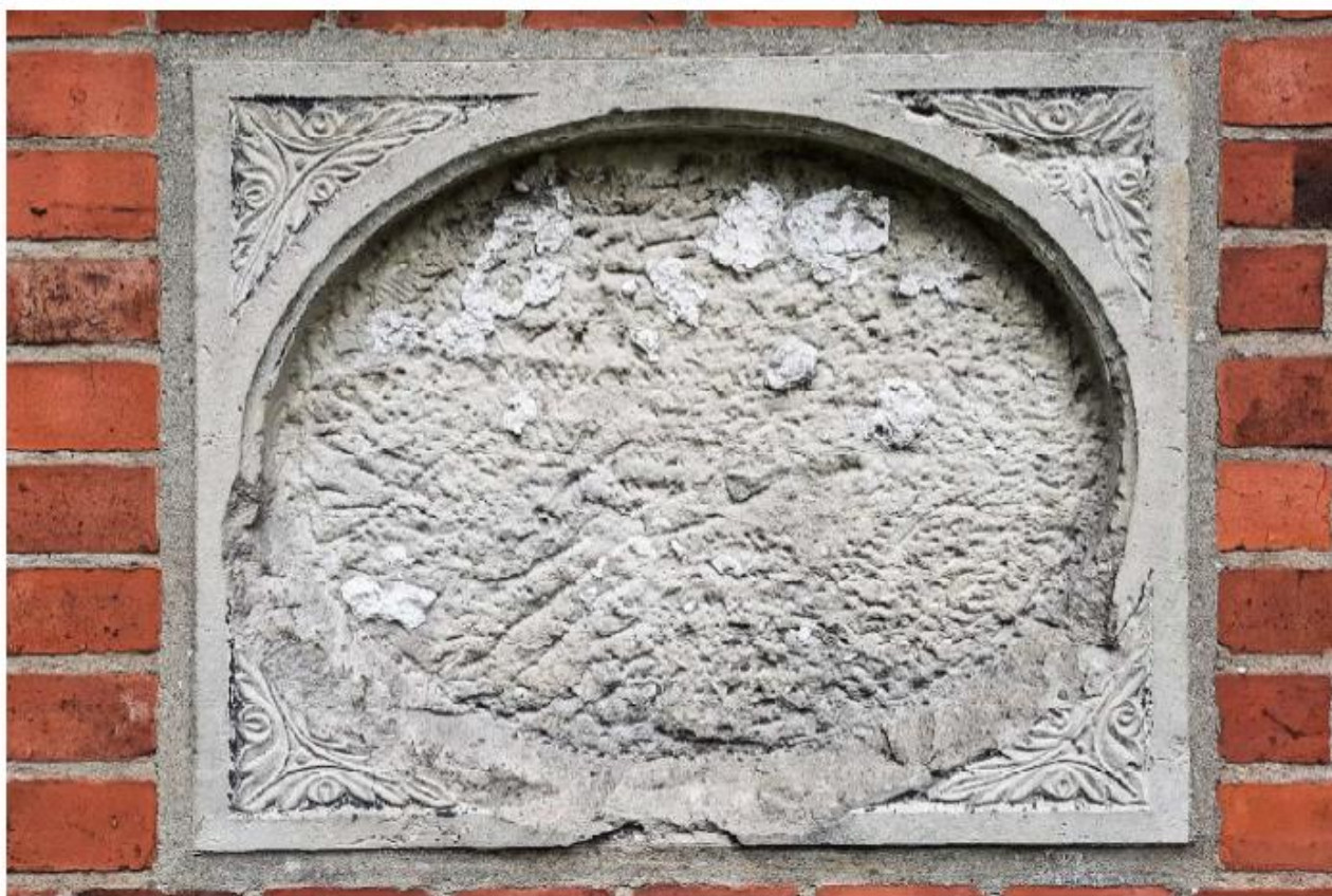
Płyta epitafijna umieszczona w ogrodzeniu cmentarza ewangelickiego w Jabłońcu

Spuścizna zabytków przemysłowych i kolejowych jest wciąż niedocenianym dziedzictwem, które w dużej mierze miało wpływ na ukształtowanie krajobrazu kulturowego gminy Jasień. Należy pokreślić, że powstające od II połowy XIX w. i w I połowie XX w. wielkie zakłady przemysłowe były istotnym czynnikiem rozwoju urbanistycznego miasteczka Jasień, powiązanego z komunikacyjną infrastrukturą w postaci linii kolejowych i bocznic. Należy docenić starania społeczników w tym regionie w celu ochrony dziedzictwa kolejowego, które przejawiają się np. w działaniach Fundacji Kolejowej Stacja Lubsko-Sommerfeld (z siedzibą w pobliskim Lubsku). Fundacja zajmuje się m. in. popularyzowaniem wiedzy o Berlinie, jak nazywana jest magistrała kolejowa Berlin-Wrocław np. w formie imprez plenerowych z okazji jubileuszu powstania Berlinki lub pikniku z drezynami, który zorganizowano w 2017 r. na stacji kolejowej w Jasieniu.