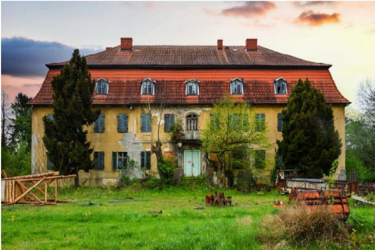
Pałac w Jasionnej