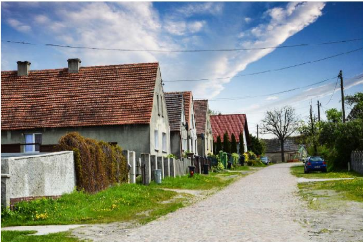
Świbna - układ ruralistyczny