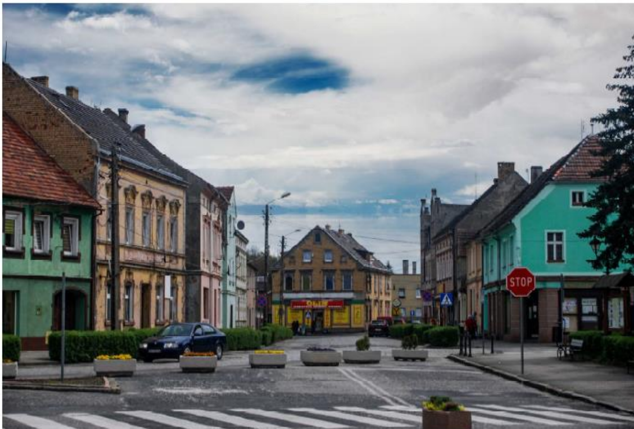
Jasień – układ urbanistyczny