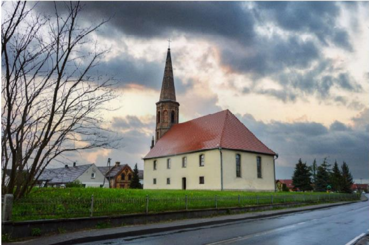
Kościół w Budzichowie