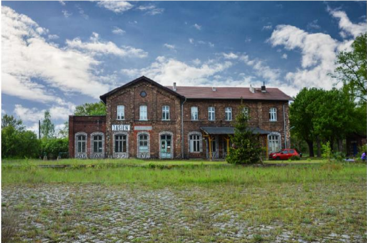
Dworzec kolejowy w Jasieniu