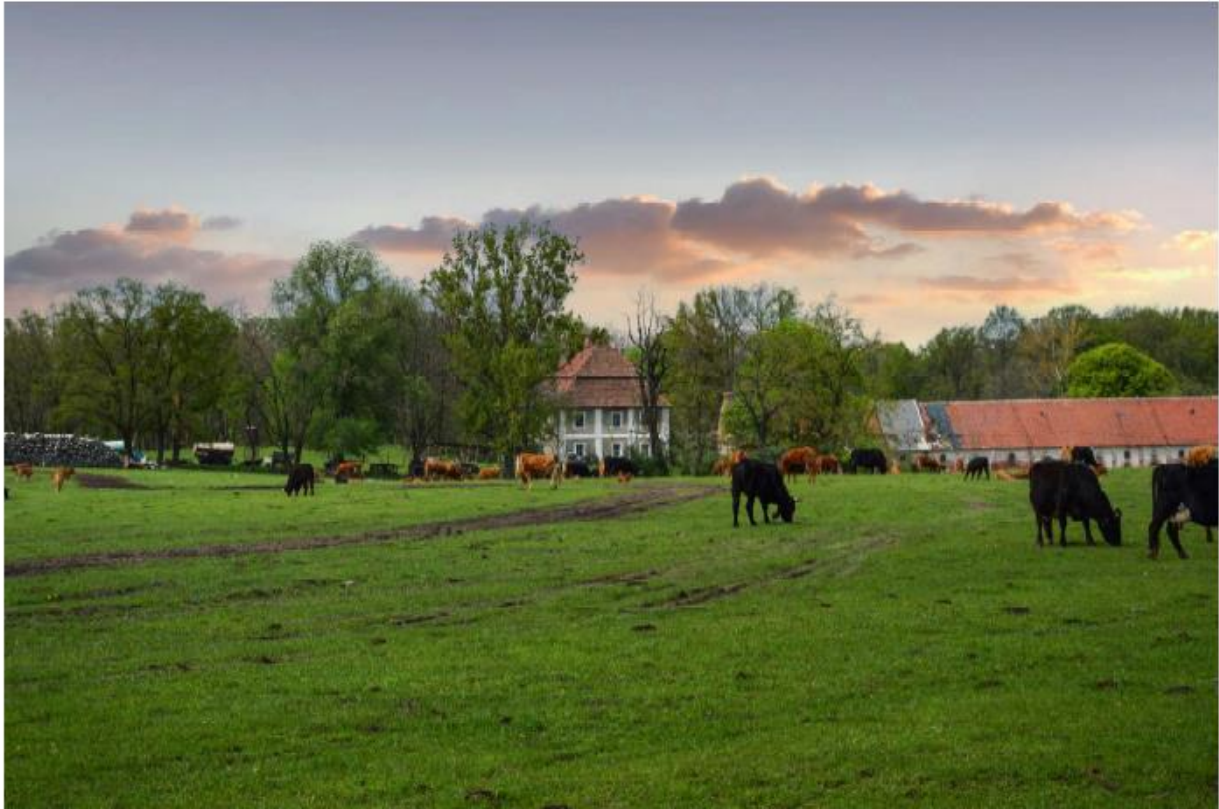
Pałac w Świbnej