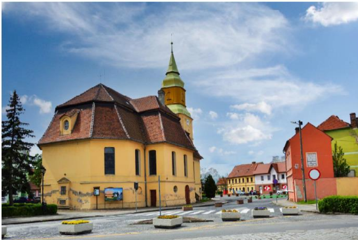
Kościół w Jasieniu