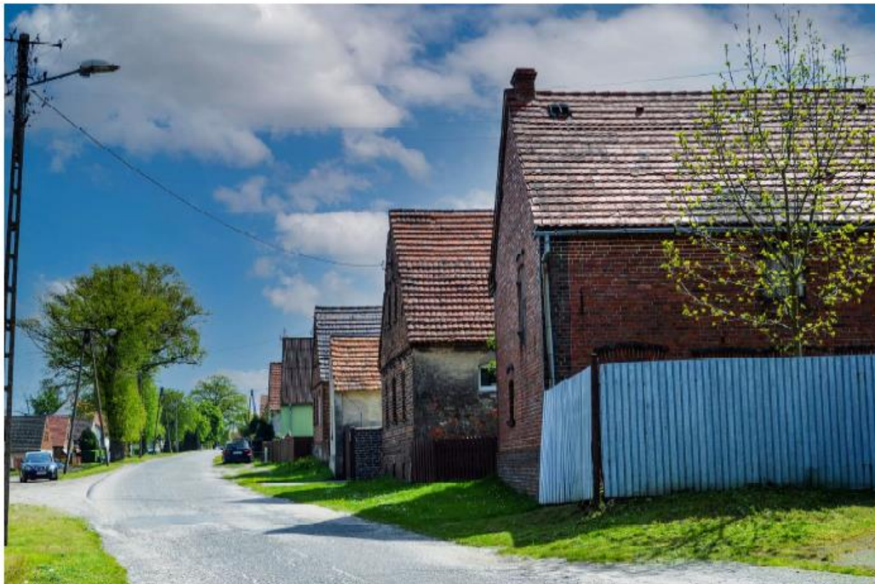
Zabłocie - układ ruralistyczny