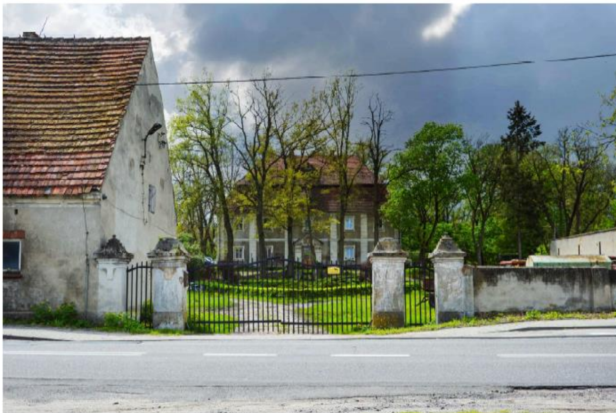
Pałac w Świbnej