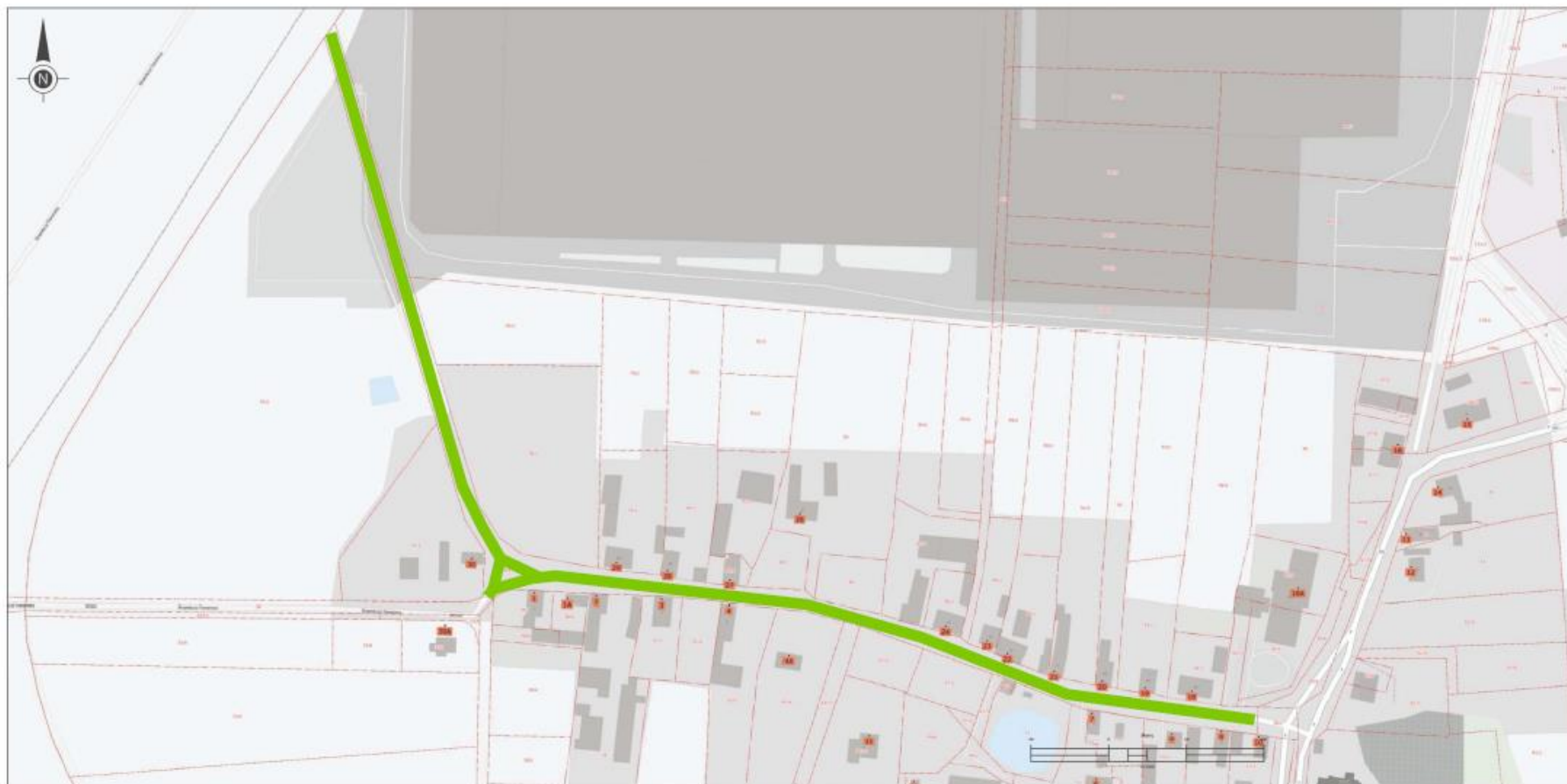
Wydruk mapy z systemu GISON skala 1:2000

Współrzędne: 52.2417616319304, 15.8268193593032