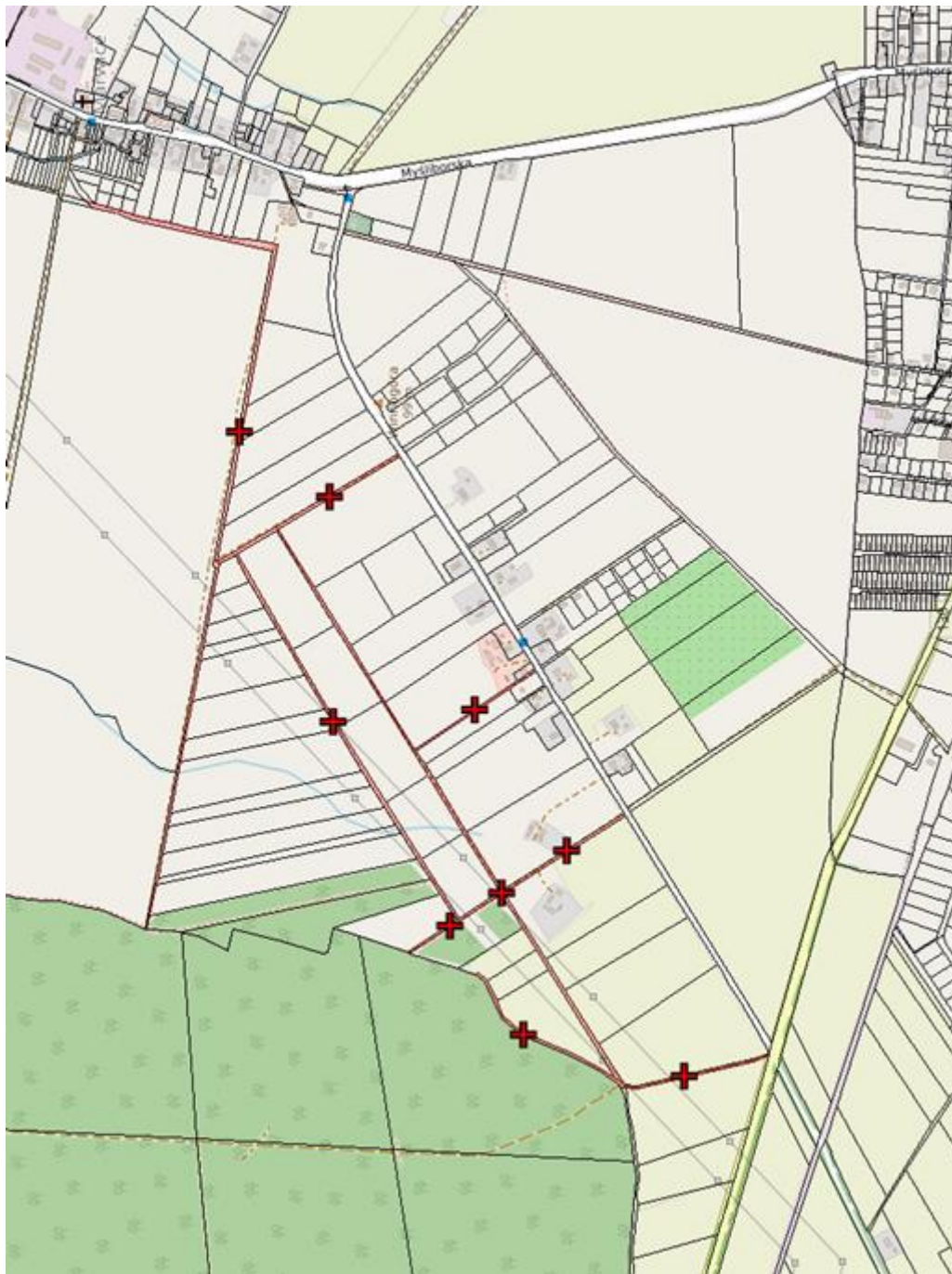
Mapa nr 3. Nowy przebieg drogi gminnej nr 002857F.