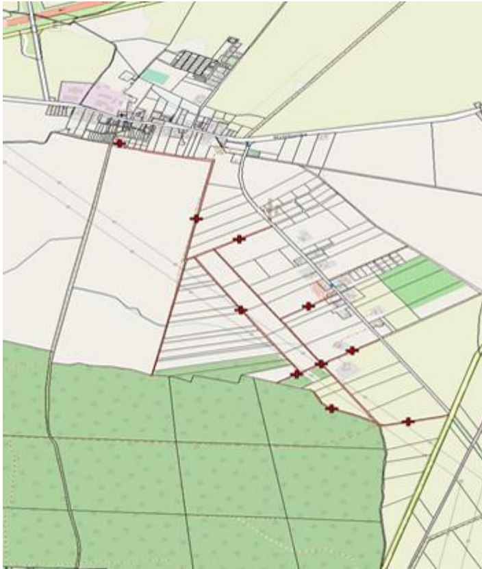
Mapa nr 1. Dotychczasowy przebieg drogi gminnej nr 002857F.

Załącznik Nr 2 do uchwały Nr XLI/330/2022 Rady Gminy Lubiszyn z dnia 27 października 2022 r.