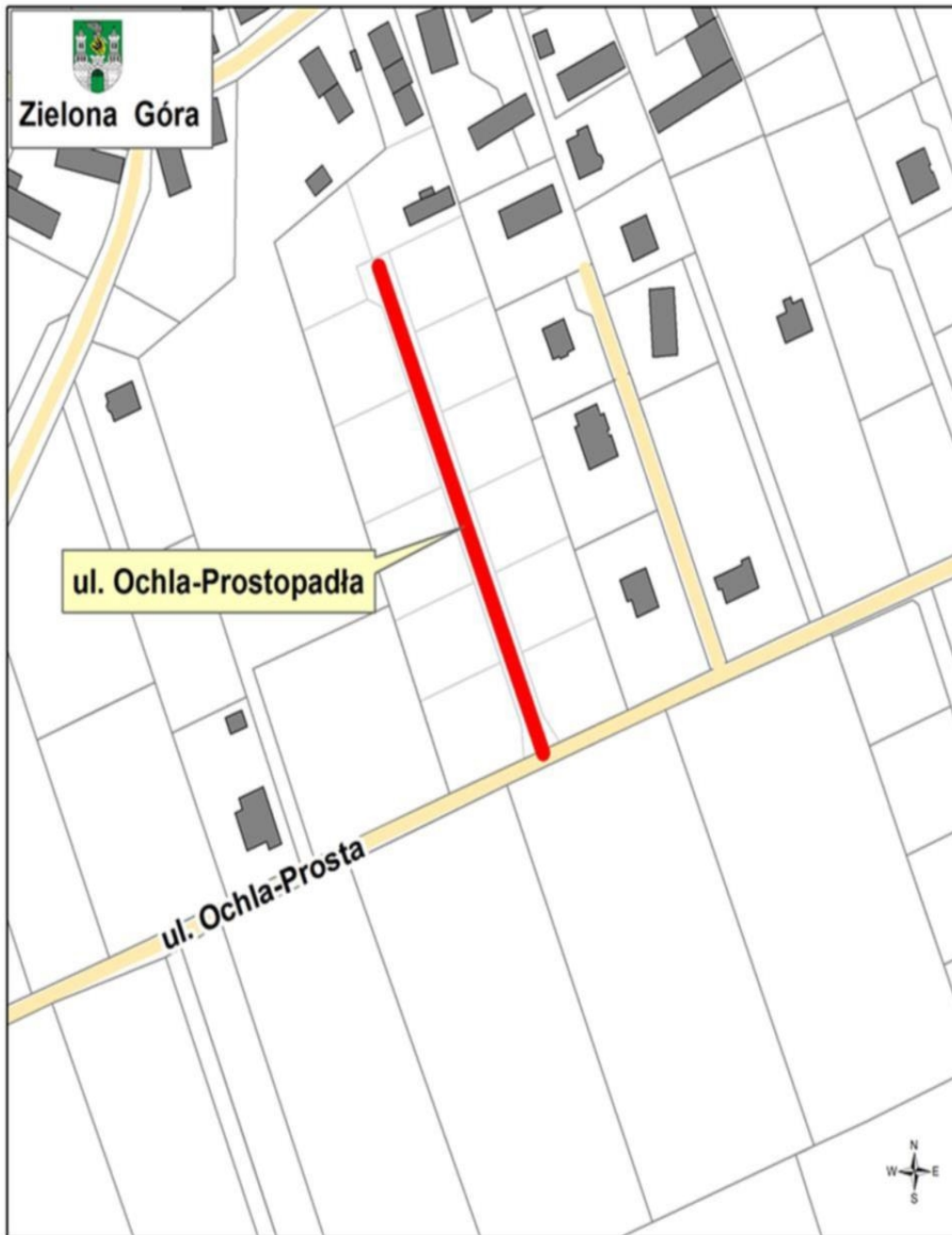
— - ul. Ochla-Prostopadła