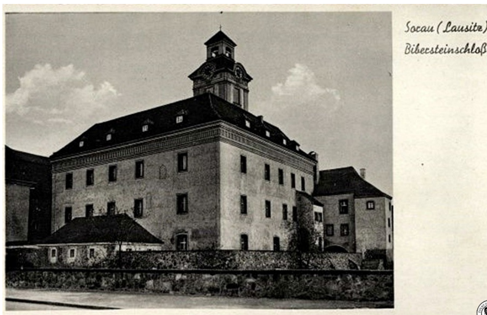
Żary, zamek

Bytomia Odrzańskiego i Siedliska. W 1558 r. dobra żarskie zostały sprzedane biskupowi wrocławskiemu Baltazarowi von Promnitz. To wydarzenie było momentem przełomowym, ponieważ Żary i okolice przeszły pod panowanie tego rodu na kolejnych 200 lat. Kolejnym właścicielem Żar został bratanek biskupa Zygfryd Promnitz, który ufundował szpital na miejscu spalonego klasztoru franciszkanów.