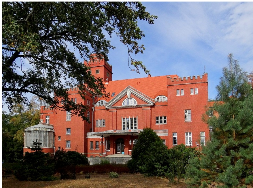
Miłowice pałac, obecnie DPS