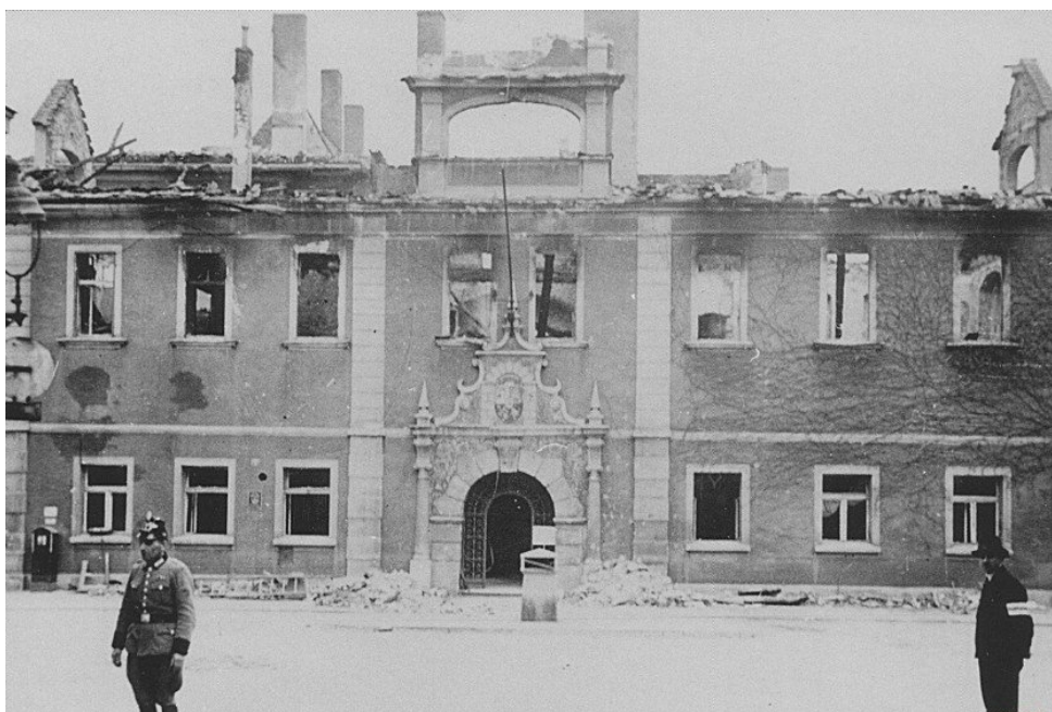
Żary, ratusz po zniszczeniach wojennych

tu produkcję samolotów myśliwskich o napędzie tłokowym – Focke Wulf FW 190. Fabryka w Żarach była drugim pod względem wielkości zakładem Focke-Wulfa, w którym pracowało ponad 4500 robotników. W Jasieniu na terenie ZREMB-u w czasie wojny znajdowały się natomiast zakłady Maschinenfabrik und Eisengießerei Theodor Flöther , gdzie zatrudnionych było 1300 osób, a wśród nich więźniowie filii obozu koncentracyjnego Gross Rosen znajdującej się przy drodze na Mierkowice. Obecność zakładów lotniczych przyczyniła się do zniszczenia Żar przez amerykański nalot dywanowy. 11 kwietnia 1944 r. zniszczono zakłady Focke-Wulfa. W gruzach legły także pałac i zamek, zabudowa Starego Miasta oraz sieć kanalizacyjna. 16 lutego 1945 r. Armia Czerwona zdobyła Żary.