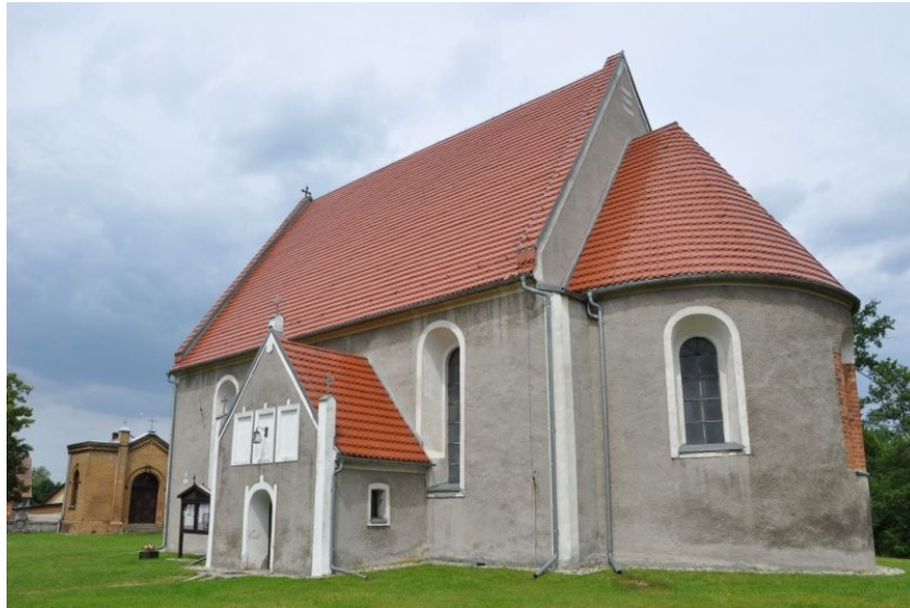
Biedrzychowice Dolne, kościół pw. Podwyższenia Krzyża Świętego