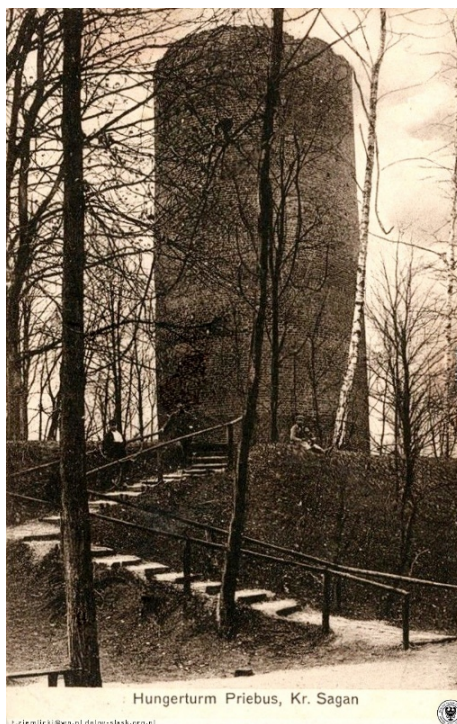
Przewóz, wieża zamkowa

Poprzez małżeństwo Elżbiety Pack z Fryderykiem Bibersteinem lenno żarskie przeszło w II połowie XIV w. w ręce Bibersteinów. Jan IV Biberstein nadał sukiennikom żarskim przywileje, które uczyniły ich wiodącą grupą rzemieślniczą w mieście. Rozwijały się także inne cechy trudniące się wytwarzaniem tkanin. Żary oraz Lubsko uzyskały w początkach XV w. przywilej menniczny. W 1414 r. władze Żar wykupiły prawa do dziedzicznego wójtostwa. W pierwszej połowie XV w. Ulryk Biberstein połączył lenno żarskie z trzebielskim tworząc jedno państwo stanowe: Żary-Trzebiel, które utrzymało się przez kilka następnych stuleci. W XIV i początkach XV w. leżące na terenie piastowskiego księstwa żagańskiego Żarki Wielkie i Przewóz (istniał tu zamek) były w posiadaniu Hackebornów, którzy uzyskali złą sławę jako raubritterzy – rycerze rozbójnicy. W 1449 r. Przewóz znalazł się we władaniu księcia Jana II Szalonego. W 1461 r. Jan II dzięki pomocy króla czeskiego Jerzego z Podiebradów zajął księstwo żagańskie, które jednak utracił w 1467r. na rzecz swojego brata Baltazara. W 1472 r. uwięził na zamku w Przewozie księcia Baltazara, który zmarł w ciągu dwóch miesięcy śmiercią głodową. Uzyskane w ten sposób księstwo Jan II sprzedał wraz z Przewozem księżętom saskim. Księżę ten przeszedł do historii jako ostatni z linii Piastów panujących w Żaganiu i Głogowie.