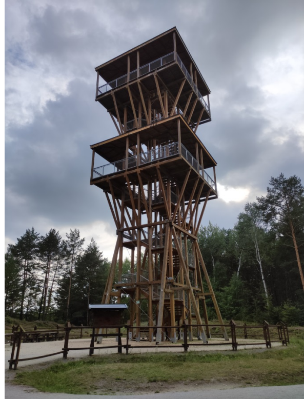
Wieża widokowa, „Dawna kopalnia Babina”

Do najbardziej czytelnych elementów należą zespoły osadnicze oparte o układy urbanistyczne w postaci zespołów miejskich oraz układy ruralistyczne obejmujące osadnictwo wiejskie. Ta druga grupa obiektów jest reprezentowana przez osady średniowieczne, które obejmują trzon istniejących obecnie wsi na terenie powiatu oraz osady nowożytny, związane z późniejszym osadnictwem. Najbardziej reprezentatywnym przykładem układu miejskiego pozostają Żary, który mimo zniszczeń z II wojny oraz powojennych przekształceń architektonicznych, zachował swoje pierwotne cechy przestrzenne. Zasadniczym elementem tego układu pozostaje zabudowa rynkowa w postaci architektury mieszkalnej oraz użyteczności publicznej z dominantą w postaci fary, ciągi komunikacyjne.