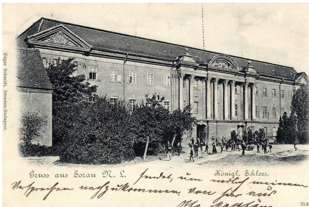
Żary, pałac

Przemarsze wojsk podczas wojen napoleońskich w 1807 r. oraz 1813 r. wiązały się z uciążliwymi kontrybucjami i zniszczeniami miasta i okolic. Na mocy postanowień Kongresu Wiedeńskiego w 1815 r. połowa Saksonii, włącznie z Żarami została wcielona do Królestwa Prus. Od tej chwili miasto zostało stolicą powiatu żarskiego, obejmującego dawne ziemie państwa stanowego Żary – Trzebiel oraz teren państwa stanowego Zasieki. Znalazło się ono w prowincji brandenburskiej Prus. W 1871 r. region ten wszedł w skład zjednoczonego Cesarstwa Niemieckiego, wraz z Prusami, które doprowadziły do tego zjednoczenia.