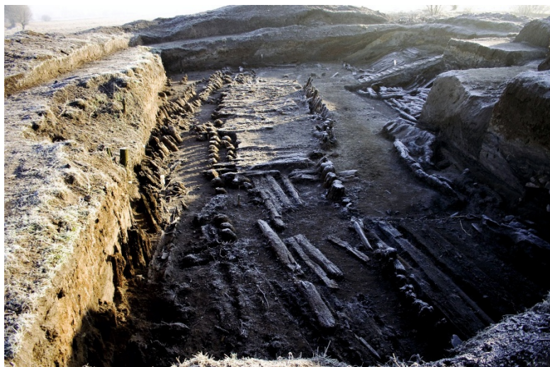
Wykopaliska archeologiczne w Wicinie