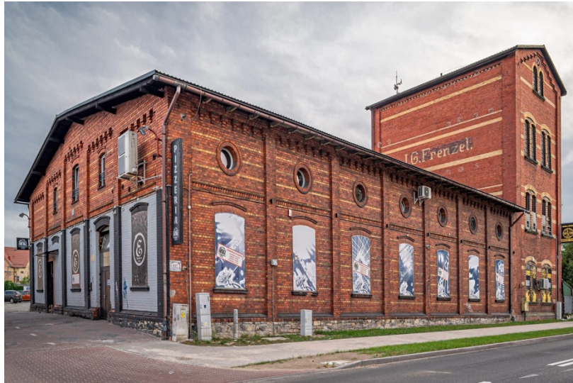
Żary, budynek dawnej tkalni lnu J.G. Frenzla