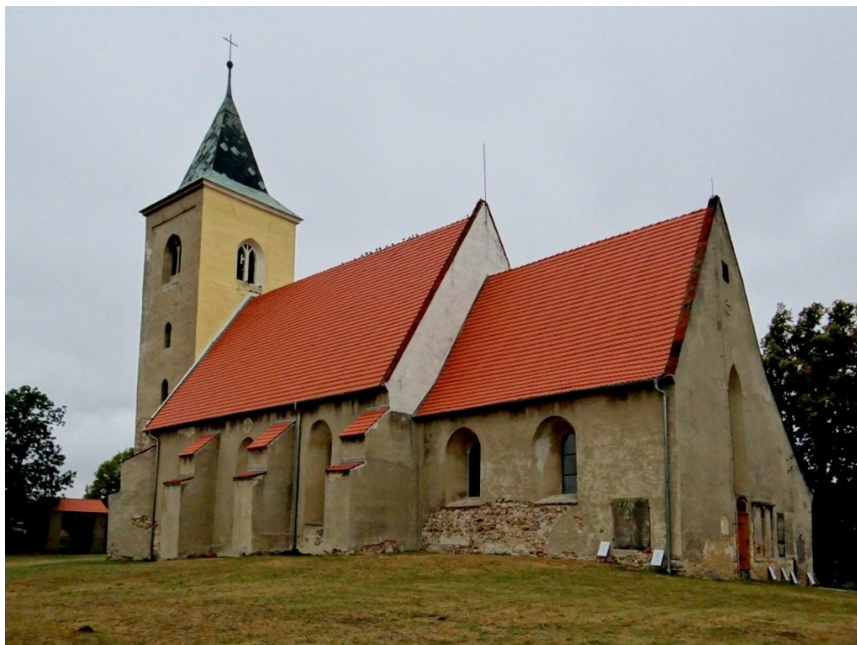
Bieniów, kościół pw. Niepokalanego Poczęcia NMP

Rzadziej na terenie powiatu występują obiekty barokowe. Cenny przykład architektury sakralnej to kościół Bieczu, wzniesiony na planie centralnym w 1719 r. przez saskiego architekta Geoga Bähra, którego najbardziej znanym dziełem jest kościół Najświętszej Marii Panny w Dreźnie. Odnotować należy kościoły w Brodach, Jasieniu. W przypadku zabytków barokowych wspomnieć trzeba o wyposażeniu ruchomym z tego okresu, obecnym także w późniejszych przykładach architektury historyzującej. Warto wskazać obiekty o konstrukcji szkieletowej takie jak np. w Chociczu. Tego typu budowle z uwagi na budulec oraz liczne przebudowy zwłaszcza pod koniec XIX wieku zaliczają się do rzadszych, stąd ich wartość jest znacząca dla oceny dawnych form