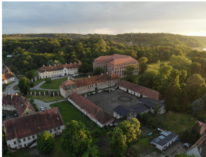
Brody, zespół pałacowy

Wzniesiony w połowie XVIII w. dla Henryka Brühla, pierwszego ministra Augusta III króla polskiego i elektora saskiego, zespół pałacowy w Brodach jest w obecnej postaci dziełem wybitnego architekta Knöffela, który uczynił z Brodów jedną z najwspanialszych barokowych rezydencji magnackich w Europie.