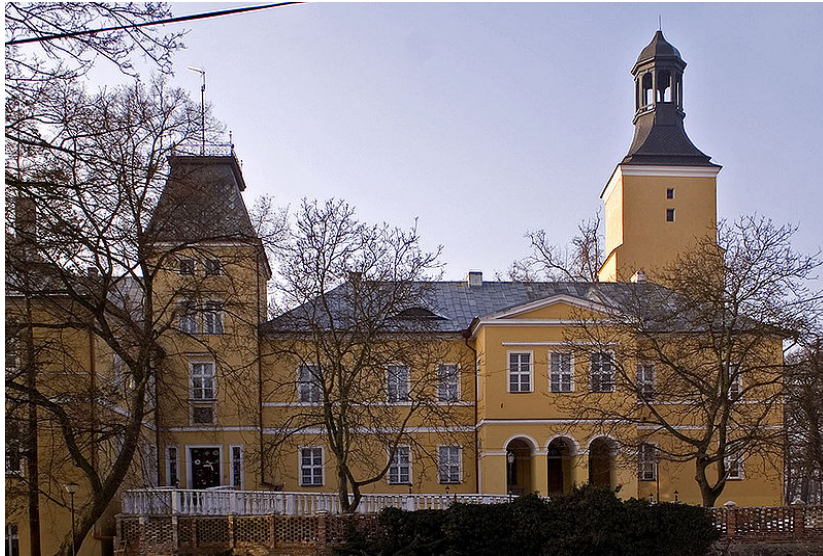
Lubsko, zamek, obecnie DPS