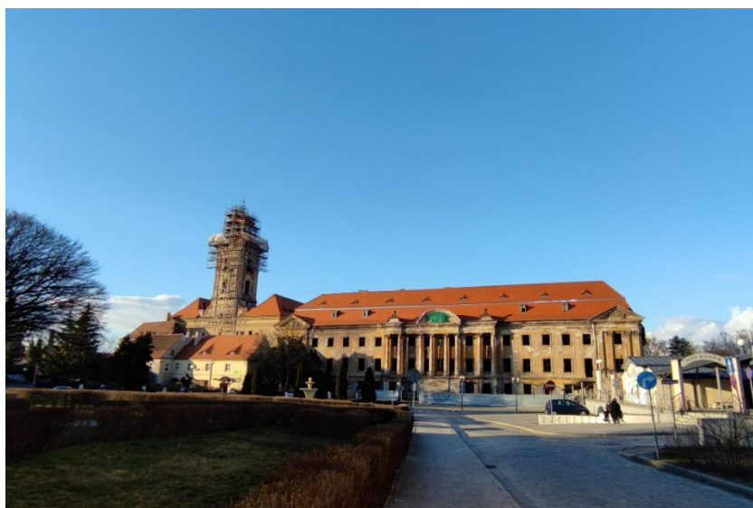
Żary, zespół zamkowo-pałacowy

Ważnymi zabytkami stanowiącymi istotne elementy w układzie przestrzennym miasta jest zespół rezydencjonalny położony w północno-zachodniej części starego miasta. Zamek zajmuje południowo-zachodni segment założenia. Od wschodu połączony jest bramą z wybudowanym na początku XVIII wieku pałacem, a do jego południowo-zachodniego narożnika przylega jeden z budynków pierwotnej kuchni. Od północy i wschodu otoczony jest szeroką, obecnie suchą, fosą.