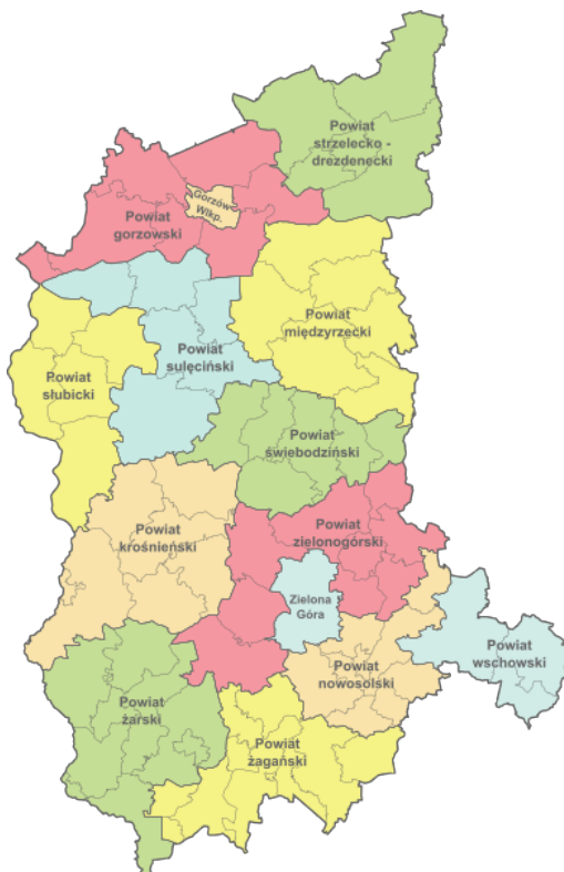
mapa administracyjna województwa lubuskiego