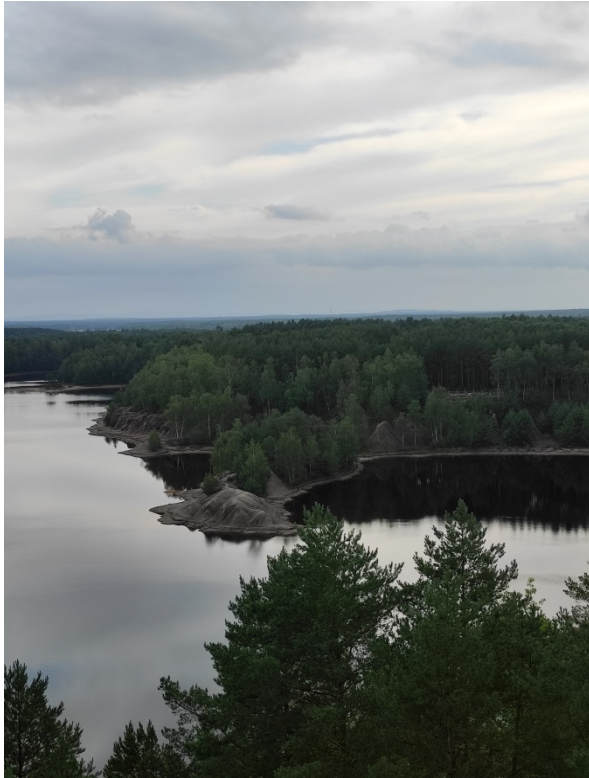
Ścieżka geoturystyczna „Dawna kopalnia Babina”

najcenniejszych produktów turystycznych województwa lubuskiego. Nazwa odnosi się do struktury geologicznej terenu – spiętrzonych moren czołowej uformowanej w kształt łuku otwartego ku północy, o długości ok. 40 km i szerokości 3–4 km, przedzielonego przez Nysę Łużycką. W obrębie geoparku znajdują się również liczne zbiorniki wodne, ścieżka geoturystyczna „Dawna kopalnia Babina” z wieżą widokową oraz Park Mużakowski.