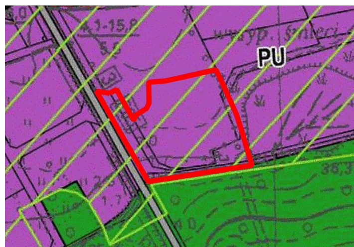
WYRYS ZE STUDIUM UWARUNKWAŃ I KIERUNKÓW ZAGOSPODAROWANIA PRZESTRZENNEGO GMINY SKWIERZYNA