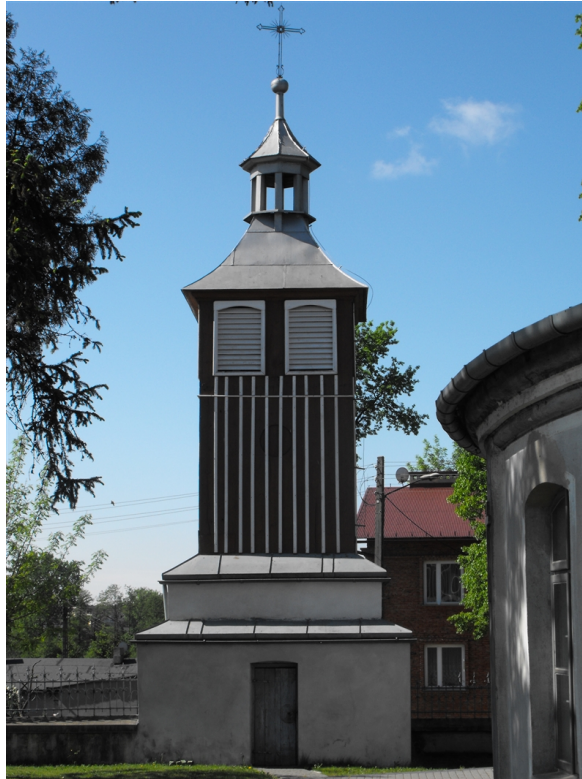
Zdjęcie nr 6. Dzwonnica w Moszczenicy.

§ 25. Dzwonnica w Moszczenicy znajduje się przy kościele parafialnym p. w. Podwyższenia Krzyża Św. w Moszczenicy. Została wzniesiona w XVIII w., przebudowana w XIX w. i remontowana w latach 70 – tych XX w. Dzwonnicę w Moszczenicy przedstawia zdjęcie nr 6.