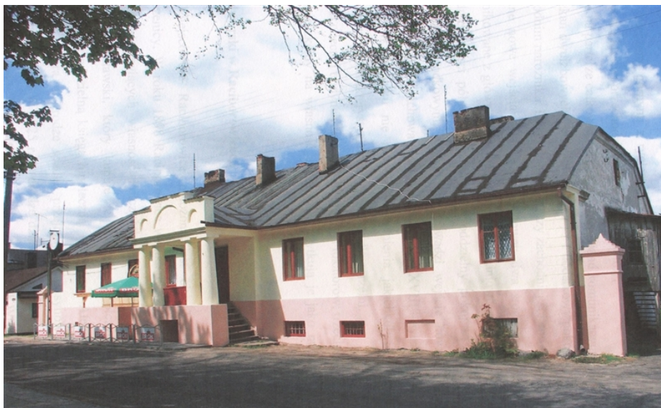
Zdjęcie nr 2. Gorzelnia w Moszczenicy.

§ 22. Dwór w Moszczenicy to murowany dwór wybudowany przez Karola Endera w II połowie XIX w. stanowiący wraz z otaczającym parkiem zespół zabytkowy o dużych walorach architektoniczno – krajobrazowych, artystycznych i historycznych. Budynek w części centralnej jest dwukondygnacyjny z bocznymi skrzydłami parterowymi. Elewacja rezydencji pałacowej zachowała w większości charakter pierwotny, a przed pałacem od strony północnej istnieją ślady tarasu widokowego. Długie nieużytkowanie budynku oraz pożar w 2007 r. spowodowały, że zabytek ten jest mocno zniszczony. Stanowi własność komunalną. Dwór w Moszczenicy przedstawia zdjęcie nr 3.