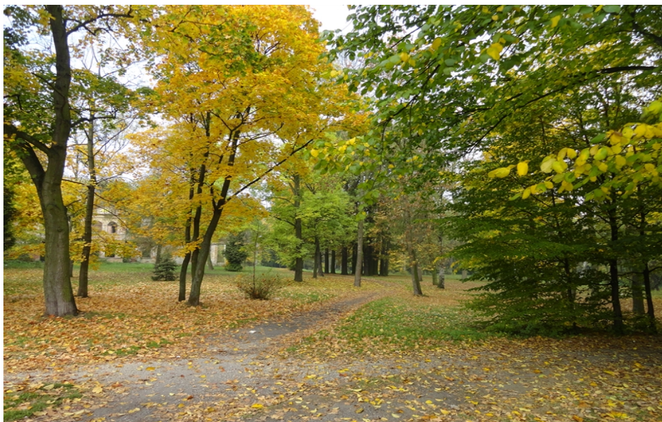
Zdjęcie nr 4. Park podworski w Moszczenicy.

wejść usytuowanych w różnych punktach parku. Układ starych dróg został prawie całkowicie zatarty i zastąpiony całą masą przedeptanych skrótów komunikacyjnych. Dobrze czytelne pozostały jedynie aleje grabowe o nawierzchni ziemnej oraz droga pieszo-jezdna stanowiąca obecną, wschodnią granicę parku. Droga ta ma nawierzchnię brukowaną. Park podworski przedstawia zdjęcie nr 4.