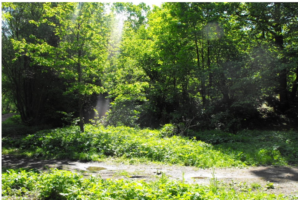
Zdjęcie nr 11. Grodzisko w Rekoraju.