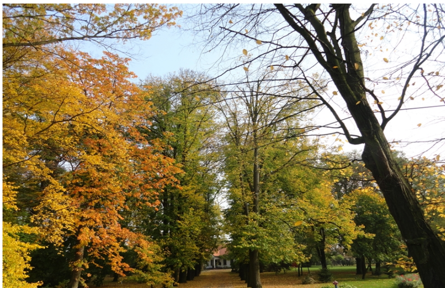
Zdjęcie nr 1. Park dworski w Kiełczówce.

§ 20. Park dworski w Kiełczówce to park podworski, krajobrazowy, pochodzący z poł. XIX w., bogaty w starodrzew. Najstarszymi drzewami są: lipy, graby i jesiony. Posiada duże walory krajobrazowe i przyrodnicze. Jest własnością prywatną. Ogólny stan zachowania ocenia się jako dobry. Park dworski w Kiełczówce przedstawia zdjęcie nr 1.