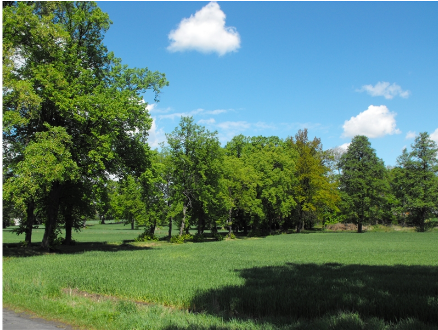
Zdjęcie nr 8. Park dworski w Rękoraju.

§ 27. Park dworski w Rękoraju to park podworski, krajobrazowy z II połowy XIX w.. W skład zespołu parkowego wchodzi teren dawnego podwórza gospodarczego tradycyjnie powiązanego przestrzennie z parkiem, usytuowanego w części północnej działki 240. Obecnie park jest własnością prywatną. Ogólny stan zachowania określa się jako dobry. Park dworski w Rękoraju przedstawia zdjęcie nr 8.