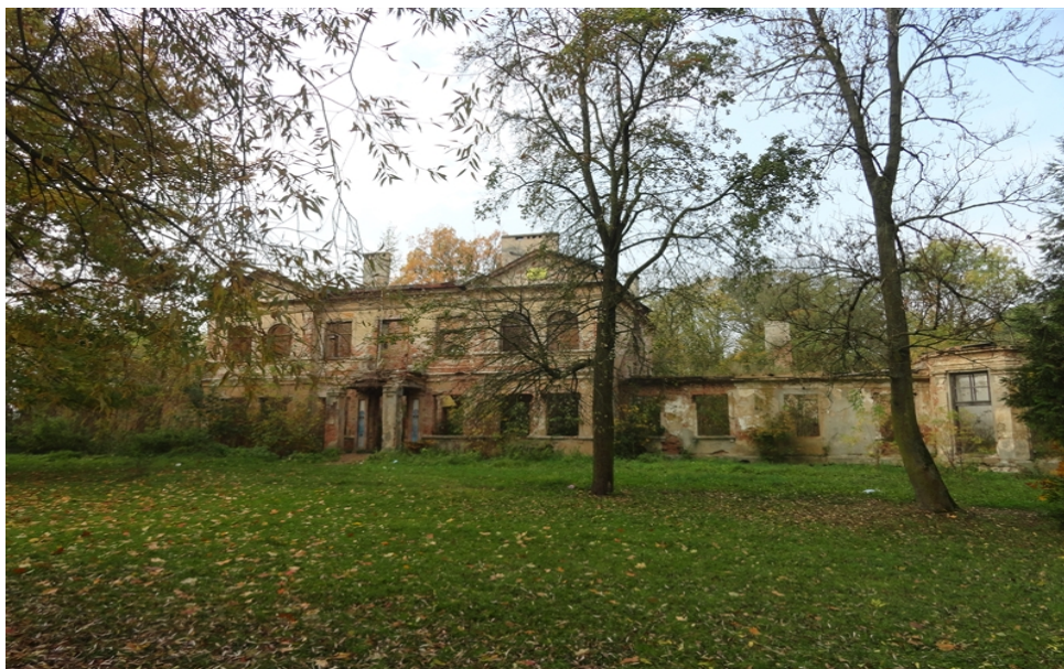
Zdjęcie nr 3. Dwór w Moszczenicy.

§ 22. Dwór w Moszczenicy to murowany dwór wybudowany przez Karola Endera w II połowie XIX w. stanowiący wraz z otaczającym parkiem zespół zabytkowy o dużych walorach architektoniczno – krajobrazowych, artystycznych i historycznych. Budynek w części centralnej jest dwukondygnacyjny z bocznymi skrzydłami parterowymi. Elewacja rezydencji pałacowej zachowała w większości charakter pierwotny, a przed pałacem od strony północnej istnieją ślady tarasu widokowego. Długie nieużytkowanie budynku oraz pożar w 2007 r. spowodowały, że zabytek ten jest mocno zniszczony. Stanowi własność komunalną. Dwór w Moszczenicy przedstawia zdjęcie nr 3.