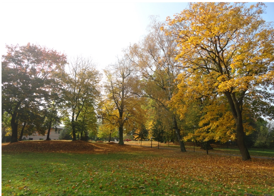
Zdjęcie nr 6. Park dworski w Raciborowicach.

§ 26. Park dworski w Raciborowicach – datuje się na początek XIX w. Jest to park podworski, krajobrazowy, położony na terenie równinnym z niewielkim spadkiem w kierunku północno – zachodnim w kształcie zbliżonym do nieforemnego wieloboku. Obecnie park jest własnością prywatną. Ogólny stan zachowania ocenia się jako dobry. Park dworski w Raciborowicach przedstawia zdjęcie nr 7.