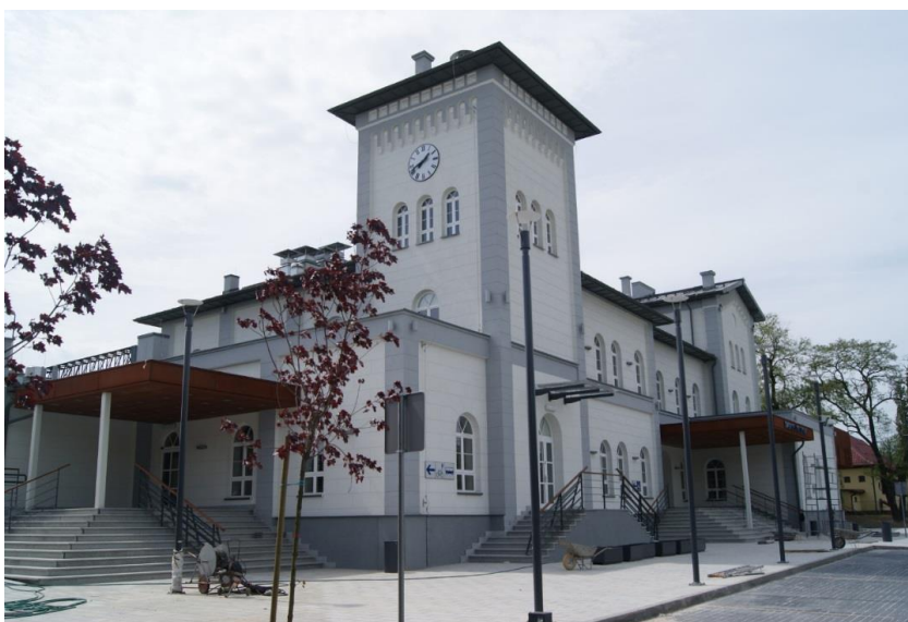
Zachowanie obiektów zabytkowych - dworzec

Miasto Kutno dokona wszelkich starań, by doprowadzić do poprawy stanu obiektów zamieszczanych w gminnej ewidencji zabytków. Istnieje jednak bariera natury prawnej na drodze pozyskiwania środków finansowych na przeprowadzenie remontów, ponieważ ustawa stanowi, że finansowane są prace remontowe obiektów wpisanych do rejestru. Obiekty nie objęte prawną formą ochrony, tzw. ewidencjonowane, mogą uzyskać dofinansowanie jedynie w przypadku opracowania projektów kompleksowej odnowy ze środków dysponowanych przez Urząd Marszałkowski w Łodzi, np. zagospodarowanie turystyczne obiektów, których celem jest wzmocnienie więzi i tożsamości lokalnej, poprzez wykorzystanie walorów turystycznych i kulturowych Kutna. Miasto Kutno systematycznie oznakuje cenne obiekty zabytkowe.