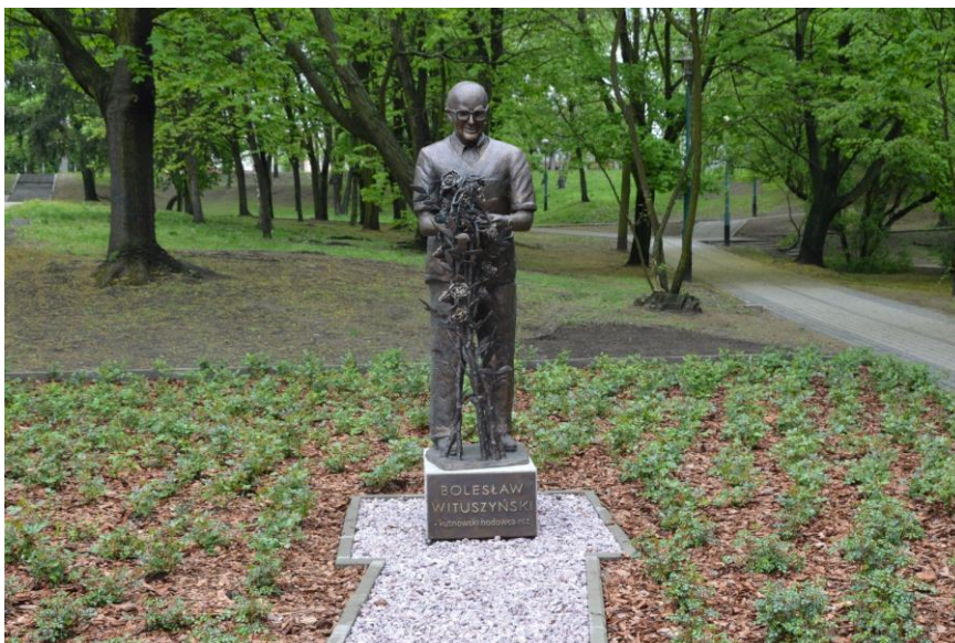
Pomnik Bolesława Wituszyńskiego

W parku Traugutta został ustawiony pomnik Bolesława Wituszyńskiego, bezpośrednio przy Alei Róż. Wokoło pomnika posadzone zostały róże. Dzięki wsparciu i życzliwości lokalnego producenta róż udało się zachować sadzonki róż "Kutno" i "Marylka". Wykonanie pomnika w ramach realizacji projektu "Kutno - miasto róż" oraz elementów małej architektury kosztowało ok. 116 tys. zł. Projekt był dofinansowany do 85% ze środków Europejskiego Funduszu Rozwoju Regionalnego w ramach Regionalnego Programu Operacyjnego Województwa Łódzkiego na lata 2007-2013.