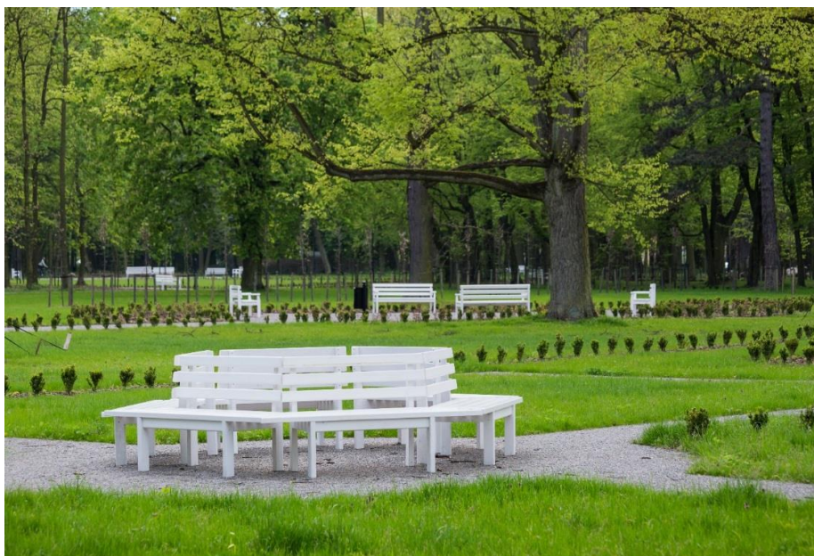
Park Wiosny Ludów po rewaloryzacji

W latach 2014-2015 przeprowadzono prace rewaloryzacyjne parku im. Wiosny Ludów. Na terenie parku posadzono ok. 1 200 sztuk drzew, ok. 13 000 sztuk krzewów i 73 000 roślin wieloletnich. Wykonano trawniki rekreacyjne i gazonowe o powierzchni 2,5 ha. Park wyposażono w nowe elementy małej architektury. Wykonano nowe alejki, zainstalowano oświetlenie. W bieżącym roku planowany jest montaż zabawek na placu zabaw dla starszych dzieci w sąsiedztwie Muzeum Bitwy nad Bzurą. Koszt rewaloryzacji parku wyniósł 4,9 mln zł. Miasto Kutno uzyskało dotację z Wojewódzkiego Funduszu Ochrony Środowiska i Gospodarki Wodnej w ramach konkursu „Przyrodnicze Perły Województwa Łódzkiego” w kwocie 3,5 mln zł.