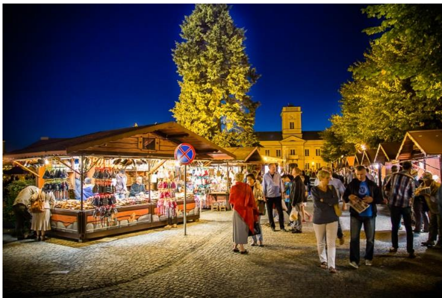
Jarmark różany na pl. marsz. J. Piłsudskiego