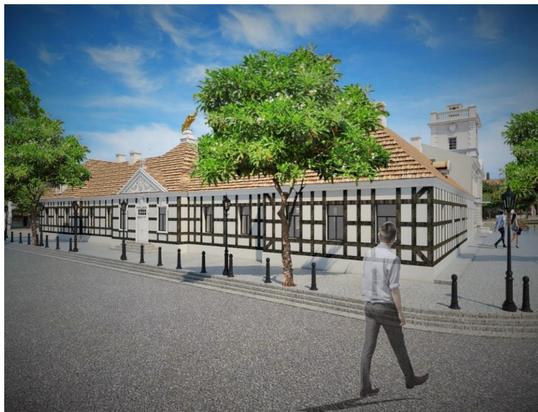
Rewaloryzacja Pałacu Saskiego- projekt

Koncepcja funkcjonalno-użytkowa obejmować będzie budynek Ratusza, Pałac Saski z adaptacją na cele muzealno-kulturalne z poszanowaniem wartości zabytkowych i historycznych obiektu, jak również powstanie na dziedzińcu Muzeum, w miejscu dawnej wozowni, pawilonu będącego zapleczem dla pałacu i pełniącym funkcje muzealno - kulturalne.