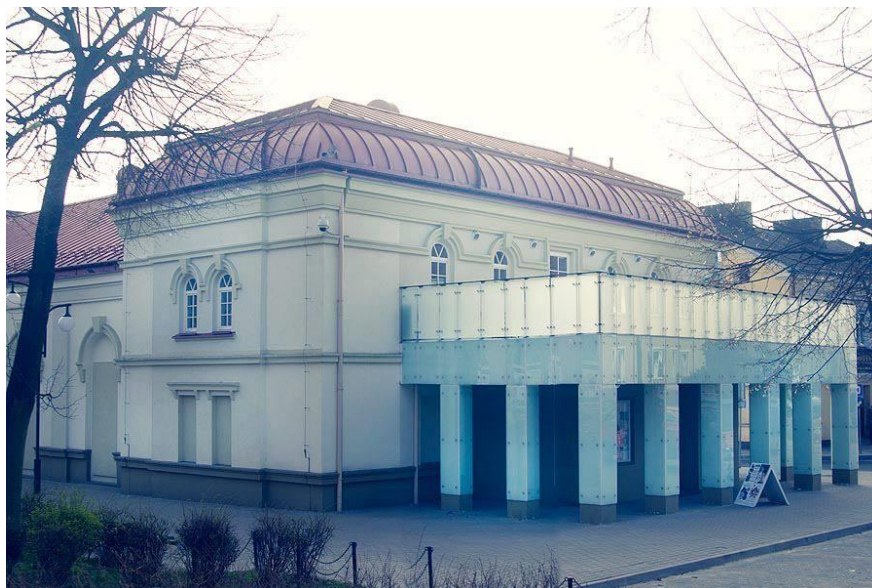
Centrum Teatru, Muzyki i Tańca