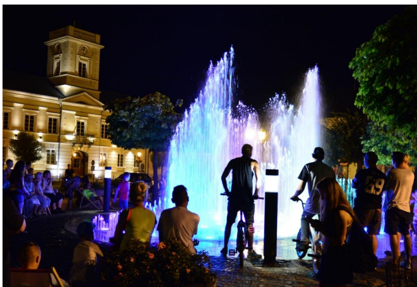
Fontanna na pl. marsz. J. Piłsudskiego

Prace dotyczące budowy fontanny wykonała firma System Automatyki Budynków Jacek Wysocki z Warszawy za kwotę 922 500 zł. Nowa multimedialna fontanna ma 10 metrów średnicy i tworzy symbol lokalny z uwagi na kształt róży z trzema płatkami. Różę tworzy 216 sterowanych komputerowo dysz. Fontanna oświetlona jest diodami led, dzięki którym nocą strumienie wody mienią się wieloma kolorami.