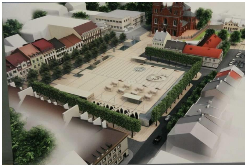
Konceptcja rewaloryzacji Placu Wolności