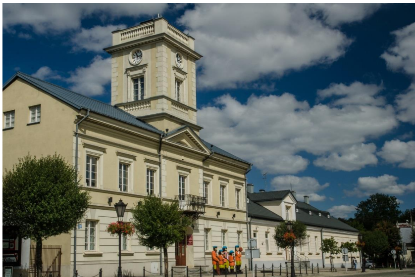
Muzeum Regionalne w Kutnie

Istnieje potrzeba dalszej realizacji nowoczesnych form przekazu i technik wystawienniczych w Muzeum Regionalnym i dalsza digitalizacja zasobów muzealnych i sakralnych. Muzeum i obiekty sakralne posiadają profesjonalne strony internetowe. Muzeum powinno kontynuować szeroką działalność kulturalno-edukacyjną. Istotna jest również kontynuacja udziału w Programie Europejska Noc Muzeów.