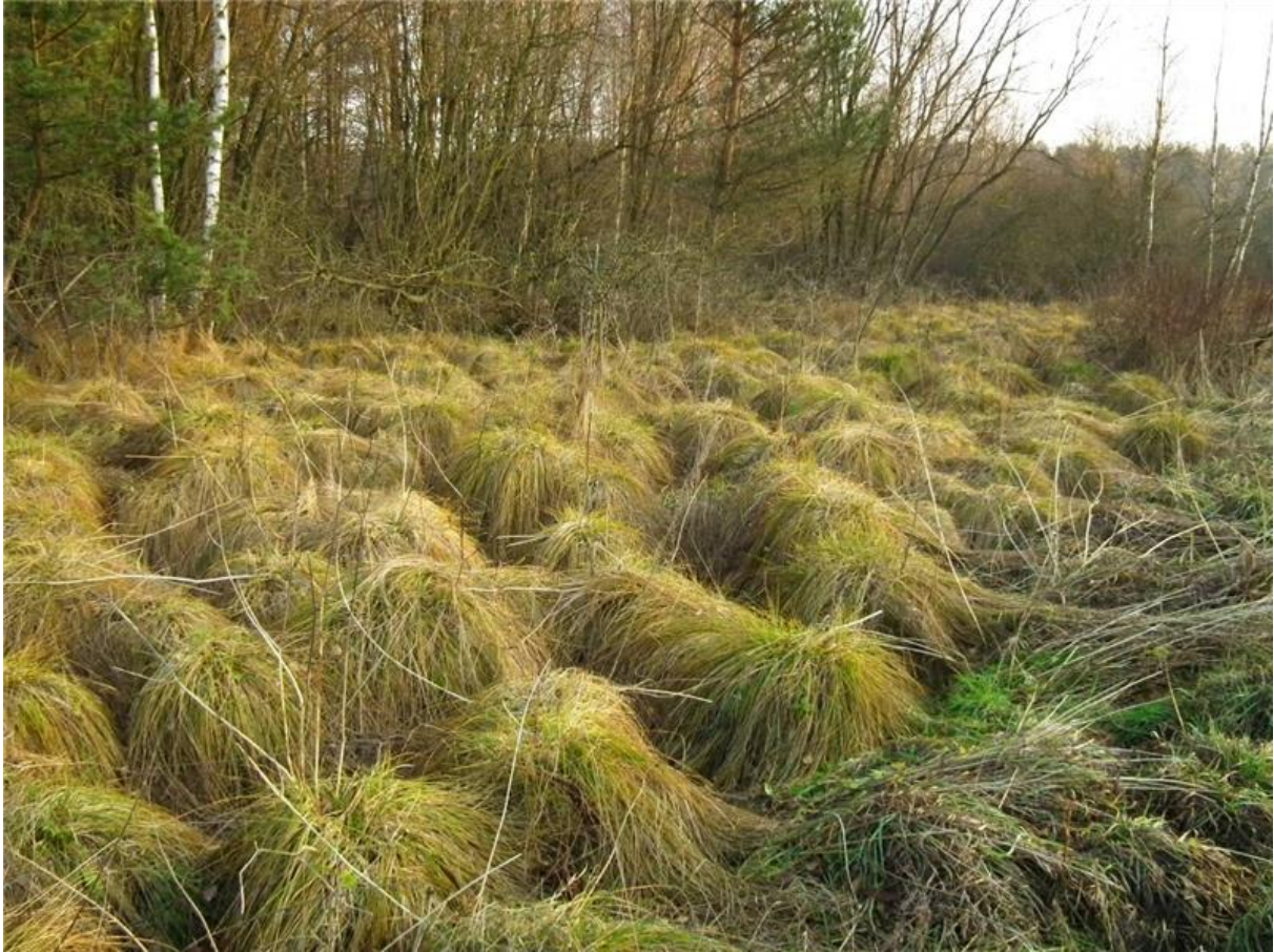
Fot. 2. Szuwar turzycowy w centralnej części użytku.