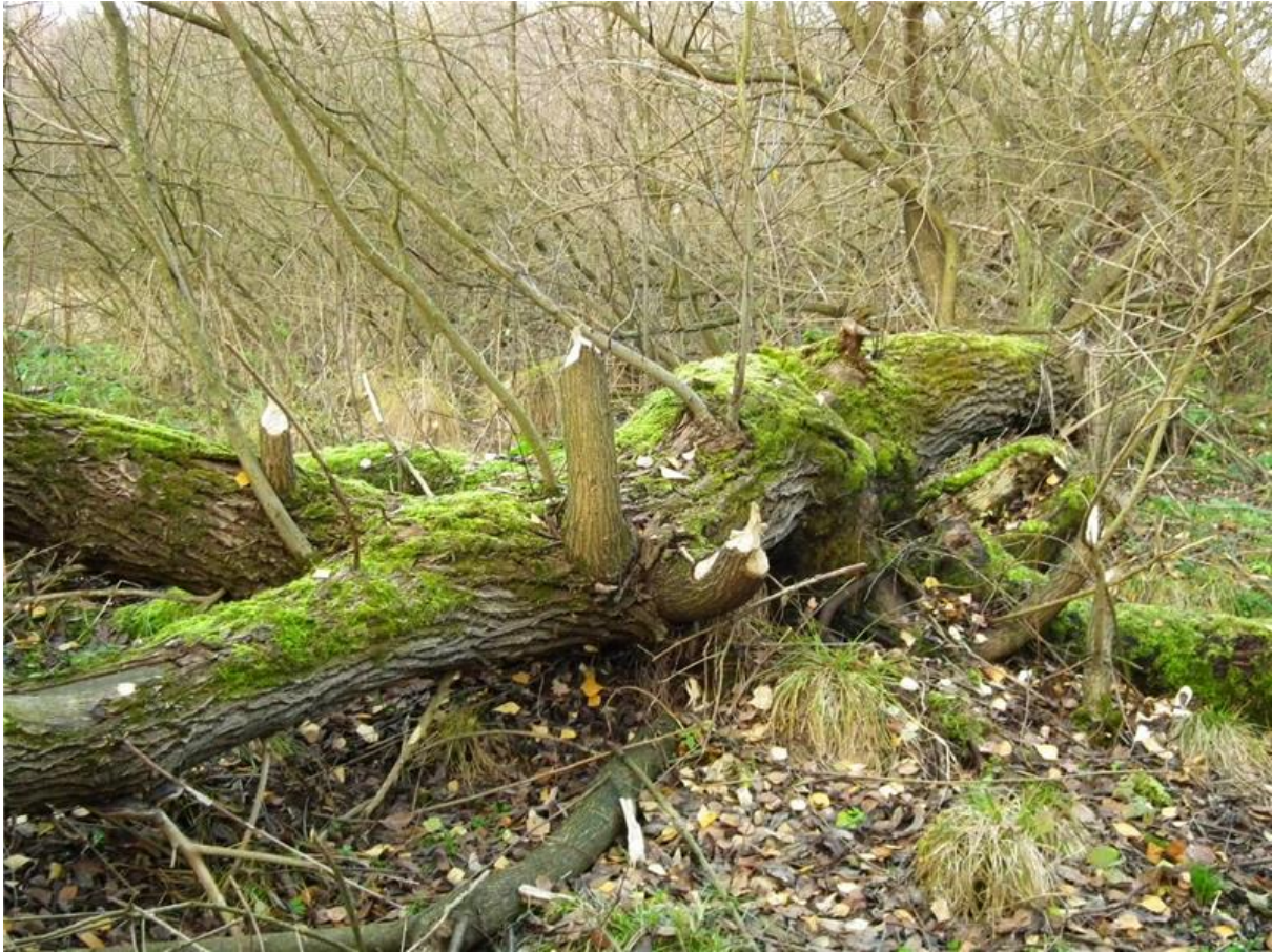
Fot. 5. Zgryzane na pędy na wykrocie wierzby kruchej wewnątrz łozowiska.