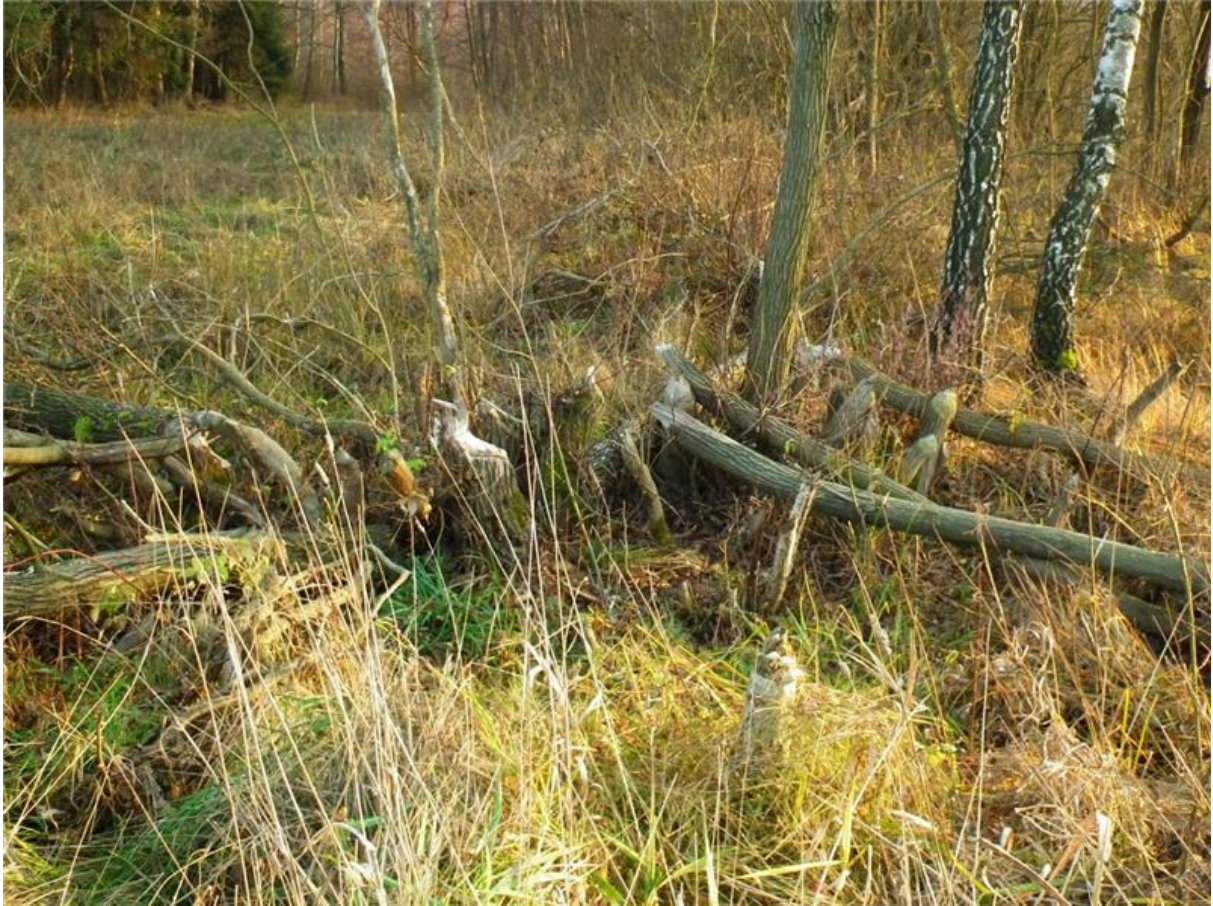
Fot. 1. Zarośla wierzbowo-brzozowe w północnej części użytku (częściowo zgryzione przez bobry).