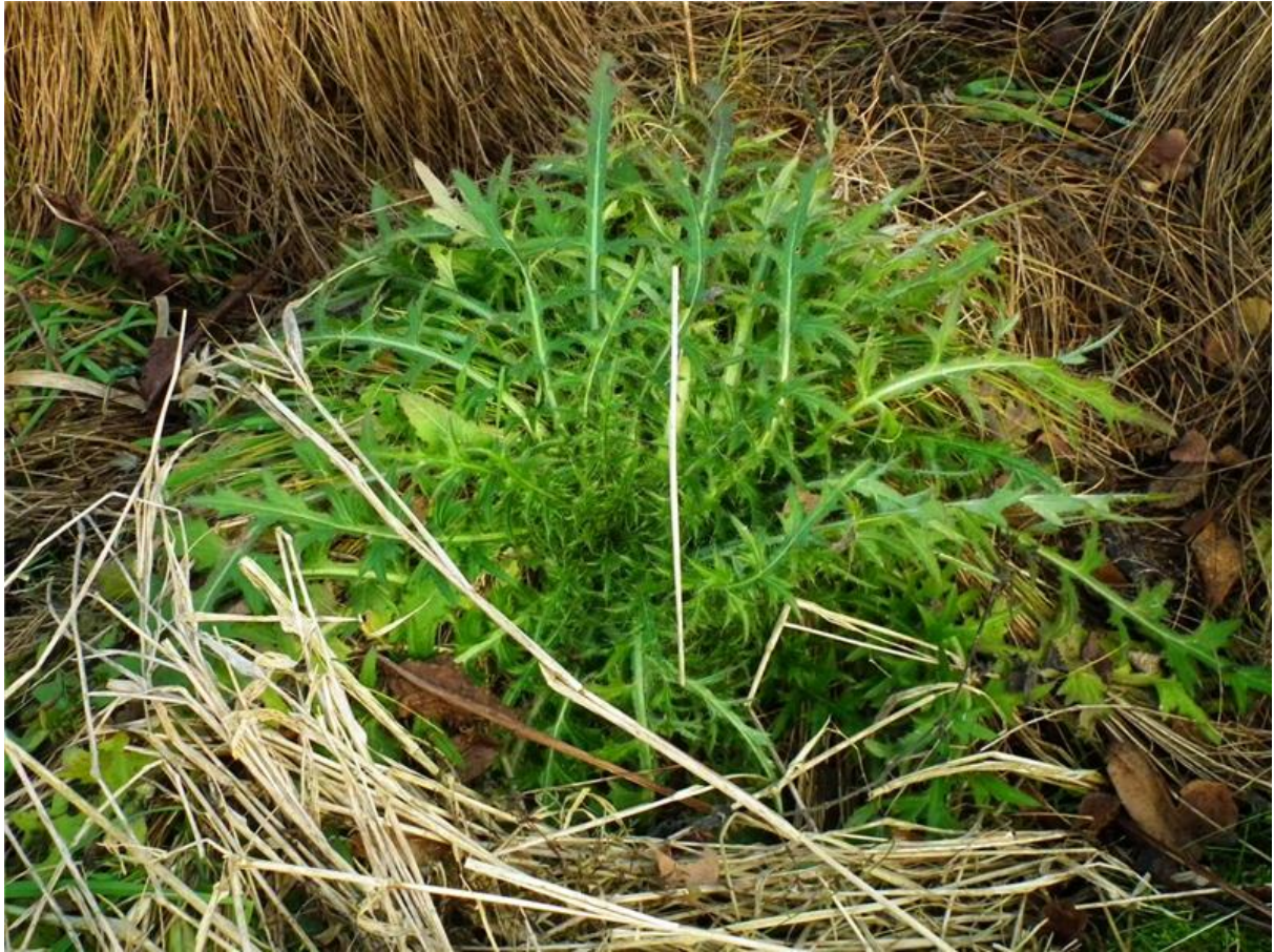
Fot. 4. Ostrożeń błotny Cirsium palustre .