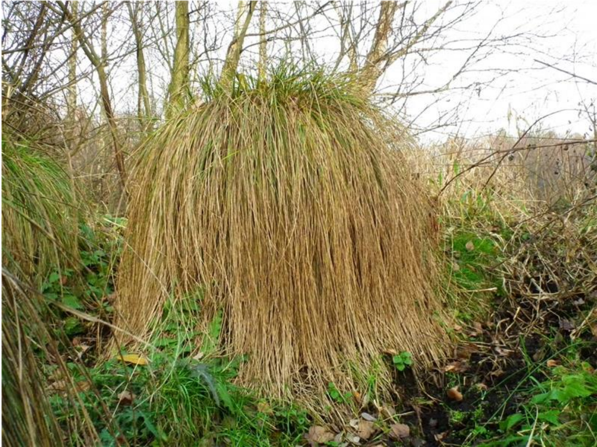
Fot. 3. Pojedyncza kępa turzycy sztywnej Carex elata .