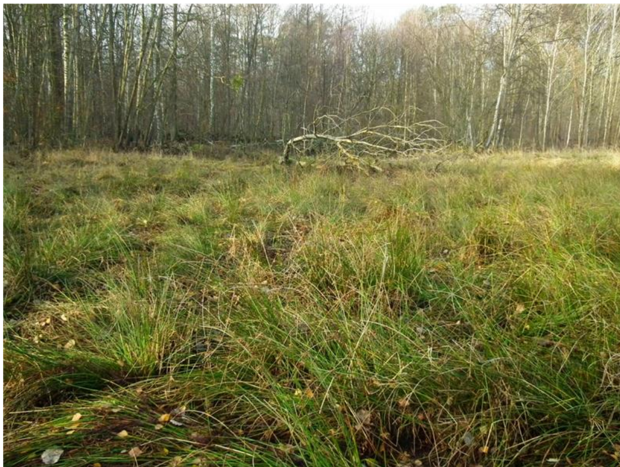
Fot. 1. Widok ogólny projektowanego użytku (część zachodnia). Dominuje zbiorowisko z sitem rozpięchłym Juncus effusus .