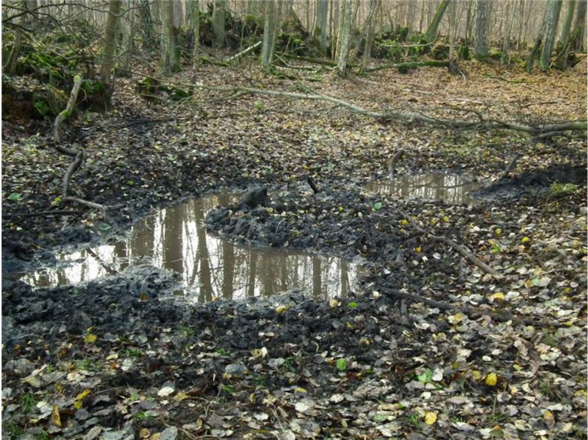
Fot. 5. Babrzysko w części południowo-zachodniej.