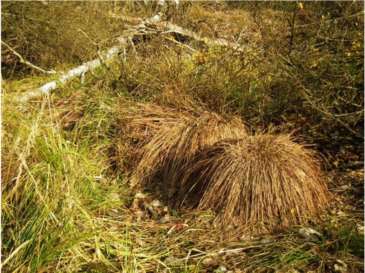
Fot. 4. Zamierające kępy turzycy sztywnej Carex elata .