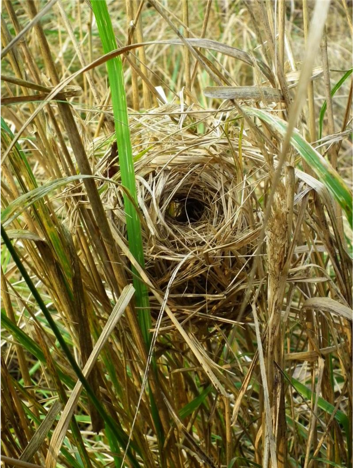
Fot. 6. Gniazdo badylarki Mus minutus .