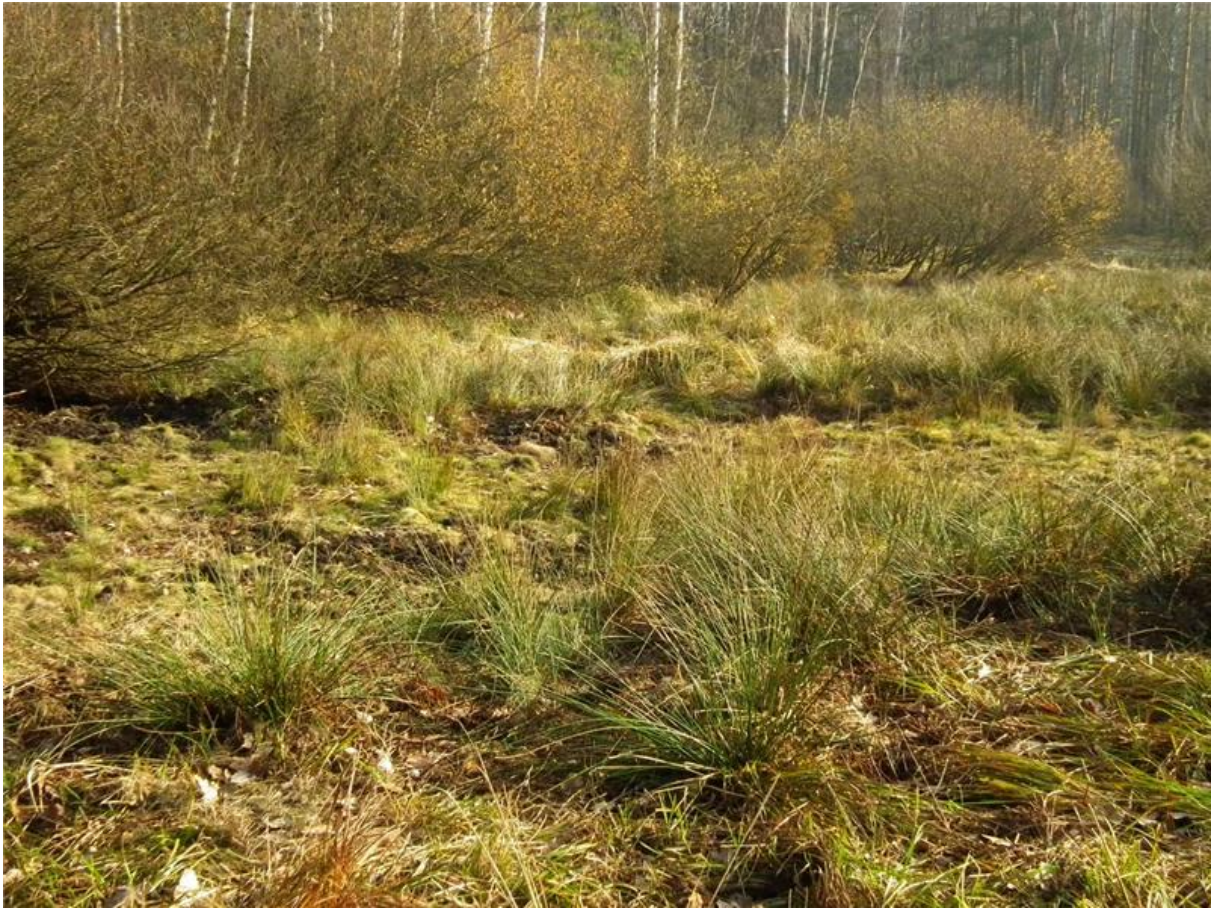
Fot. 3. Zarśla wierzbowe (łozowisko) przy północnej granicy użytku.