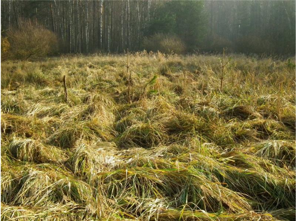
Fot. 2. Trawiaste zbiorowisko (z dominacją trzcinnika piaskowego) w części centralnej.