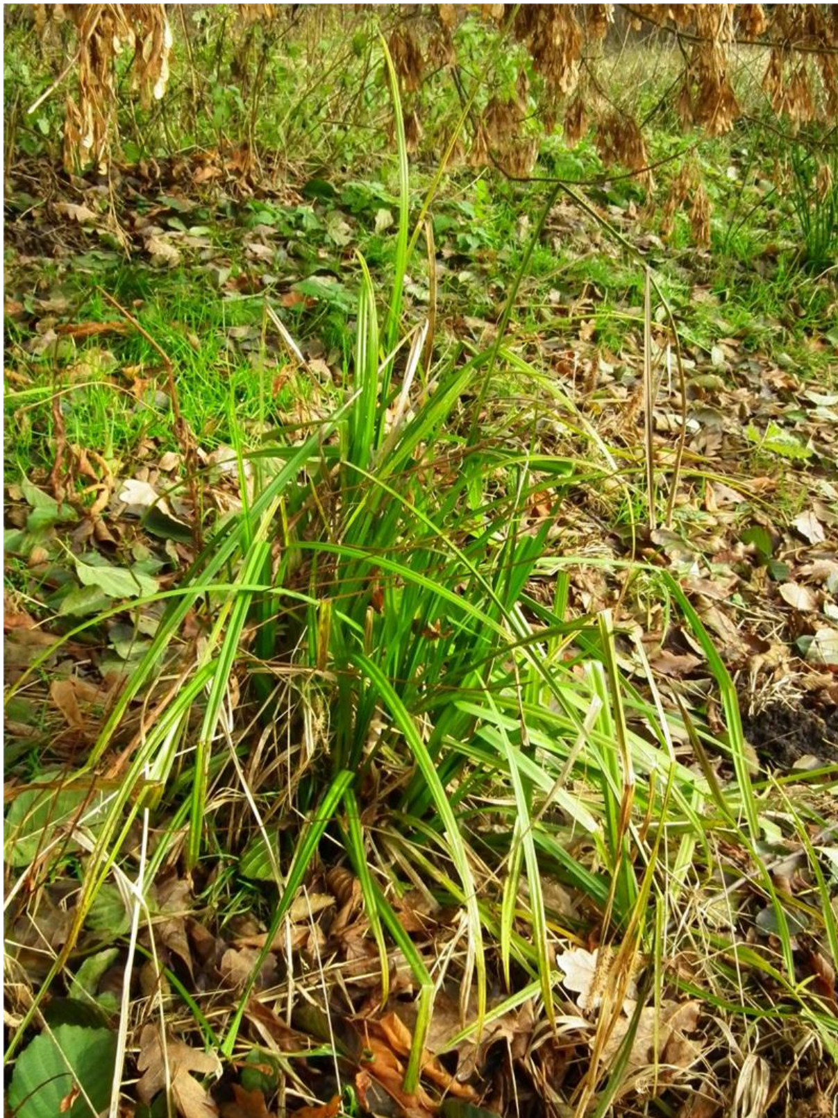
Fot. 2. Turzyca nibyciborowata Carex pseudocyperus – interesujący gatunek mokradłowy.