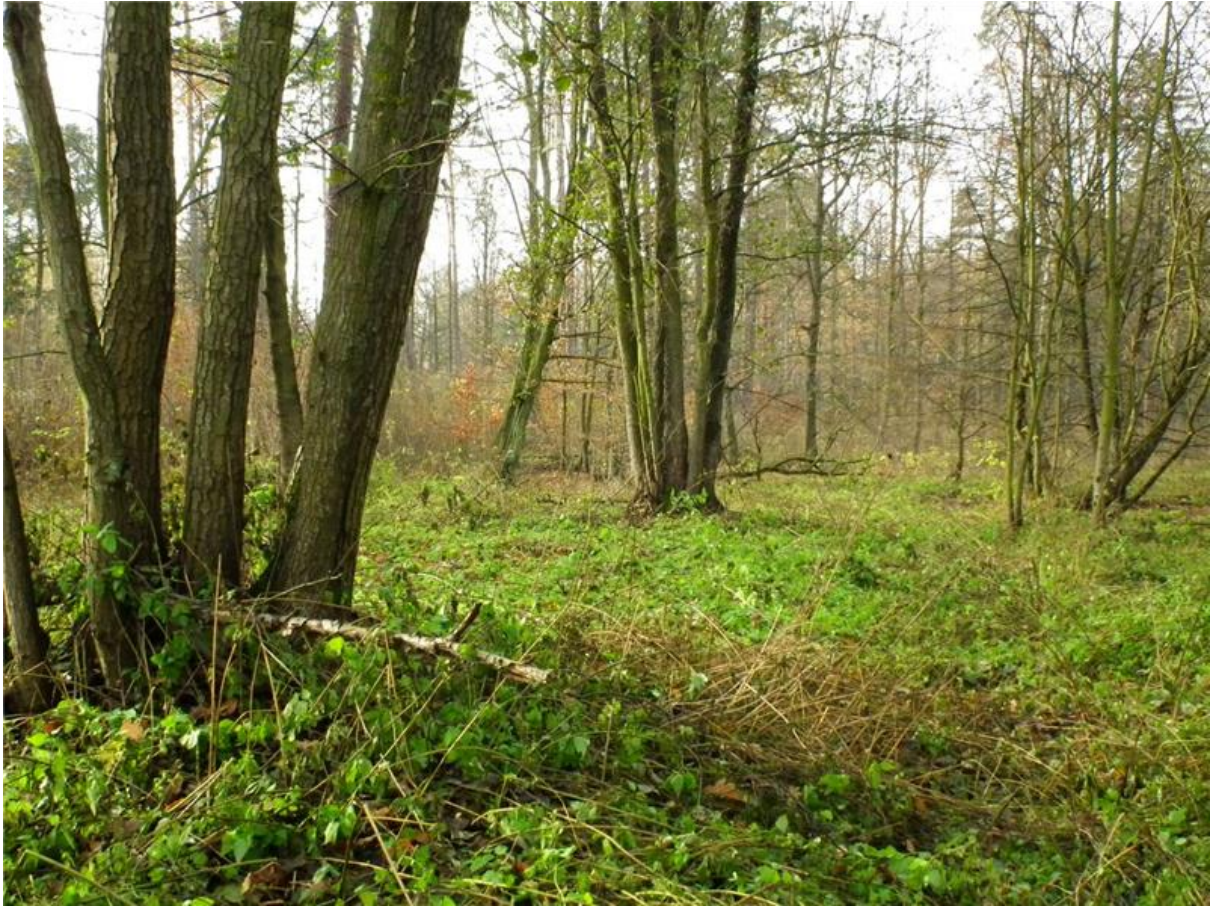
Fot. 3. Ziółorośla z dominacją pokrzywy w zachodniej części użytku, z pojedynczymi kępami olch.