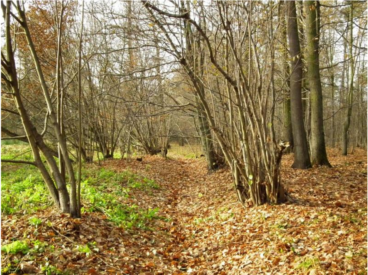
Fot. 4. Płat grądu typowego w sąsiedztwie suchego koryta Piasecznicy.