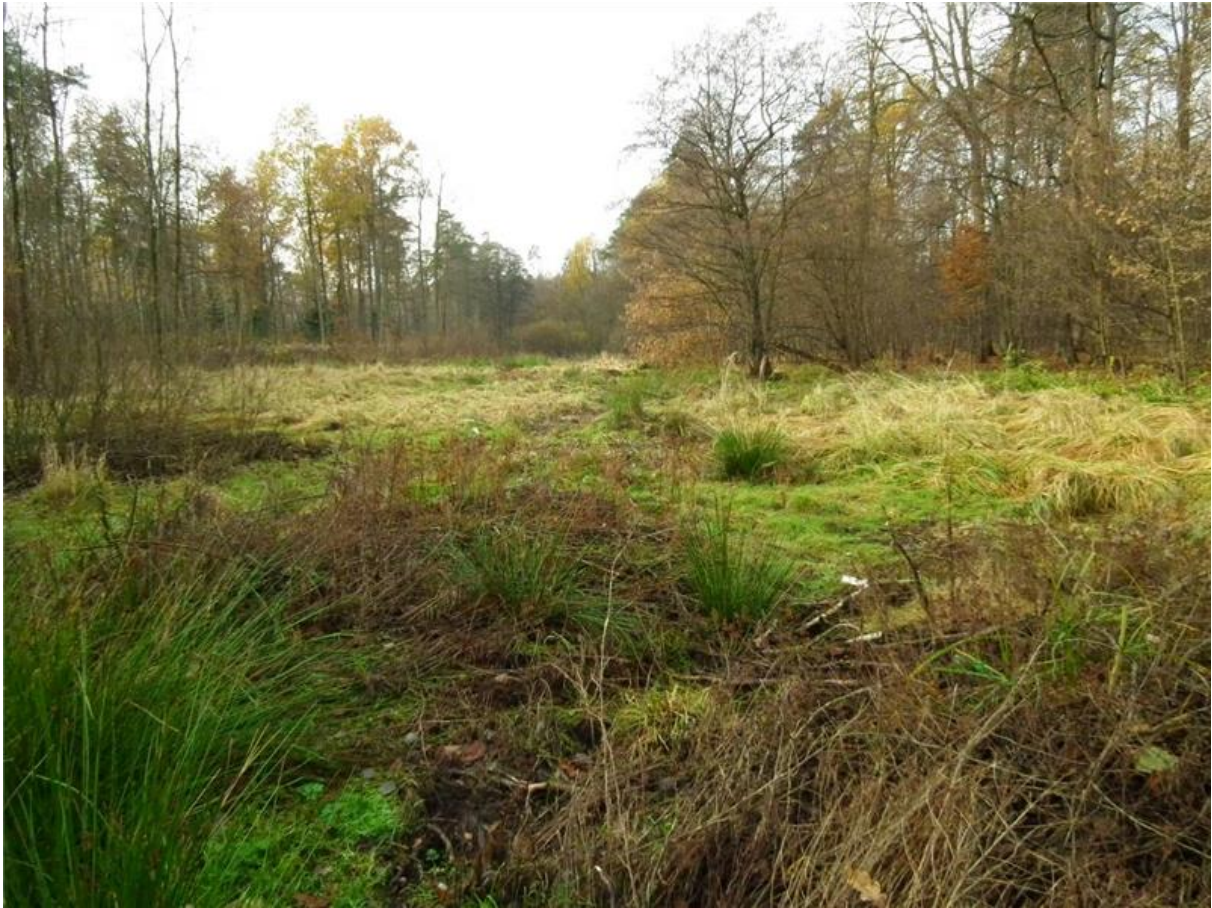
Fot. 1. Zaniedbane łąki we wschodniej części projektowanego użytku.