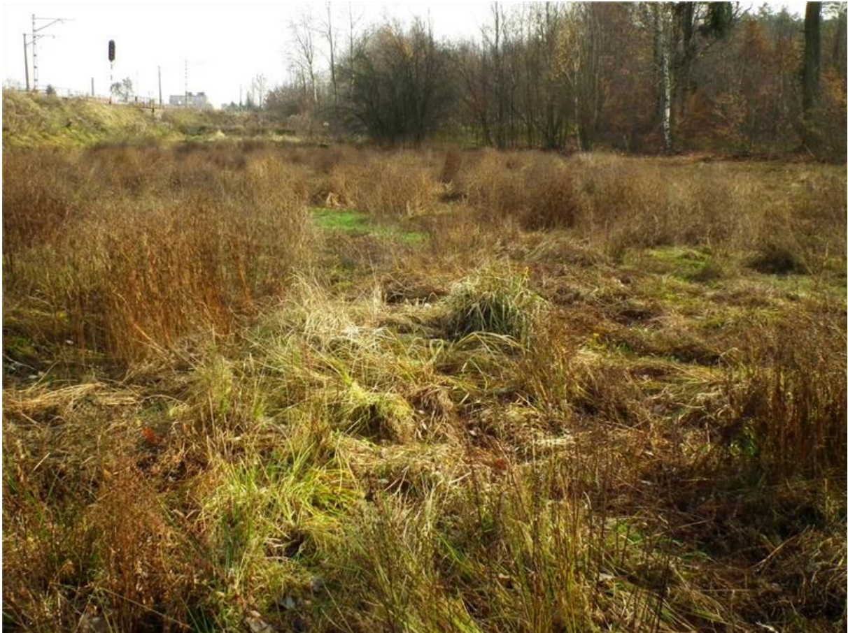
Fot. 1. Zarastające łąki we wschodniej części użytku – miejscami z dominacją uczeptu amerykańskiego Bidens frondosa .