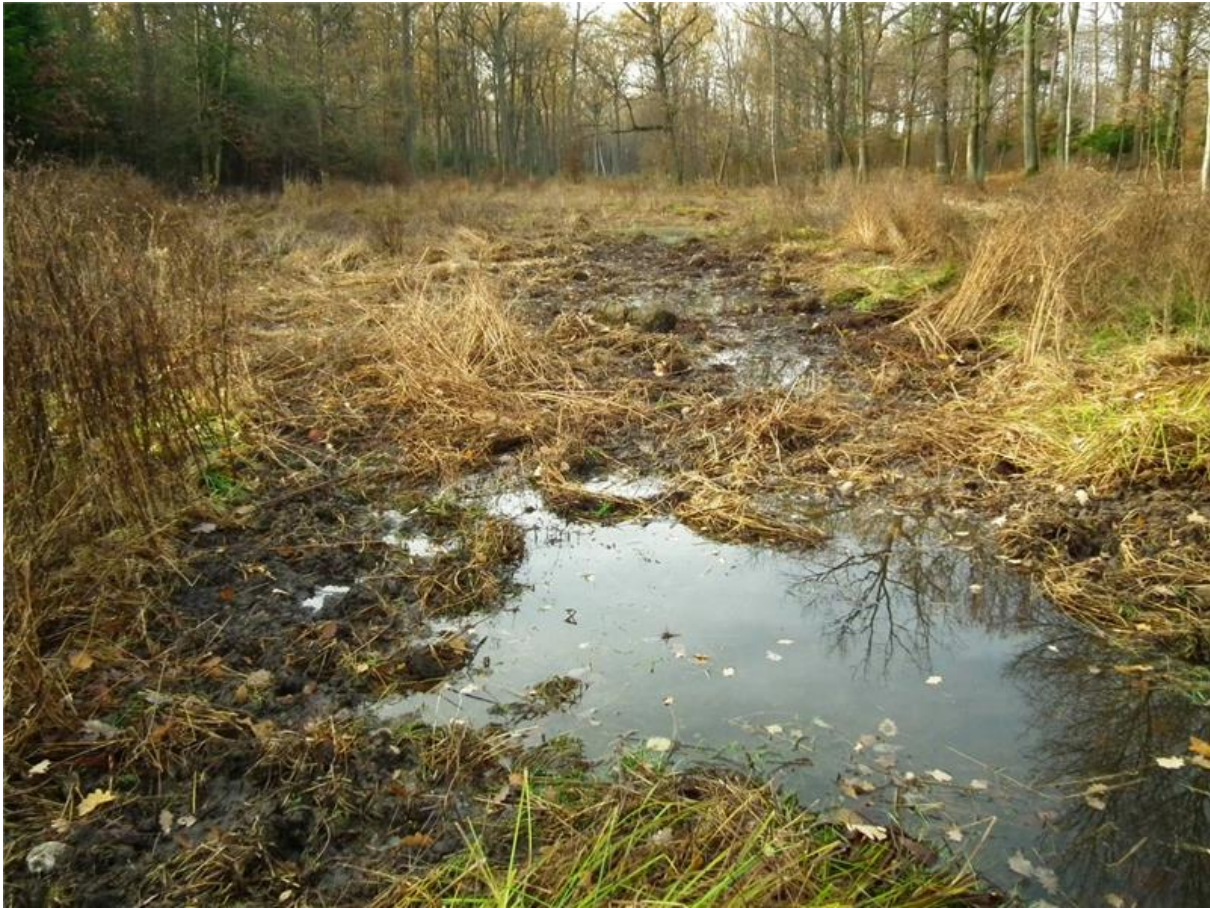
Fot. 2. Rozlewiska we wschodniej części użytku (miejsce chętnie buchtowane przez dziki).