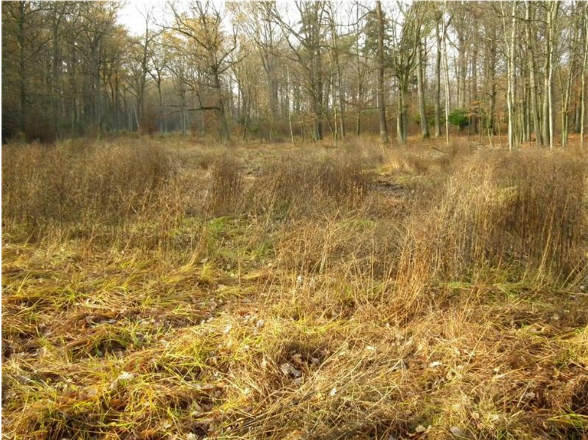
Fot. 4. Fragment zarastających łąk z dominacją mozgi trzcinowej Phalaris arundinacea .