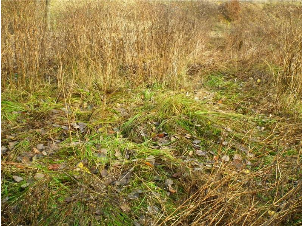
Fot. 3. Kępy turzycy sztywnej Carex elata .