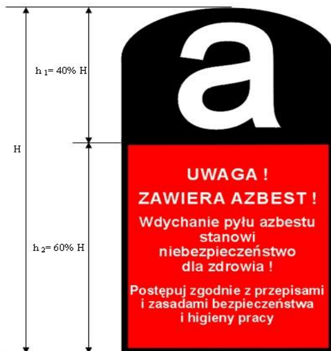
Rys. 2 Wzór oznakowania opakowania zawierającego azbest