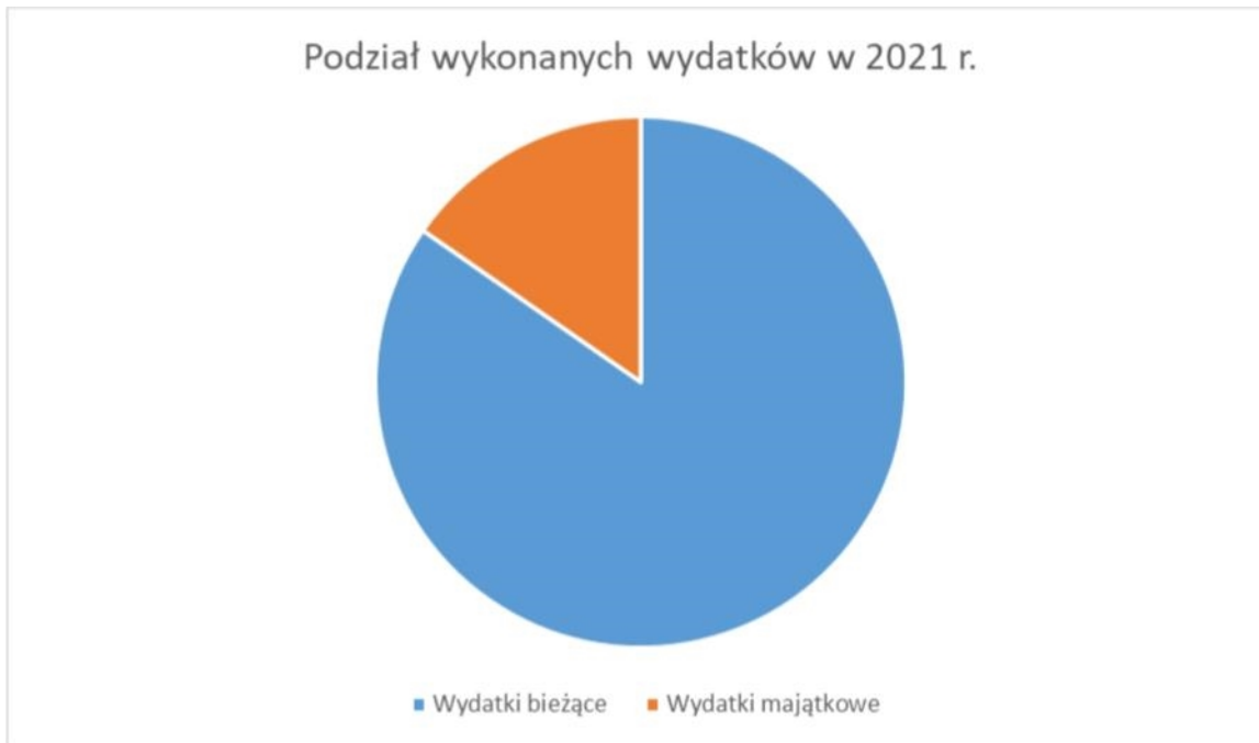
Wykres nr 2. Podział wykonanych wydatków w 2021 roku

Wydatki w 2021 r. zrealizowano m.in. na: