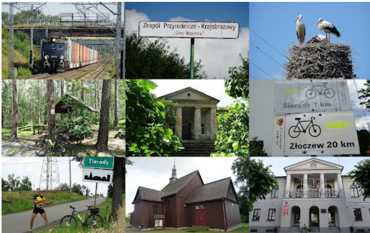
Zdjęcia ze szlaku „Sieradzkiej E-ski”.

zabytkowych dworków w celu tworzenia wspólnych inicjatyw szlaku ułatwiającego zwiedzanie tych miejsc m.in. na trasie „Sieradzkiej E-ski”.