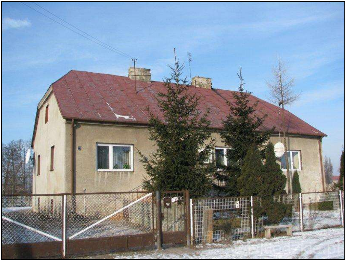
Rysunek 8. Budynek gorzelnii w Łyszkowicach