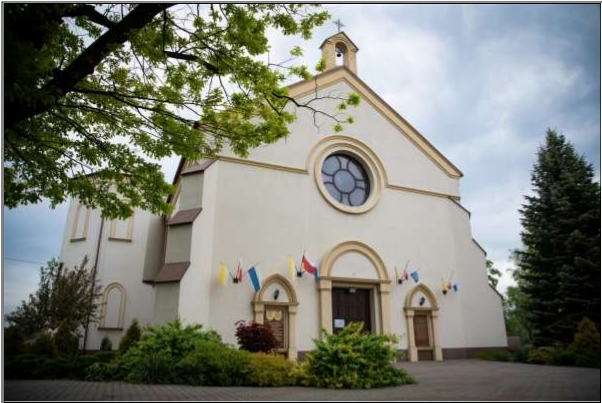
Rysunek 11. Kościół Parafialny p.w. NMP Królowej Polski w Łyszkowicach