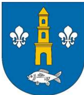
Rysunek 3. Herb Gminy Łyszkowice

Herb Gminy Łyszkowice przedstawia na tarczy hiszpańskiej w błękitnym polu herbowym złotą wieżę między dwiema srebrnymi liliami, pod którymi znajduje się ryba. Wieża ma trzy kondygnacje i trójkątny daszek. W najniższej kondygnacji umieszczona jest otwarta brama, natomiast w kolejnych pojedyncze okna łukowe. Lilie nawiązują do herbu arcybiskupstwa gnieźnieńskiego, do którego dóbr należały Łyszkowice.