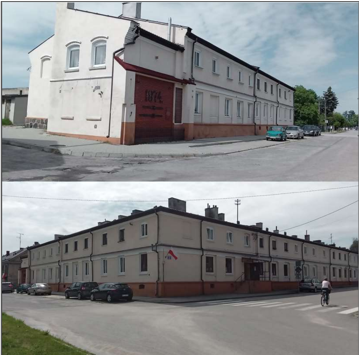
Rysunek 10. Budynek „Mydlarnia” w dawnym zespole cukrowni w Łyszkowicach