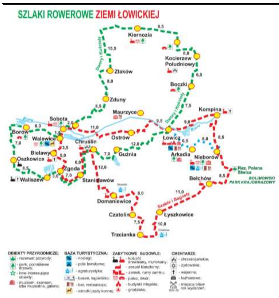
Rysunek 4. Szlaki rowerowe Ziemi Łowickiej