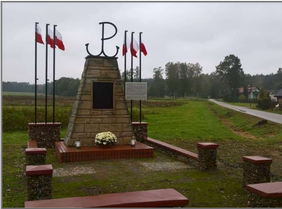
Rysunek 5. Pomnik Cichociemnych w Czatolinie