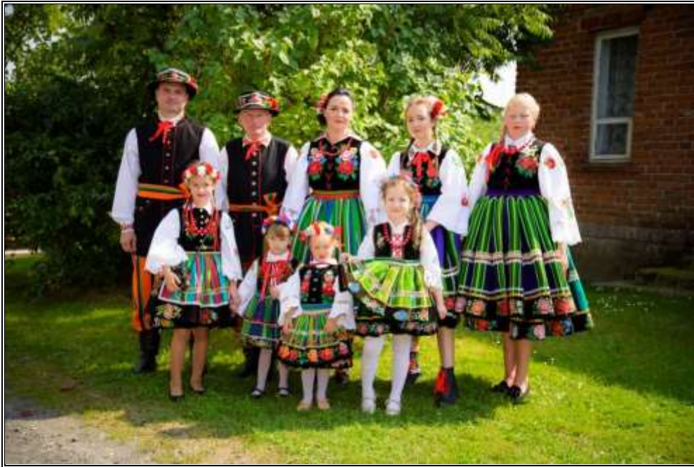
Rysunek 6. Strój łowicki