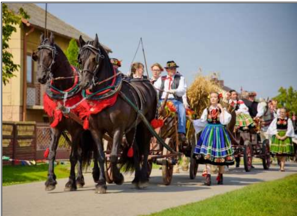
Rysunek 7. Korwód dożynkowy na terenie gminy Łyszkowice