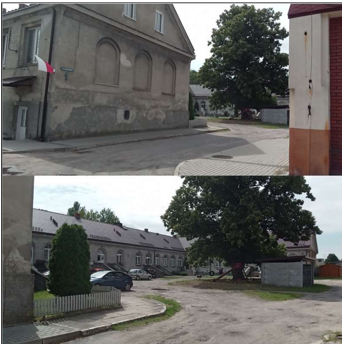
Rysunek 9. Budynek „Podkowa” w dawnym zespole cukrowni w Łyszkowicach