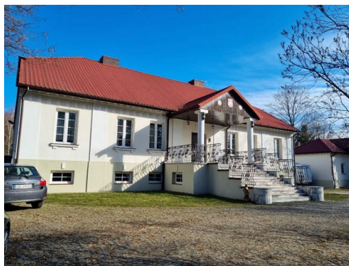
Fotografia 2. Widok na dwór w Dobrzelowie.

Obiekt objęty ochroną poprzez wpis do Rejestru Zabytków Województwa Łódzkiego.