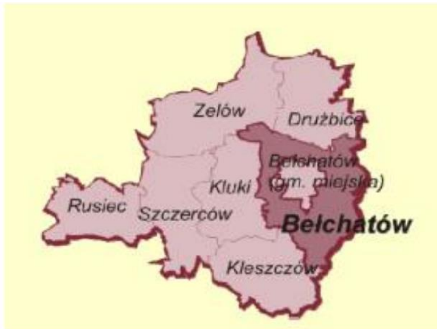
Rysunek 2. Położenie gminy Belchatów na tle powiatu belchatowskiego.

Położenie gminy na tle powiatu belchatowskiego przedstawiono na poniższym rysunku.