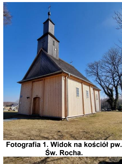
Fotografia 1. Widok na kościół pw. Św. Rocha.

Obiekt objęty ochroną poprzez wpis do Rejestru Zabytków Województwa Łódzkiego.