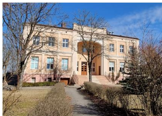
Fotografia 5. Widok na pałac w Łękawie.