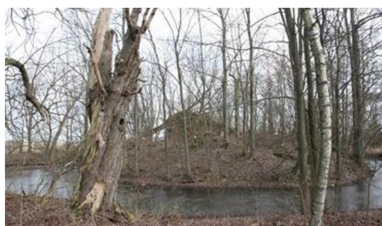
Fotografia 4. Widok na fosę otaczającą ruiny dworu obronnego w Mikorzycach.