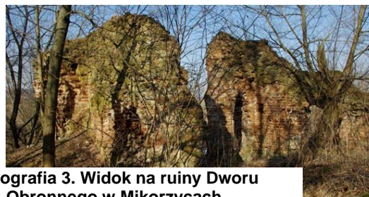
Fotografia 3. Widok na ruiny Dworu Obronnego w Mikorzycach.

Obiekt jest objęty ochroną poprzez wpis do Gminnej ewidencji zabytków dla gminy Bełchatów.