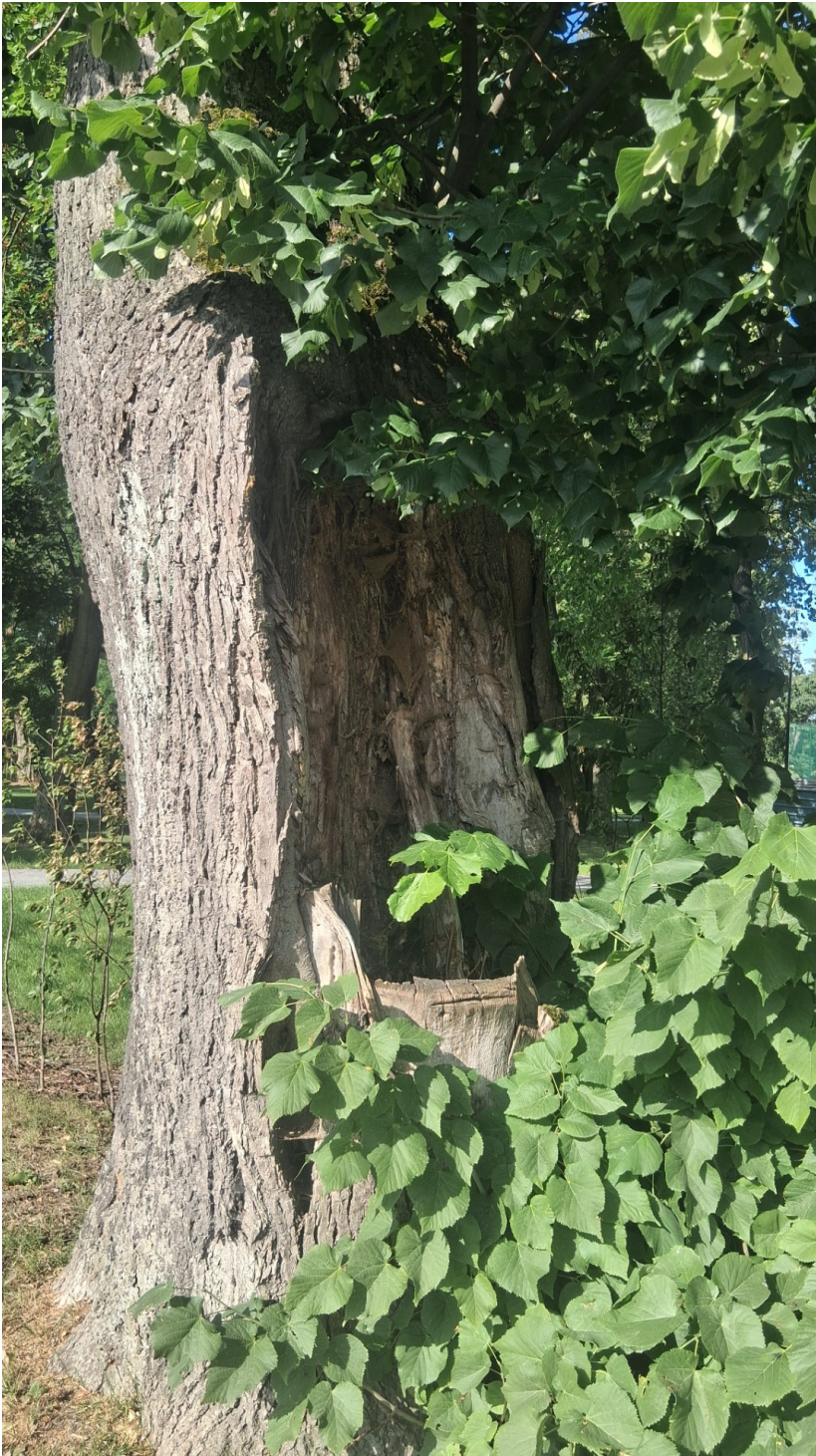
Drzewo nr 2