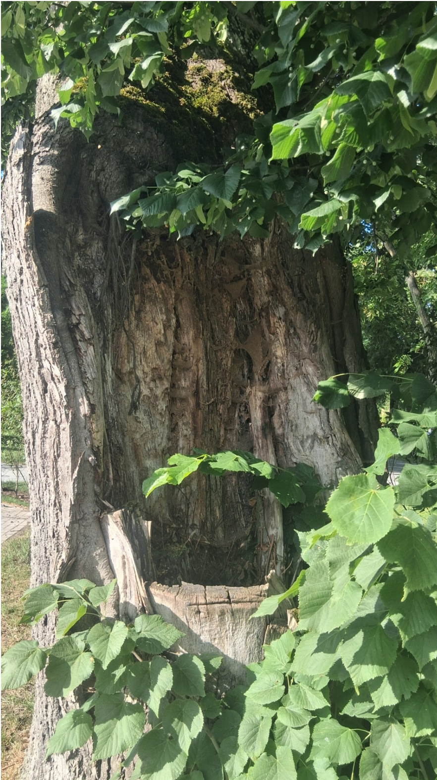
Drzewo nr 2