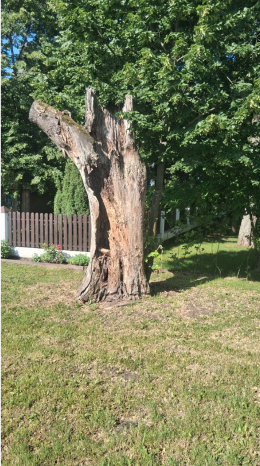
Drzewo nr 1

Załącznik nr 1 do uchwały nr XVII/122/2025 Rady Gminy Rząśnia z dnia 14 listopada 2025 r.