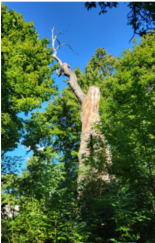
Dąb szypułkowy - Quercus robur rosnący na działce nr ewid. 281/3, obręb geodezyjny Dąbrówka, gm. Sieradz