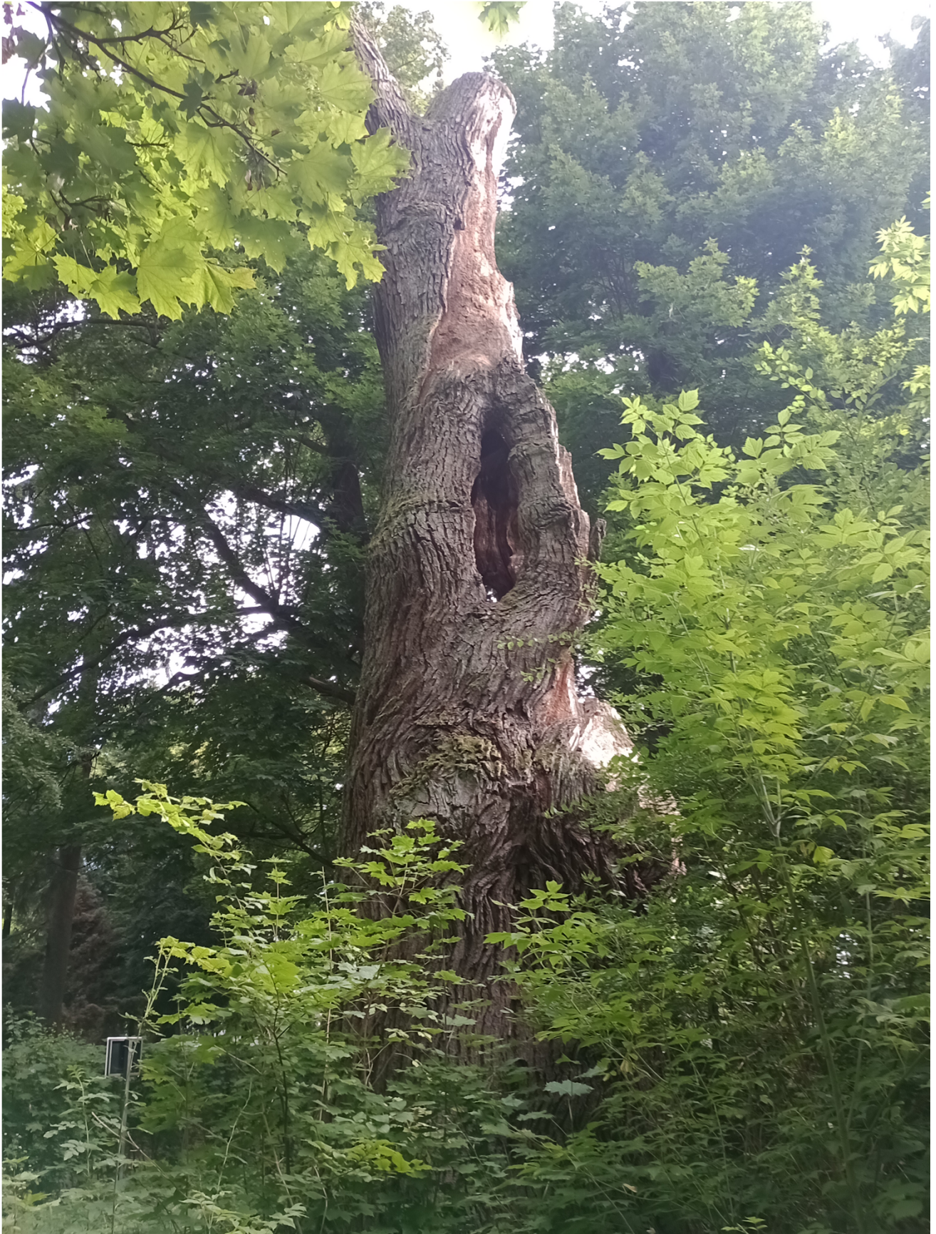
Dąb szypułkowy - Quercus robur rosnący na działce nr ewid. 281/3, obręb geodezyjny Dąbrówka, gm. Sieradz