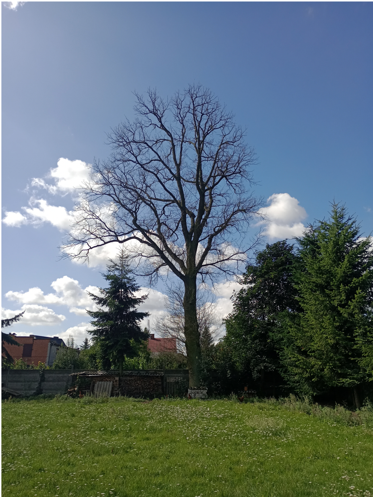
Dąb szypułkowy - Quercus robur rosnący na działce nr ewid. 1303,

Załącznik do uchwały nr XXIII/137/2025 Rady Gminy Sieradz z dnia 16 grudnia 2025 r.