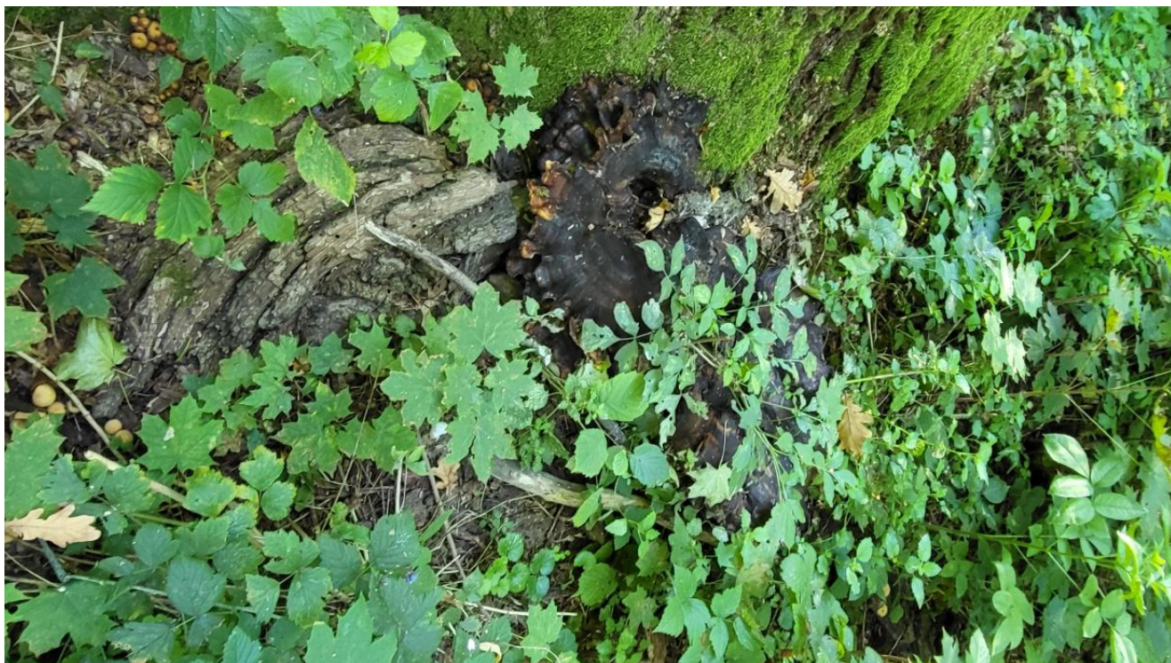
Widok odziomkowej części pnia dębu szypułkowego - Quercus robur rosnącego na działce nr ewid. 281/3, obręb geodezyjny Dąbrówka, gm. Sieradz